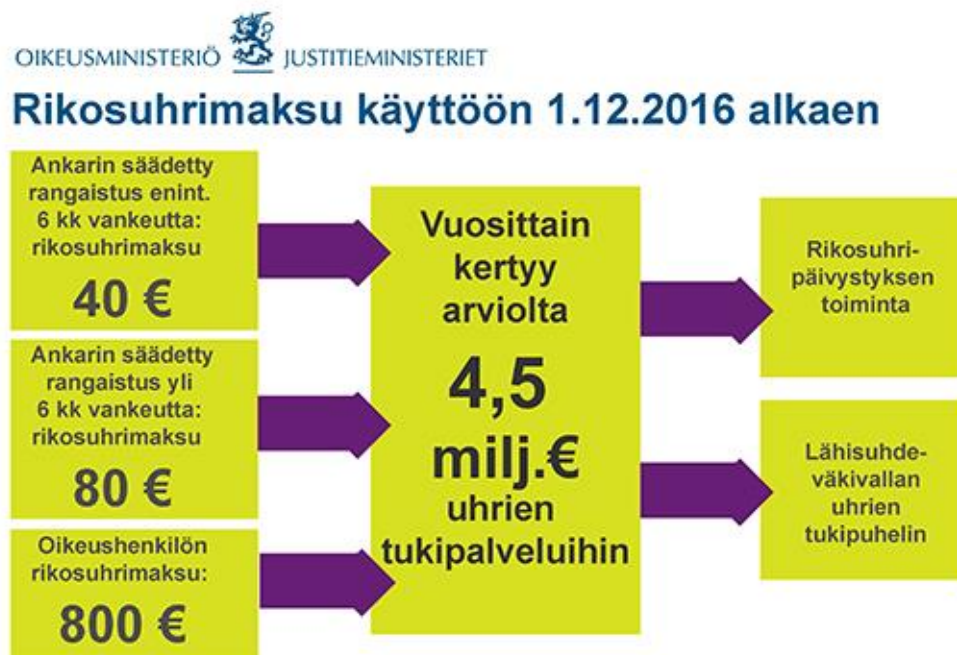
Kaavio 2. Rikosuhrimaksu käyttöön 1.12.2016 alkaen. (Oikeusministeriö 2016)

Poliisien keskuudessa tunnetuin lakimuutos liittyy rikosuhrimaksuun. Rikosuhrimaksua peritään sakkorangaistuksen yhteydessä niistä rikoksista, joista voisi teoreettisesti seurata vankeutta. Uhrimaksulla rahoitetaan uhrien aseman parantamiseen liittyviä toimenpiteitä. Uhrimaksusta saatavia varoja ohjataan lähinnä rikosten uhreille suunnattuihin tukipalveluihin. (Oikeusministeriö 2016.) Rikosuhrimaksujen suuruudet ja niiden ohjautuminen uhrien hyväksi käyvät ilmi kaaviosta 2.