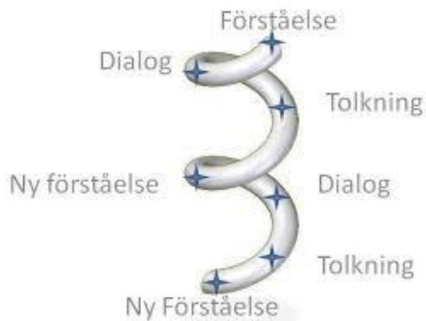
Figur 2 Den hermeneutiska spiralen (Sabina Jordan, 2017, Mer om: Hermeneutik och positivism)

Själv har jag jobbat flera år med förundersökning och även som undersökningsledare. Den erfarenhet använder jag mig naturligtvis av då jag tolkar brottsanmälningarna. I kapitel 3.2 kommer jag att beskriva hur jag tillämpat metoden i praktiken.