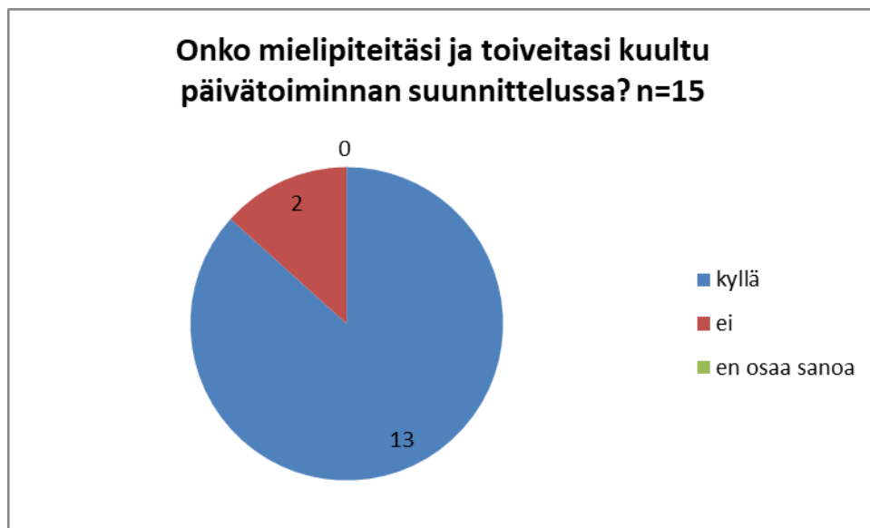
KUVIO 2. Mielipiteiden ja toiveiden kuuleminen

Kysyin asiakkailta, onko heidän mielipiteitä ja toiveita kuultu päivätoiminnan suunnittelussa. Tähän kysymykseen asiakkaat antoivat vastauksia, joista suurimman osan (n=15) pystyin käsittelemään luotettavasti. Osaan (n=2) vastauksista en saanut selkeää kyllä, ei tai en osaa sanoa vastausta. Suurin osa (n=13) asiakkaista koki, että heidän mielipiteitään ja toiveitaan kuullaan päivätoimintaa suunniteltaessa. Pieni osa (n=2) asiakkaista oli sitä mieltä, että tämä ei toteudu heidän kohdallaan. (KUVIO 2.) Asiakkaat eivät halunneet antaa perusteluja sille, miksi he kokivat, että heidän mielipiteitä ja toiveita ei kuulla.