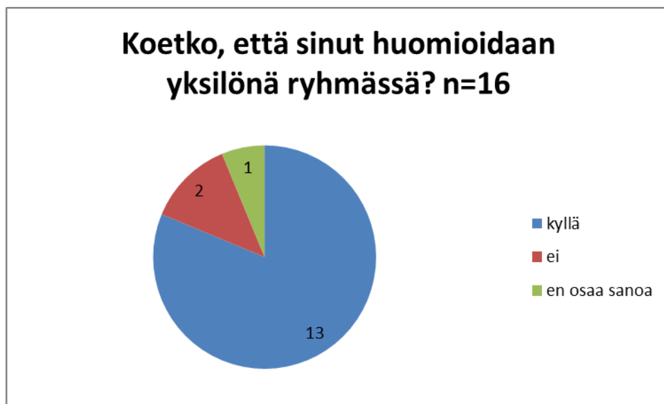
KUVIO 5. Yksilöllinen huomioiminen

Asiakkaat vastasivat kysymykseen, joka liittyi heidän yksilölliseen huomioimiseen ryhmässä. Vastaajista (n=16) suurin osa (n=13) koki, että yksilöllinen huomioiminen on hyvää ja se toteutuu tarvittaessa. Vastaajista osa (n=2) oli kuitenkin eri mieltä ja osa (n=1) ei osannut sanoa mitä mieltä oli. (KUVIO 5.)