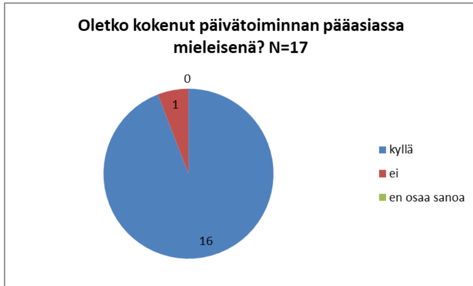
KUVIO 1. Päivätoiminnan mielekkyys

Yhtenä toistuvana teemana esiin nousi päivätoiminnan järjestämät retket. Retket koettiin pääasiassa positiivisina sillä ne auttavat ja rohkaisevat liikkeelle lähtemistä yhteiskuntaan. Myös päivätoimintaryhmään lähteminen koettiin tärkeänä. Päivätoiminta koettiin hyväksi arjen rutiinien piristäjäksi ja sen koettiin tuovan vaihtelua arkeen ja vastapainoa kuntoutuksille.