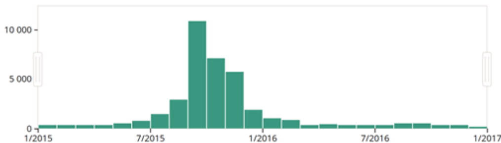
TAULUKKO 1. Maahanmuuttoviraston laskemat turvapaikanhakijoiden määrät kuukausittain 2015–2016 (Maahanmuuttovirasto 2017a, viitattu 21.1.2017)

Turvapaikka-asiat etenivät Maahanmuuttovirastossa käsittelyssään vuoden 2016 loppuun mennessä siihen, että valitusten määrä alkoi näkyä hallinto-oikeuksissa turvapaikka-asioihin liittyvien valitusten määrän kasvulla. Helsingin hallinto-oikeus on vastannut yksin turvapaikka-asioiden käsittelystä vuoden 2016 loppuun saakka. Kuitenkin 1.2.2017 alkaen turvapaikka-asioita hajautettiin niiden suuresta määrästä johtuen myös Pohjois-Suomen hallinto-oikeuteen, Itä-Suomen hallinto-oikeuteen ja Turun hallinto-oikeuteen (HE 234/2016 vp, 1).