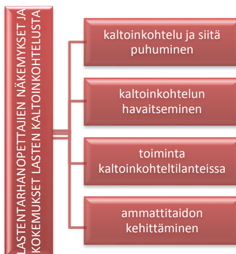
Kuvio 1. Lastentarhanopettajien näkemykset ja kokemukset lasten kaltoinkohtelusta.

Tutkimustulokset raportoidaan teemoittain ja nämä teemat on luotu haastattelukysymysten pohjalta. Teemoja on neljä ja niiden alaluokat on lihavoitu tekstissä. Näitä teemoja ovat kaltoinkohtelu ja siitä puhuminen, kaltoinkohtelun havaitseminen, toiminta kaltoinkohtelutilanteissa ja ammattitaidon kehittäminen (Kuvio 1).