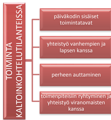
Kuvio 4. Toiminta kaltoinkohtelutilanteissa.

nettelytavat päiväkodissanne on sovittu kaltoinkohtelutilanteiden varalle, miten lähestyt lapsen vanhempia tai huoltajia, kun epäilet lasta kaltoinkohdeltavan, millä tavoin kasvattajat auttavat lasta ja hänen perhettään kaltoinkohtelutapauksissa, missä vaiheessa kasvattajat ottavat yhteyttä lastensuojeluun sekä kuinka usein epäily kaltoinkohtelusta on johtanut toimenpiteisiin (Kuvio 4).