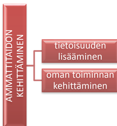
Kuvio 5. Ammattitaidon kehittäminen.

Lastentarhanopettajat mainitsivat haastatteluissa tietoisuuden lisäämisen kaltoin-kohteluun liittyvissä asioissa. Kasvattajien tietoutta kaltoin-kohtelun sisällöstä tuli- si lisätä, sillä heidän mukaan joillakin saattaa olla vielä sellainen käsitys, että kal- toin-kohtelu on vain fyysistä pahoinpitelyä. Tietoa kaltoin-kohtelun vaikutuksista lapsiin tulisi myös lisätä, jotta kasvattajat osaisivat paremmin tunnistaa sellaisia asioita lapsen käyttäytymisestä, jotka viittaavat kaltoin-kohteluun. Lastentarhan- opettajat toivat esiin sen, että kasvattajien tulisi pystyä tunnistaa merkkejä kal- toin-kohtelusta ja huomata mahdollisesti siihen viittaavia asioita esimerkiksi sil- loin, jos lapsi on vetäytyvä. Toisaalta lastentarhanopettajat olivat sitä mieltä, että kaltoin-kohtelu ei näy lapsessa välttämättä mitenkään.