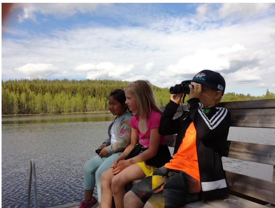
KUVA 13. Kiikarointia Sompalassa

Perttulan (2007, 55–56) mukaan elämyksellisyyden määrittelemisen omakohtaiseksi kokemukseksi johtaa siihen, että elämysten arkisuus voi tulla muille kuin itse kokijalle yllätyksenä. Yksityiset kokemukset ovat sidoksissa kokijan elämäntilanteeseen, johon elämyksellisyys suuntautuu. Näin ollen toisen kokemaa elämystä ei voida aliarvioida tai kyseenalaistaa. Luontoseikkailussa toteutettu lauttalla siirtyminen saareen oli osalle lapsista elämyksellinen kokemus. Vaikka lasten turvallisuus siirtymävaiheessa oli huolellisesti varmistettu ja sanalliset ohjeet olivat selkeät, silti monet kokivat sen jännittävänä. Havaintojemme mukaan muutamat kokivat itsensä ylittämisen kokemuksen, jolloin jännitys muuttui kokemukseksi rohkeudesta ja onnistumisesta. Yllätyksellisiä elämyksiä havaitsimme, maahanmuuttotilanteen lapsen kertoessa, ettei ole eläessään kuin yhden kerran aikaisemmin kiikaroinut. Kiireetön Sompalan luonnon kiikarointi oli siten hänelle vaikuttava elämys (kuva 13).