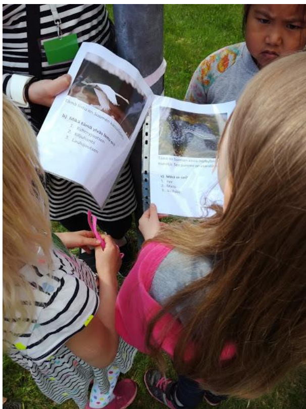
KUVA 10. Luontoseikkailu

Leiriohjelmaan kuului myös vapaata ohjelmaa, jolloin lapset saivat halutessaan pelata erilaisia pelejä tai kokeilla erilaisia toimintoja, joita olimme suunnitelleet toimintaympäristöön. Näiden pelien ja toimintojen kautta lapsilla oli mahdollisuus leikinomaisin keinoin harjoittaa matemaattisia taitoja. Kokeellista ja tutkivaa oppimista lapset saivat toteuttaa suurten saippuakuplien tekemisen kautta.