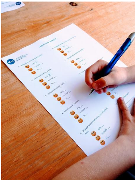
KUVA 12. Palautelomakkeen täyttöä

Osallisuuden kannalta merkittävää oli myös palautteen kerääminen leirin jälkeen lapsilta (kuva 12). Palautelomakkeena käytimme hyväksi havaitsemaamme MLL:n kaavaketta (liite 6). Saimme vastauksia yhteensä 25 eli jokainen leiriläinen antoi palautetta. Lapsilta kysyttiin palautetta muun muassa paikasta, jossa leiri järjestettiin, leirin yhteishengestä, ohjaajista sekä lasten kiinnostuksesta osallistua vastaavalle leirille uudestaan.