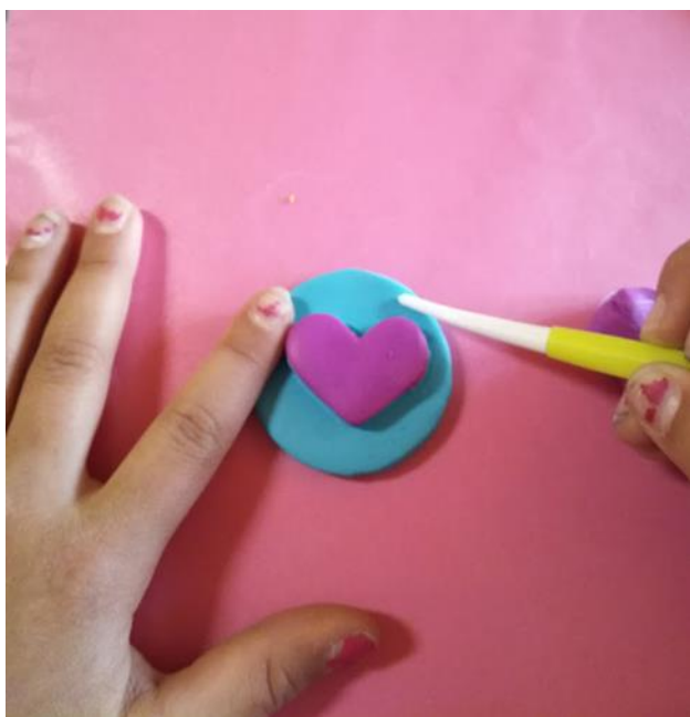
KUVA 6. Fimo-massan muotoilua.

Kuvallisen ilmaisun monet muodot näyttäytyivät Fimo-massan muotoilussa suunnittelutaitoina, luovina ongelmanratkaisuina sekä massan muotoiluun liittyviin rakenteisiin, välineisiin ja tekniikoihin tutustumisena (kuva 6). Lapset saivat kokemuksen ja oivaltamisen iloa, jolloin heidän oma luovuus ja kädenjälki näkyivät konkreettisina tuotoksina. Fimo-massa muotoilun pedagoginen suunnittelu sekä toteutus olivat meidän opinnäytetyöntekijöiden vastuulla (liite 5).