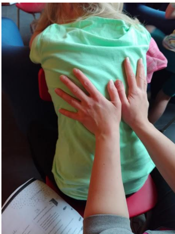
KUVA 4. Satuhierontaa

Leirillä toteutettiin myös satuhierontahetki (kuva 4). Satuhieronnan aikana lapsille luettiin satua, jota kosketus ja käsillä tehtävät liikkeet havainnollistivat. Tätä niin sanottua kosketuskuvitusta tehtiin lapsen selkään ja käsivarsiin. Satuhierontahetkessä mahdollistettiin eläytyminen tarinaan sekä rauhoittuminen ennen nukkumanmenoa.