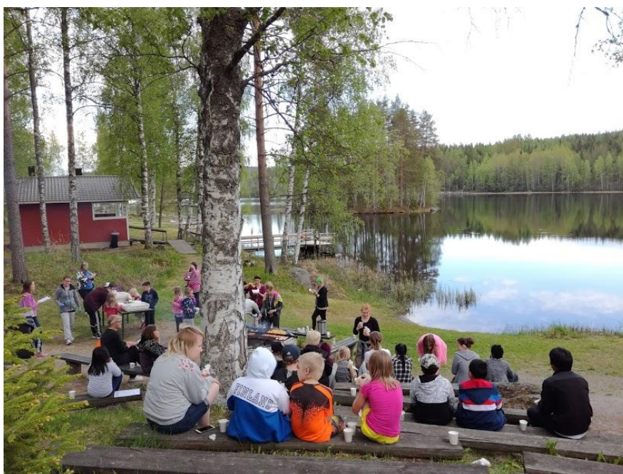
KUVA 8. Nuotioilta

Leirin yhteisöllisyyttä tuettiin ryhmäytymisleikkien ja yhteisten toimintojen kautta. Lapset saivat leirin aikana kokea koko leirijoukon yhteisiä hetkiä kuin myös oman pienryhmän toimintaa. Ryhmämuotoisia toimintoja olivat kaikki pajatyypiset toiminnot, kuten kauneudenhoitopiste ja lennokkipaja. Kaikille yhteisiä hetkiä olivat esimerkiksi lipunnosto- ja lasku, yhteiset ulkopelihetket sekä uiminen ja saunominen. Lipunnosto, nuotioilta (kuva 8) ja kokemus savusaunassa saunomisesta liittyivät myös kulttuuriperinnön vaalimiseen. Näistä traditioista ja niihin liittyvistä tavoista keskusteltiin lasten kanssa.