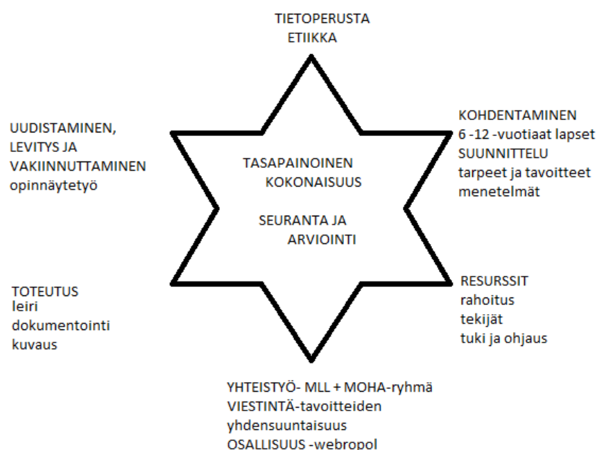
KUVIO 3. Laatutähti Lapset ensin -leirin suunnittelussa, toteutuksessa ja arvioinnissa

Sovelsimme laatutähteä leirin suunnittelussa, toteutuksessa ja arvioinnissa (kuvio 3). Laatutähden kuuden eri sakaran sisällöt näyttäytyivät leirin suunnitteluvaiheessa sekä selkeinä kokonaisuuksina, sekä toisiinsa luontevasti limittyvinä, että eri järjestyksessä. Visuaalisena apuvälineenä tähden sakarat auttoivat meitä hahmottamaan suunnittelussa huomioitavia yksityiskohtaisia seikkoja, joista kokonaisuus muodostui.