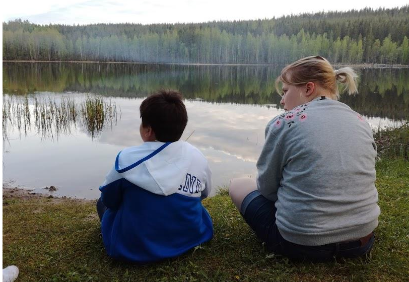
KUVA 9. Kaveritoimintaa leirillä

Kaveritoiminta edistää varhaiskasvatussuunnitelman perusteissa mainittua Minä ja meidän yhteisöme -oppimisen aluetta. Kaveritoiminta tukee osaltaan lasten kulttuuriseen osaamiseen, vuorovaikutukseen ja ilmaisuun sekä ajatteluun ja oppimiseen liittyvää laaja-alaista osaamista. (Opetushallitus 2016a, 31.) Lisäksi kanssakäyminen eri-ikäisten ihmisten kanssa antaa lapselle ja nuorelle valmiuksia ymmärtää lähiyhteisön monimuotoisuutta (kuva 9).