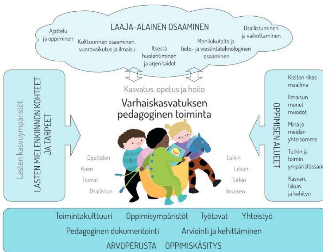
KUVA 1. Varhaiskasvatuksen pedagogisen toiminnan viitekehys (Opetushallitus, s.a.)

Uusi varhaiskasvatussuunnitelman perusteet hyväksyttiin syksyllä 2016. Varhaiskasvatussuunnitelman perusteet on varhaiskasvatuslain (19.1.1973/36, 8.5.2015/580) perusteella Opetushallituksen antama kolmitasoinen määräys, jonka mukaan valtakunnallinen, paikalliset ja lasten varhaiskasvatussuunnitelmat laaditaan, varhaiskasvatusta toteutetaan ja arvioidaan. Varhaiskasvatuksella tarkoitetaan lapsen suunnitelmallista ja tavoitteellista kasvatuksen, opetuksen ja hoidon muodostamaa kokonaisuutta, jossa painottuu erityisesti pedagogiikka (kuva 1). Ohjeistuksen tarkoituksena on turvata varhaiskasvatukseen osallistuville lapsille yhdenvertaiset edellytykset kokonaisvaltaiseen kasvuun, kehitykseen ja oppimiseen. (Opetushallitus 2016a, 4; Varhaiskasvatuslaki 8.5.2015/580, § 1.)