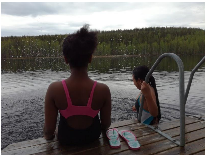
KUVA 7. Yhteisiä hetkiä veden äärellä

Leirin yhteisöllisyyttä tuettiin ryhmäytymisleikkien ja yhteisten toimintojen kautta. Lapset saivat leirin aikana kokea koko leirijoukon yhteisiä hetkiä kuin myös oman pienryhmän toimintaa. Ryhmämuotoisia toimintoja olivat kaikki pajatyypiset toiminnot, kuten kauneudenhoitopiste ja lennokkipaja. Kaikille yhteisiä hetkiä olivat esimerkiksi lipunnosto- ja lasku, yhteiset ulkopelihetket sekä uiminen ja saunominen. Lipunnosto, nuotioilta (kuva 8) ja kokemus savusaunassa saunomisesta liittyivät myös kulttuuriperinnön vaalimiseen. Näistä traditioista ja niihin liittyvistä tavoista keskusteltiin lasten kanssa.