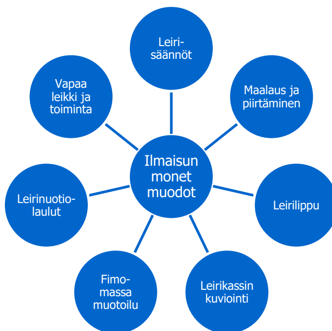
KUVIO 5. Ilmaisun monet muodot Lapset ensin -leirin toiminnoissa

Ilmaisun monet muodot -oppimisalue näyttäytyi leiritoiminnassa kokonaisvaltaisena, ilmaisun eri muotojen luovana yhdistelemisenä (kuvio 5). Leirin toimintoja oli ennalta suunniteltu, mutta myös spontaaniudelle jätettiin tilaa. Jokaisen lapsen yksilöllistä ilmaisua pyrittiin leirin aikana tukemaan ja lasten toiveille yhteisistä luovista toiminnoista annettiin aikaa ja tilaa.