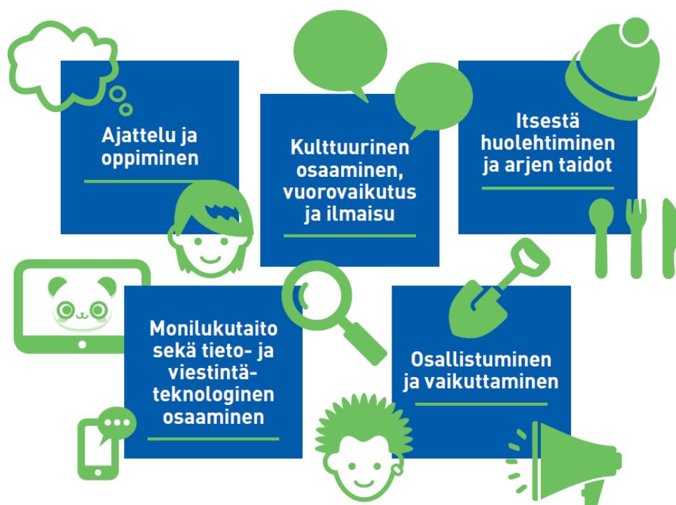
KUVA 2. Laaja-alainen osaaminen (Opetushallitus 2017b.)

Varhaislapsuudesta alkava oppimisen ja osaamisen kehittyminen jatkuu läpi elämän. Suomalaisessa kasvatus- ja koulutusjärjestelmässä vallitsee yhtenäinen arvoperusta, joka turvaa lapselle ja nuorelle johdonmukaisesti etenevän oppimisen polun. Varhaiskasvatussuunnitelman perusteissa kuvatut laaja-alaisen osaamisen tavoitteet kulkevat siten jatkumona esi- ja perusopetuksen opetussuunnitelmien perusteisiin. (Opetushallitus 2016a, 16.)