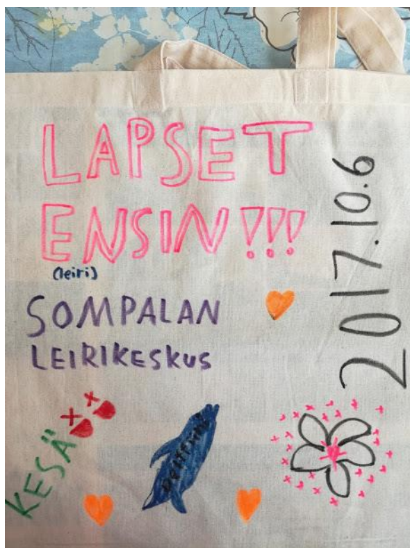
KUVA 5. Leirikassi

Kuvallisen ilmaisun monet muodot näyttäytyivät Fimo-massan muotoilussa suunnittelutaitoina, luovina ongelmanratkaisuina sekä massan muotoiluun liittyviin rakenteisiin, välineisiin ja tekniikoihin tutustumisena (kuva 6). Lapset saivat kokemuksen ja oivaltamisen iloa, jolloin heidän oma luovuus ja kädenjälki näkyivät konkreettisina tuotoksina. Fimo-massa muotoilun pedagoginen suunnittelu sekä toteutus olivat meidän opinnäytetyöntekijöiden vastuulla (liite 5).