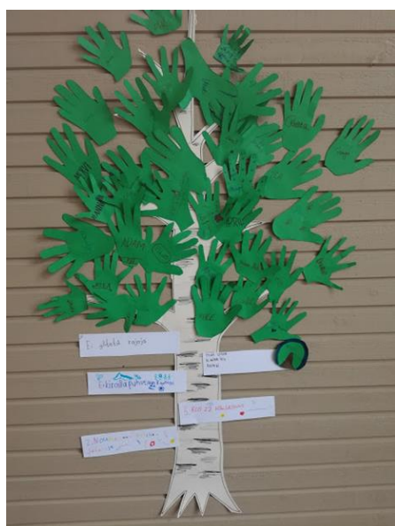
KUVA 3. Sääntöpuu

Kielten rikas maailma -oppimisen alue näkyi leirin alussa yhteisten leirisääntöjen laatimisena (kuva 3). Opinnäytetyöntekijöinä meillä oli vastuu yhteisten leirisääntöjen laatimisen pedagogisesta suunnittelusta sekä toteutuksesta (liite 5). Lapset toivat itse esille, kuinka tärkeää leirin aikana on huomioida esimerkiksi puheenvuorot, ystävällinen puhetyyli ja kiroilemattomuus. Lasten kielellinen ilmaisu oli leirisääntöjä laadittaessa rikasta ja kuvailevaa.