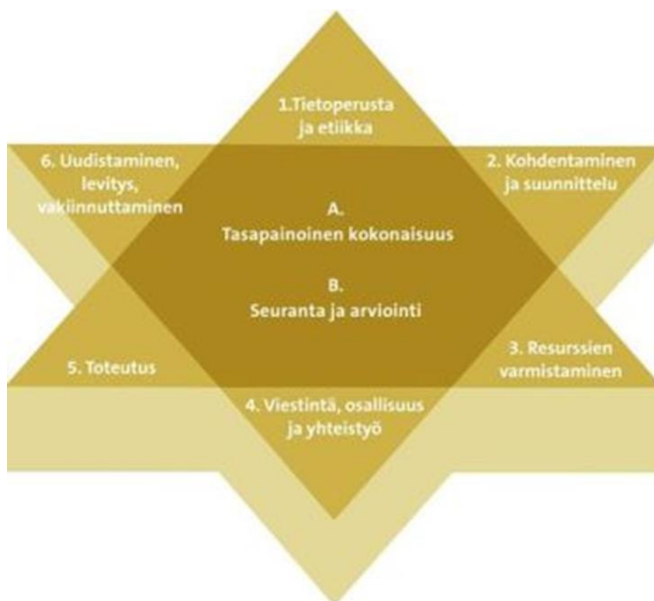
KUVIO 2. Laatutähti (THL 2013.)

Laatutähti koostuu kahdeksasta eri tehtävästä, jotka liittyvät työn kehittämiseen. Tähten ytimessä ovat "Tasapainoinen kokonaisuus" sekä "Seuranta ja arviointi". Näitä on tarkkailtava koko prosessin ajan. Laatutähden keskeinen idea on tasapainoisen kokonaisuuden muodostaminen, jolloin työsuunnitelma on johdonmukainen ja toteuttamiskelpoinen. Kehittämistyön olennaiset tehtävät on nimetty selkeästi ja niiden yhteensopivuus on varmistettu. (THL 2013; Soikkeli ja Warsell 2013, 12–13.)