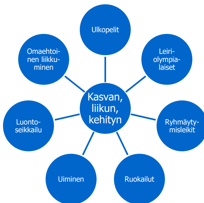
KUVIO 8. Kasvan, liikun, kehityksen Lapset ensin -leirin toiminnoissa

Varhaiskasvatussuunnitelman perusteiden laaja-alaisessa osaamisessa painotetaan itsensä huolehtimiseen, terveyteen ja turvallisuuteen liittyviä taitoja (Opetushallitus 2016a, 17). Leirin struktuuri eli suunniteltu vuorokausirytmii ja sen toistuvuus auttoivat lapsia hahmottamaan ajan kulumista ja ohjelman etenemistä. Samalla luotiin lapsille turvallisuuden tunnetta. Leiriläiset opettelivat ohjaajien avustuksella itsestä huolehtimisen taitoja. Näihin liittyivät esimerkiksi ajoissa yhteisiin hetkiin saapumiset ja omista tavaroista huolehtiminen. Kasvan, liikun ja kehityksen oppimisen alueen sisällöt toteutuivat vahvasti Lapset ensin -leirillä (kuvio 8). Leirille suunnitelluista sisällöistä useat toiminnot liittyivät tähän oppimisen alueeseen.