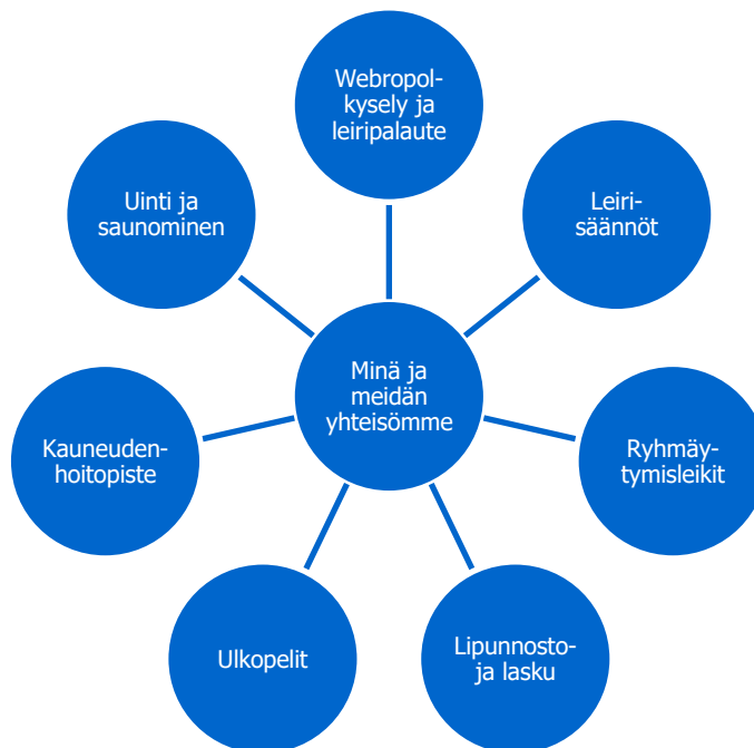
KUVIO 6. Minä ja meidän yhteisömme Lapset ensin -leirin toiminnoissa

Kolmannen oppimisen alueen teemat näkyivät jo leiritoiminnan suunnittelu- ja palautteenkeruu vaiheessa (kuvio 6). Webropol- ja palautekysely mahdollistivat lapsille kuulluksi tulemisen sekä osallisuuden leirin sisällön suunnitteluun ja arviointiin. Palautelomakkeessa lapset saivat arvioida omia, leirin aikaisia subjektiivisia ja yhteisöllisiä kokemuksiaan.