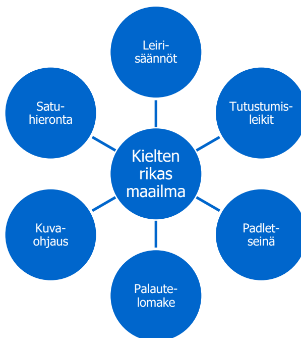
KUVIO 4. Kielten rikas maailma Lapset ensin -leirin toiminnoissa

Kielten rikas maailma -oppimisen alue näkyi leirin useissa toiminnoissa (kuvio 4). Vuorovaikutustaitojen kehittymistä tuettiin kannustamalla lapsia kommunikoimaan ensisijaisesti toisten lasten kanssa. Leiritoinnissa huomioitiin myös lasten kokemukset kuulluksi tulemisesta, jolloin heidän aloitteisiinsa vastattiin ja näin myös lasten osallisuus toteutui. Keskeistä oli myös leiriohjaajien sensitiivisyys ja reagointikyky lasten sekä sanalliseen että non-verbaaliin viestintään.