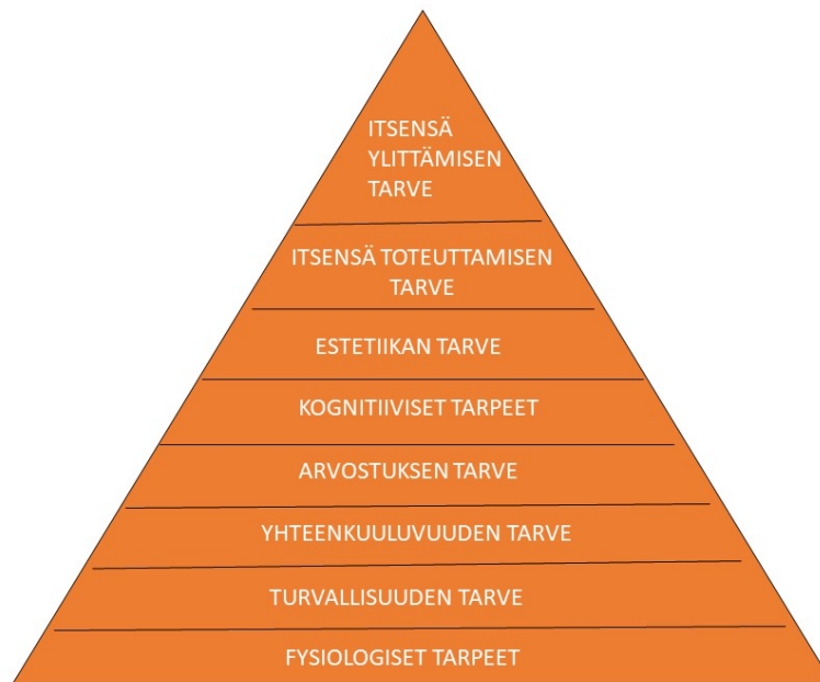
Kuva 4. Maslowin tarvehierarkia

Juuri näiden kolme kohdan kanssa tämä teoria soveltuu hyvin yhteisöllisten koulutuspäivien tapahtumasuunnittelun pohjaksi: kun näihin tarpeisiin vastataan, osallistuja kokee tapahtuman onnistuneeksi.