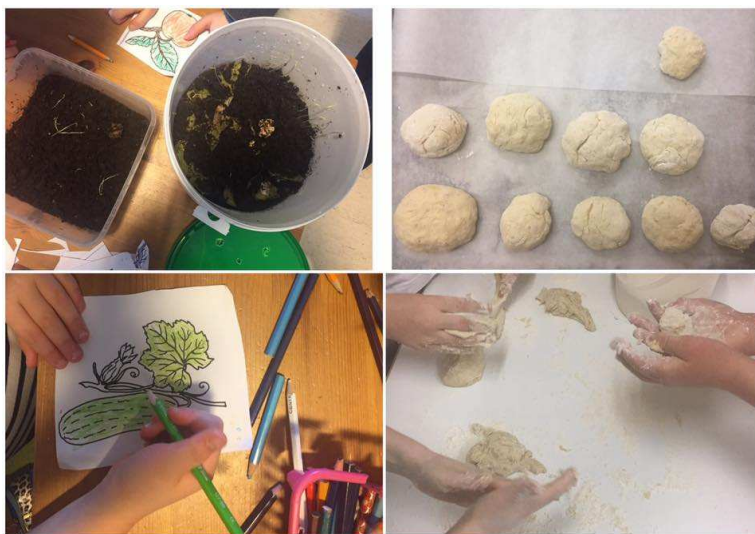
KUVA 1. Teematuokioiden tunnelmia

Neljännessä tuokiossa kokosimme aiempien tuokioiden teemat yhteen pelaten oppaassa liitteenä olevaa Kestävän kehityksen lautapeliä. Pelissä lapset pääsivät kertaamaan roskien lajittelua eri kierrätys- ja lajittelupisteisiin sekä tutustumaan muun muassa energian kulutuksen vähentämiseen. Tavoitteena oli antaa lapsille kokonaiskuva siitä, miten eri tavoin maapallon hyvinvointiin ja kestävyyteen voi vaikuttaa. Keskustelimme myös aiemmin jaetuista Kestävän kehityksen passeista. Tämän kautta saimme tietoa kestävästä kehityksestä lasten perheissä.