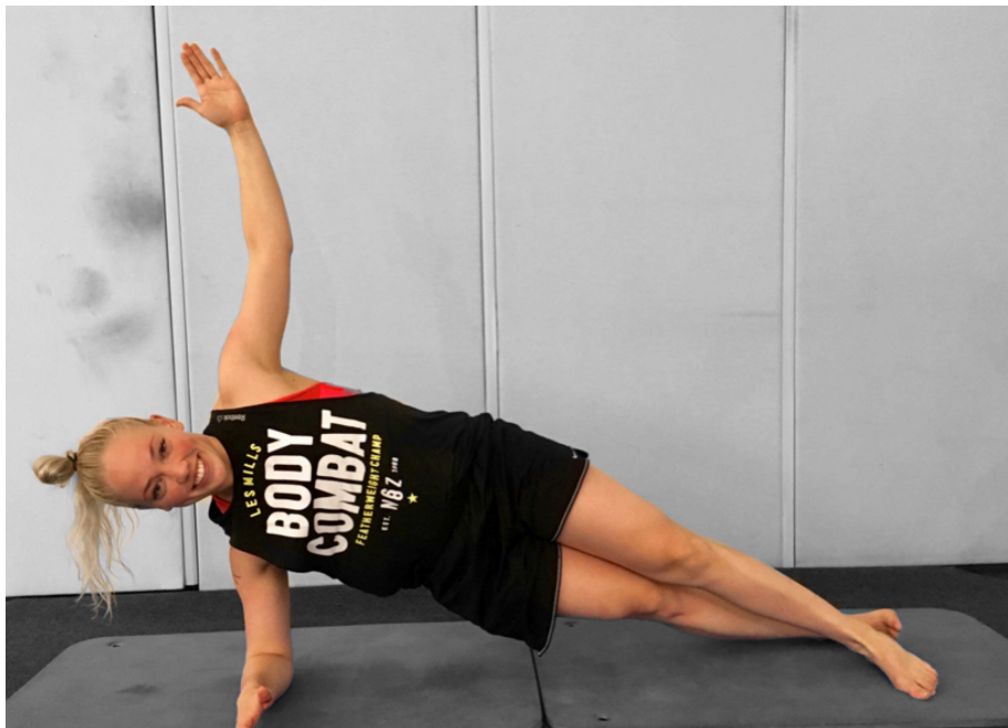
KUVA 10. Lankku, versio3

Tämän teorian pohjalta suunnittelimme kuuden (6) liikkeen liikekokonaisuuden kehittämään keskivartalossa tarvittavia ominaisuuksia. Esimerkkiliikkeenä tästä liikekokonaisuudesta on lankku, versio3, jossa harjoitetaan keskivartalon voimaa ja hallintaa staattisella pidolla (kuva 10). Sanalliset ohjeet liikkeen suorittamiseen sekä muut liikkeet löytyvät liitteestä 3.