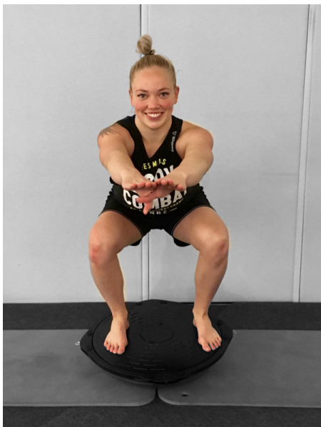
KUVA 13. Kyykky bosu-pallon päällä

Tämän taitojaon pohjalta laadimme harjoitteet tasapainon harjoittamiseksi sekä yhdellä että kahdella jalalla. Liikekokonaisuudessa harjoitteita tehdään sekä vakaalla että liikkuvalla alustalla. Esimerkki liikkuvalla alustalla ja kahdella jalalla tehtävistä harjoitteista on kyykky bosu-pallon päällä, jossa tasapainoharjoitukseen on yhdistetty koko kehon toiminnallinen liike (kuva 13). Esimerkki yhdellä jalalla tehtävistä harjoitteista on kello- taulu tasapainolaudalla, jossa yhdistyvät asennon säätely tavoitteellisen liikkeen aikana sekä asennon säätely liikkuvalla alustalla (kuva 14). Sanalliset ohjeet liikkeiden suorittamiseen ja loput liikkeet löytyvät liitteistä 6 ja 7.