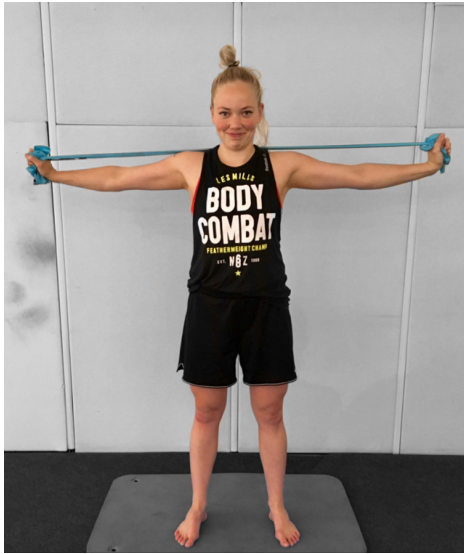
KUVA 11. Lapojen liikkuvuus ja hallinta kuminauhalla