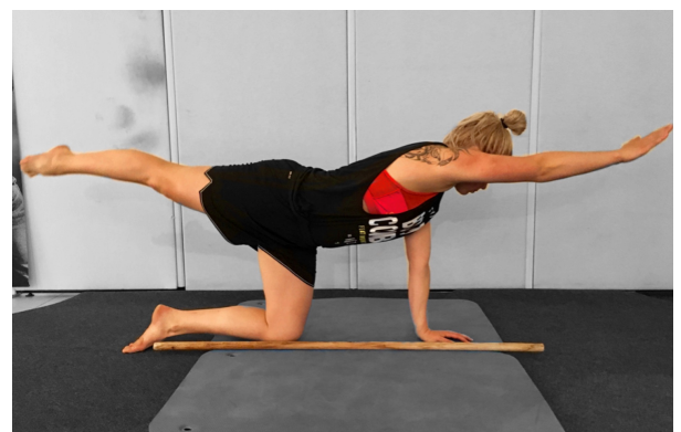
KUVA 7. Testiliike: Keskivartalon stabiliteetti (Kuva: Saija Tarvainen 2017)

Testattava asettuu konttausasentoon siten, että keppi jää rangansuuntaisesti käsien ja jalkojen väliin. Lonkka- ja olkanivelet ovat 90 asteen kulmassa suhteessa keskivartaloon ja nilkat neutraaliasennossa, kantapäät kohti kattoa. Testiliikkeessä testattava ojentaa saman puolen jalan ja käden suoraksi eteen (kuva 7) ja tuo sen jälkeen kyynärpäähän ja polven yhteen. Keskivartalon asento pysyy kepin linjassa, liikkumatta sivuttaissuunnassa liikkeen aikana. (Cook 2010, 102-103.)