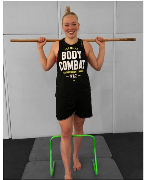
KUVA 2. Testiliike: Aita-askellus

Aidan korkeus määritellään asettamalla aita sääriluun kyhmy kohdalle. Testattava seisoo aidan takana varpaat suoraan aidan alapuolella. Keppi on niskan takana, hartioiden päällä. Testiliikkeessä testattava astuu toisella jalalla aidan yli ja koskettaa kantapäällä lattiaa pitäen selän suorana. (kuva 2) Jalka palautetaan alkuasentoon. Liike suoritetaan hitaasti ja kontrolloidusti ilman kontaktia aitaan. (Cook 2010, 92-93.)