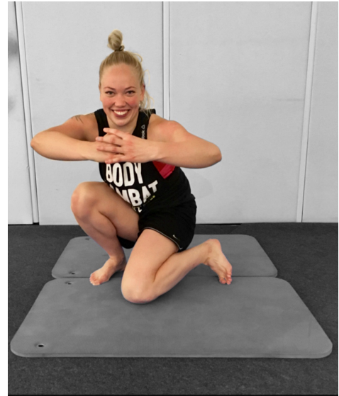
KUVA 12. Lonkan sisäkierto syväkykyssä