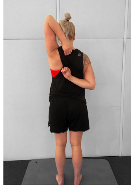
KUVA 4. Testiliike: Olkanivelen liikkuvuus (Kuva: Saija Tarvainen 2017)

Testiliikkeen alkuasennossa testattava seisoo yhdessä ja kädet nyrkissä peukalot kämmenten sisässä (kuva 4). Testattava kurottaa yhtä aikaa toista nyrkkiä yläkautta niskan takaa ja toista nyrkkiä alakautta selän takaa mahdollisimman lähelle toisiinsa. Liike on yksi sulava liike ja kädet pysyvät nyrkissä koko ajan. Nyrkkien väliin jäävä mitta kertoo testin tuloksen. (Cook 2010, 96-97.)