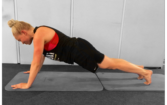
KUVA 6. Testiliike: Etunojapunnerrus

Testattava asettuu lattialle vatsamakuulle siten, että varpaat ovat lattiassa ja kantapäät kohti kattoa, nilkat neutraalissa asennossa ja polvet täysin suorina (kuva 6). Miehet asettavat kädet siten, että peukalot ovat otsan korkeudella ja naiset asettavat peukalot leuan korkeudelle, kämmenet alaspäin. Tästä alkuasennosta testattava punnertaa vartalon ylös. (Cook 2010, 100-101.)