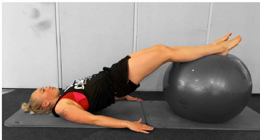
KUVA 9. Lantion nosto jumppapallolla

Monissa FMS:n testeissä alaraajan linjaus yhdessä lantion hallinnan kanssa ovat isossa roolissa liikkeen oikean suorituksen kannalta. Tämä huomioiden kokosimme kahdeksan (8) liikkeen kokonaisuuden polven ja lantion hallinnan harjoittamiseksi. Esimerkki liikkeestä on lantionnosto jumppapallolla, jossa lantio nostetaan ylös hallitusti alustasta. Jumppapallo tuo lisähaastetta lantion hallintaan liikkeen aikana. (kuva 9). Sanalliset ohjeet liikkeen suorittamiseen sekä muut liikkeet löytyvät liitteestä 2.