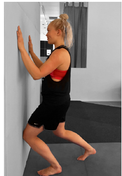
KUVA 8. Akillesjänteen ja pohkeen venytys

Nämä ylempään ja alemman nilkkanivelen ominaisuudet huomioon ottaen, suunnittelimme kahdeksan (8) liikkuvuutta ja hallintaa kehittävää harjoitetta. Eri liikesuuntien lisäksi harjoitukset koostuvat sekä yksinkertaisista että haastavammista toiminnallisista, koko kehon liikkeistä. Esimerkki liikkeenä (kuva 8) akillesjänteen ja pohkeen dynaaminen venytys seinää vasten jolla pyritään lisäämään liikkuvuutta ylempään nilkkaniveleen koukistus suuntaan. Sanalliset ohjeet liikkeen suorittamiseen ja loput liikkeet löytyvät liitteestä 1.