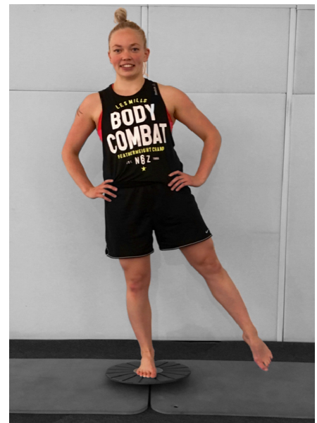
KUVA 14. Kellotaulu tasapainolaudalla