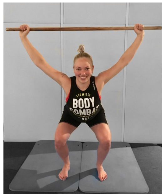
KUVA 1. Testiliike: Tempausvala

Tempausvalassa (kuva 1) alkuasentona on hieman hartioita leveämpi haara-asento ja alaraajat ovat linjattuina suoraan eteenpäin ilman ulkokiertoa. Testattava ottaa kepeistä kiinni siten, että käsien väliin jää 90 astetta. Keppi nostetaan pään yläpuolelle kyynärpäät täysin ojennettuina. Suorituksessa testattava menee hitaasti niin syvälle kyykkyyn kuin pääsee (vähintään 90 astetta) pitäen samalla kepin pään yläpuolella. Kantapäiden tulee pysyä lattiassa sekä rintamasuunnan eteenpäin. Polvet ovat linjattuna eteenpäin ilman sisäänpäin kääntymistä. (Cook 2010, 90-91.)