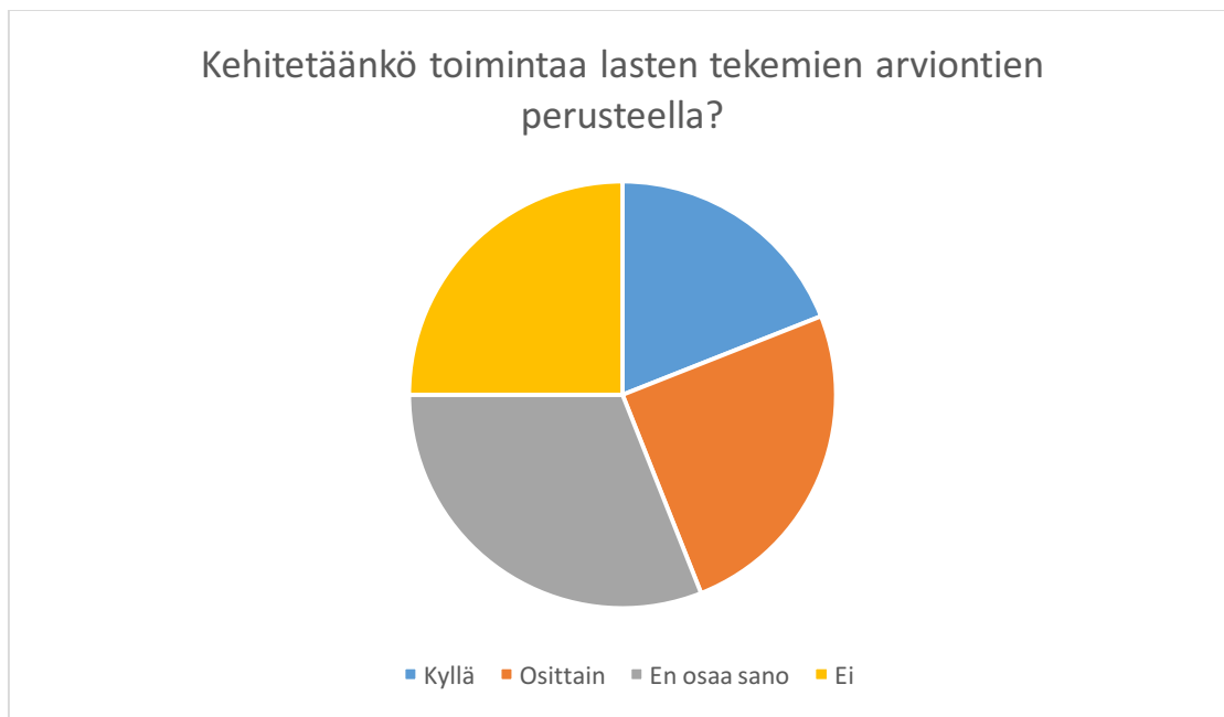
Kuva 3. Toiminnan kehittäminen lasten arviointien perusteella.

Suurin osa (31 %) vastasi, että toimintaa ei kehitetä lasten tekemien arviointien perusteella. Lastentarhanopettajista 25 % vastasi, että toimintaa kehitetään osittain. Perustelujen mukaan aihealueita usein syvennettiin ja lasten palautteet sisälsivät usein ehdotuksia seuraavalle toimintakerralle, joita pyrittiin toteuttamaan. Noin viidesosa (19 %) vastasi, että toimintaa kehitetään lasten arvioinnin perusteella. Esimerkiksi toimintaa muokattiin, jos se osoittautui sellaiseksi, ettei lasten mielenkiinto riittänyt siihen. Jos lapset vastasivat, ettei toiminta ollut mukavaa, sitä ei järjestetty juuri samanlaisena uudestaan. Eräs lastentarhanopettaja kuitenkin vastasi, että myös hankalia tai epämieluisia toimintoja käydään läpi uudestaan, jotta lapset oppisivat pettymyksensietoa. Samalla lapset huomaavat, että epämieluisia ja vaikeitakin asioita opitaan, kun tehdään uudestaan. Neljäsosa (25 %) vastaajista ei osannut sanoa kehitetäänkö toimintaa lasten arvioinnin perusteella .