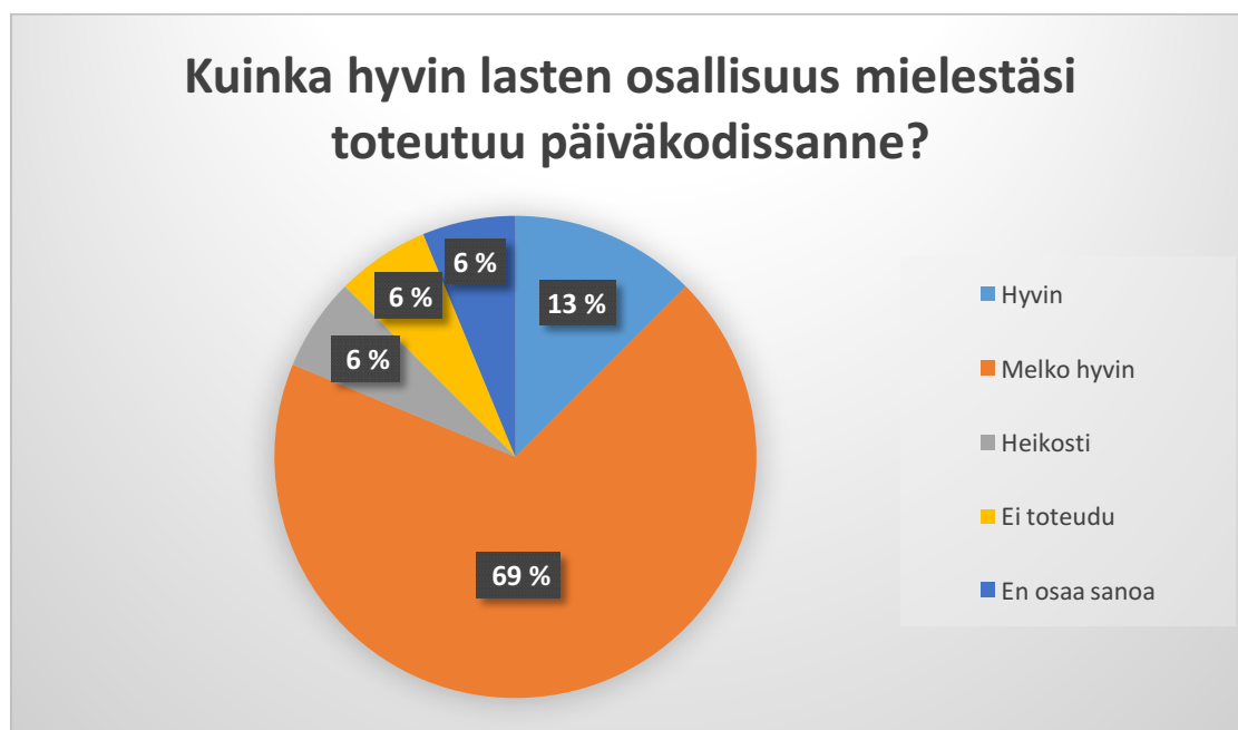
Kuva 1. Vastausten jakautuminen prosentteina.

Kolmannessa kysymyksessä kysyimme ”kuinka hyvin lasten osallisuus mielestäsi toteutuu päiväkodissanne?”. Vastaukset jakautuivat Kuvan 1 mukaisesti.