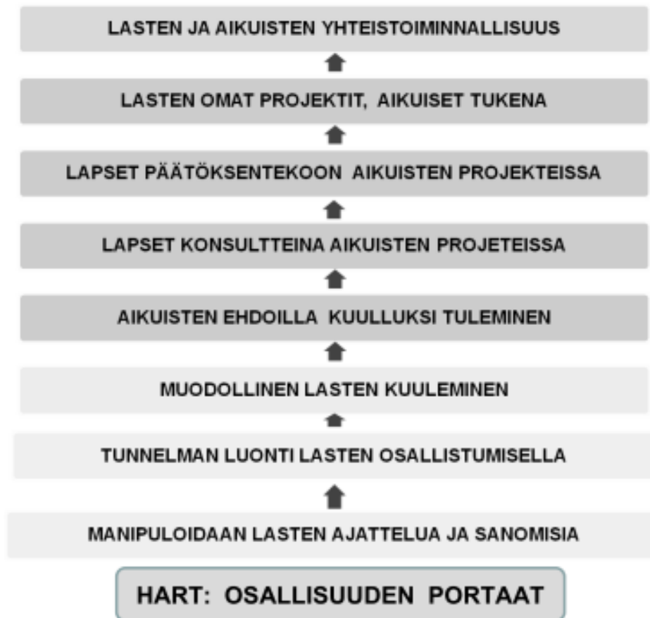
Kuvio 1. Lasten osallisuuden portaatt Hartin (1992) mukaan.

Osallisuuden toteutumiseen liittyy vahvasti aikuisen ja lapsen valtasuhde. Lapsen osallisuus on riippuvainen siitä, kuinka paljon vaihtoehtoja ja tietoja hän saa omaa elämäänsä koskettavista asioista. Se missä määrin lapsi tietoa saa, vaikuttaa lapsen valtaistumiseen, joka on yksi tekijä osallisuuden toteutumisessa. Kuvion 1 alimmat portaatt eivät ole osa osallisuutta vaan niissä aikuinen on päättänyt ja manipuloinut lasta haluamaansa suuntaan. Varsinaisilla osallisuuden alimmilla portailla lapsi voi vaikuttaa asioihin, mutta aikuinen päättää minkälaisiin ja missä tilanteissa hän tähän pystyy. Ylimmillä portailla lapset voivat suunnitella omia projekteja ja tehdä aloitteita aikuisen kanssa. Osallisuuden ylin porrast ja tavoitte on yhteistoiminnallisuus ja dialogisuus lapsen ja aikuisen välillä. (Turja 2010, 26–28.) Valtaistumisen käsitteen lisäksi osallisuuden toteutumiseen vaikuttaa vaikuttamisen kokemus; pystyykö lapsi vaikuttamaan yksilöllisesti tai ryhmän laajuisesti, ajalli-