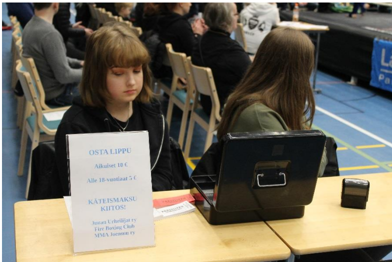
Kuva 12 Lipunmyynti