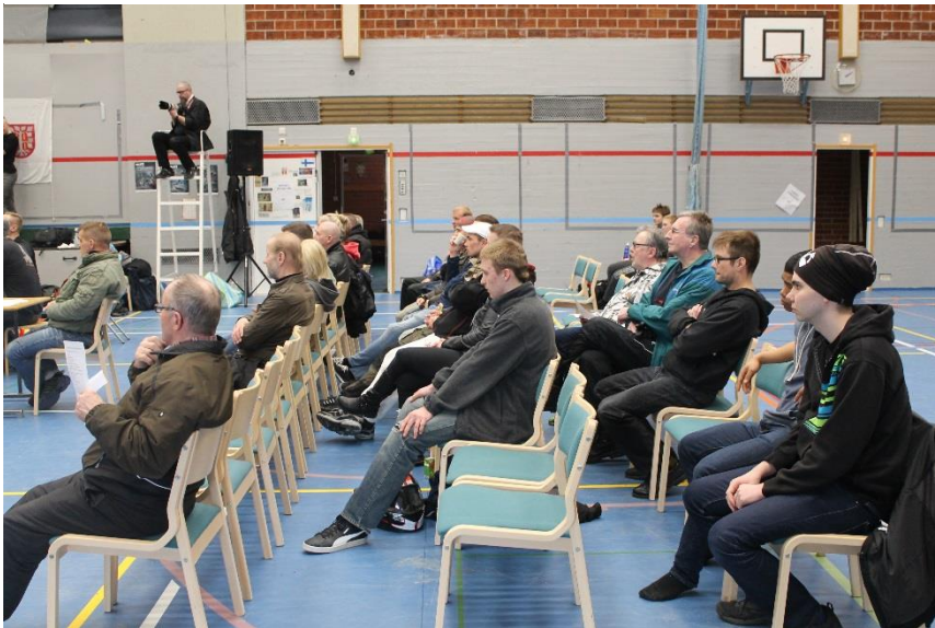
Kuva 11 Yleisöä