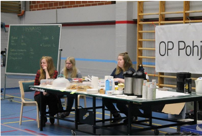
Kuva 13 Kahviotyöntekijät