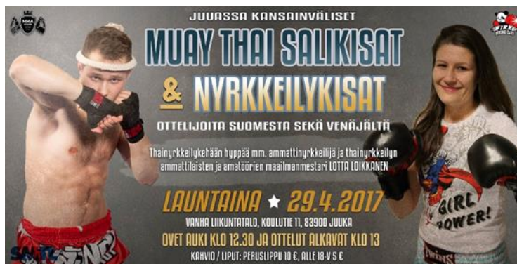
Kuva 1 Tapahtumajuliste

Saimme myös tehtyä kaksi lehti-ilmoitusta (kuva 2 ja kuva 3) paikalliseen lehteen ennen kilpailuja (Vaarojen Sanomat). Toinen oli ilmainen ja toisen sponsoroi Jarmo Tolvanen. Myös Karjalaiseen saimme yhden lehti-ilmoituksen, jonka takia saimme paljon myös katsojia Joensuusta. Tuure teki myös tapahtumajulisteita (kuva 1), joita kävin ripustamassa Juuan eri kauppoihin ja ilmoitustauluille.