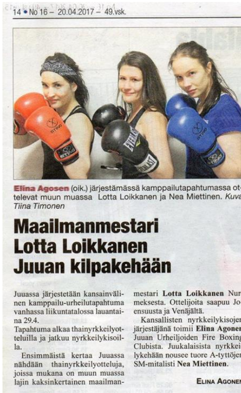
Kuva 2 Lehtijuttu ennen tapahtumaa 20.4.2017