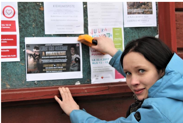
Kuva 5 Tapahtumajulisteiden ripustaminen