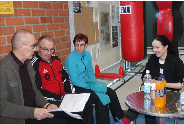
Kuva 3 JuuU:n johtokunnan palaveri