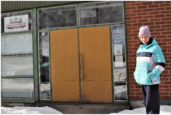
Kuva 1. Tapahtumapaikka