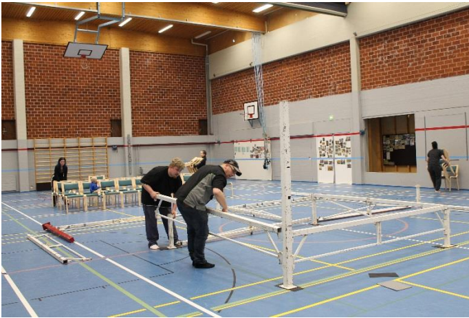
Kuva 6 Kehän pystytys