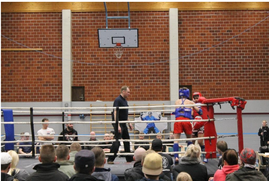
Kuva 15 Thainyrkkeilyottelu