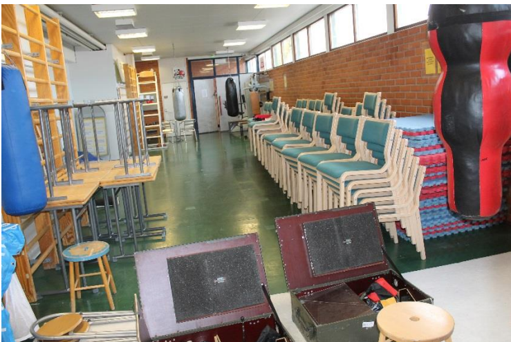
Kuva 5 Talkoot