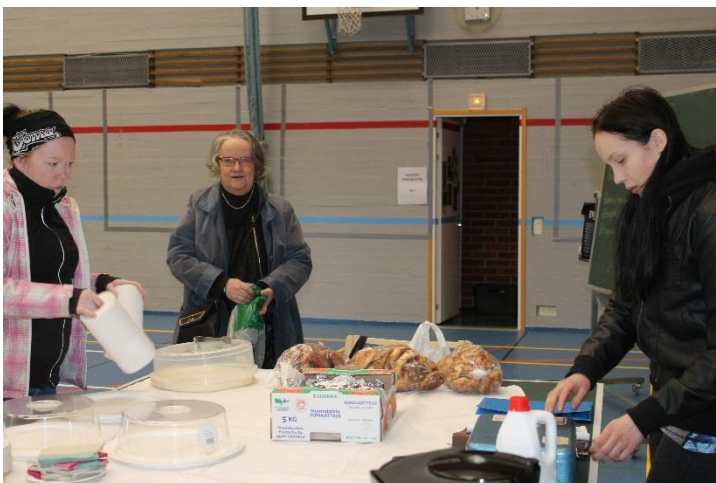
Kuva 12 Kahvio