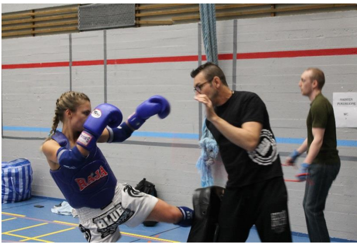
Kuva 14 Lämmittelyä