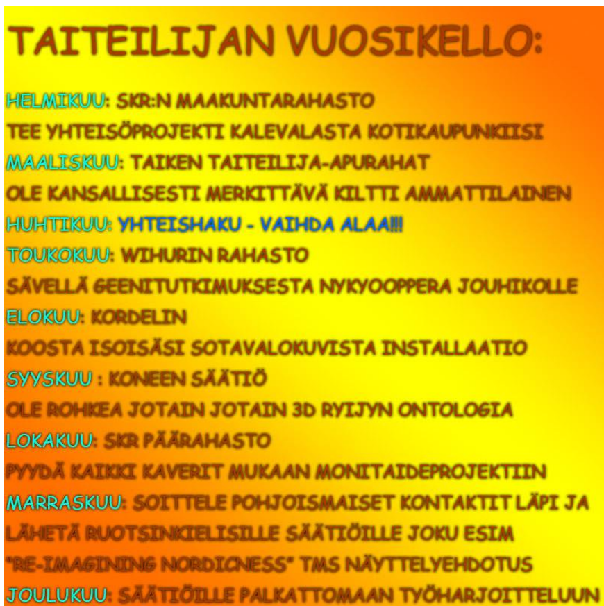
Kuva 3. Taiteilijan vuosikello. 28

Taiteen taloudellinen puoli on vähintäänkin haasteellinen. Voikin sanoa, että taiteen tärkein hyöty on aineetonta. Teemu Mäki jakaa taiteen immateriaaliset hyödyt neljään kategoriaan: nautintoon, keskusteluun, filosofiaan sekä tunne-elämän kehittymiseen, joita käsittelen seuraavissa kappaleissa.