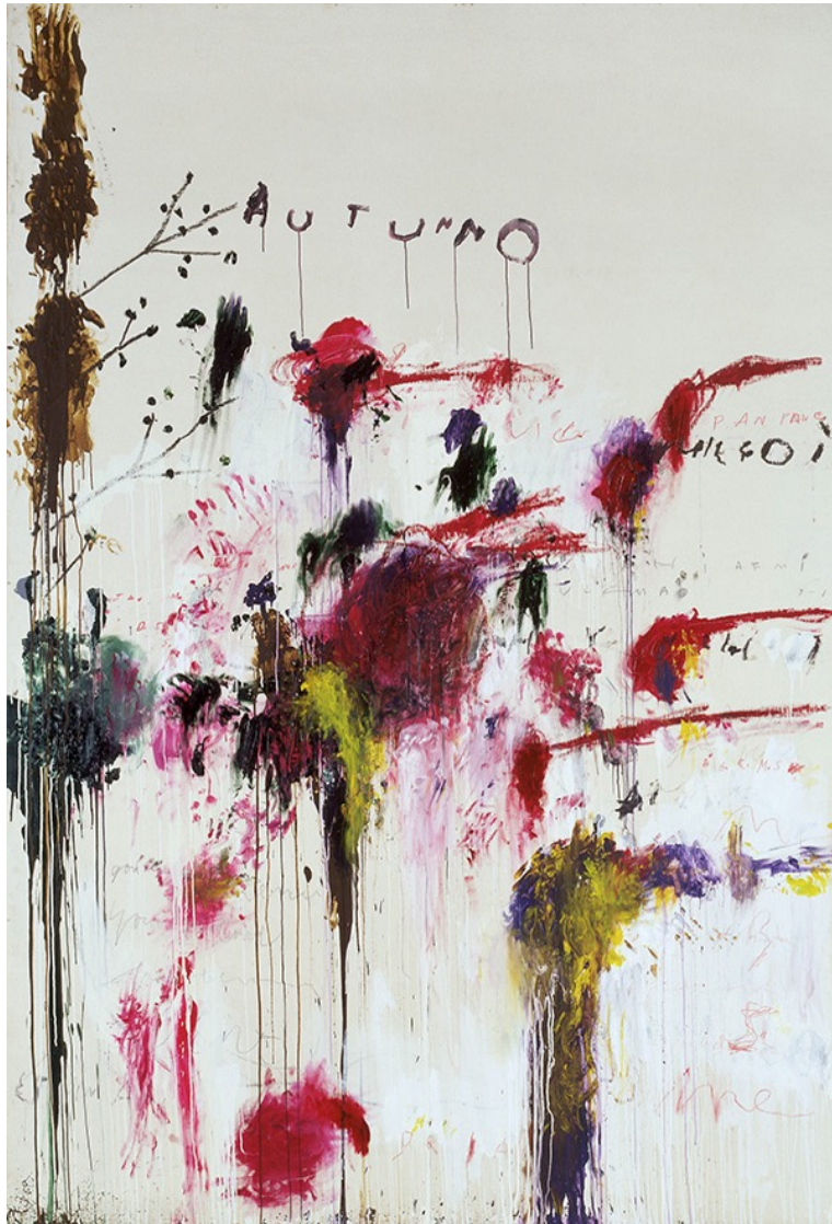
Kuva 5. Cy Twombly: Quattro Stagioni: Autunno , maalaus, 1995. 58

Olen viime aikoina ollut kiinnostunut kirjoittamisen yhdistämisestä kuvataiteeseen. Cy Twomblyn (1928–2011) maalauksissa se tapahtuu kiinnostavalla tavalla. Aluksi en ymmärtänyt kuin intuitiivisesti mistä tässä teoksessa voisi olla kyse. "Autunno" kuulostaa sanalta "autumn". Ja nopea googletus paljasti teosnimenkin viittaavan aivan johonkin muuhun kuin pitsaan.