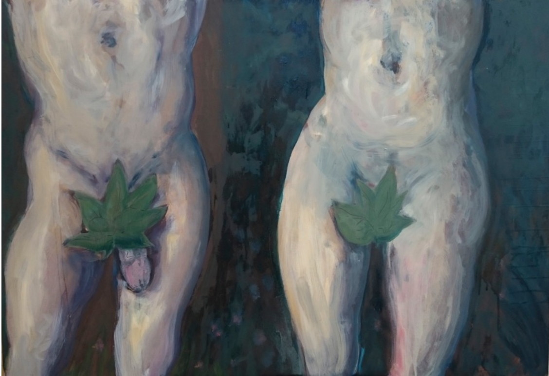
Kuva 6. Aatami ja Eeva , öljyväri mdf-levylle, 70 x 104 cm, 2016. Osa taiteellista opinnäytetyötäni. Maalaus kertoo miehen ja naisen seksuaalisesta ilmaisunvapaudesta, tasa-arvosta - tai sen puutteista ja seksiin liittyvästä häpeästä, mutta jonkinlaisella huumorilla.