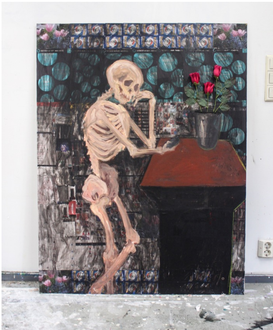
Kuva 1. Tylsistynyt kuoliaaksi , kollaasi, akryylinväri ja muovikukat mdf-levylle, 135 x 103,5 cm, 2017. Osa taiteellista opinnäytetyötäni. Nykyajan memento mori eli muista kuolevaisuutesi -maalaus.

Konteksti on avainasemassa siinä, miten teos näyttäytyy tai mitä tunteita ja ajatuksia se herättää. Siitä syystä esimerkiksi galleriat ovatkin usein neutraaleja valkoisia laatikoita, riidattomia tiloja taidetta varten. Kuitenkin tietoinen ja taitava kontekstilla pelaaminen esimerkiksi sijaintipaikalla tai viittauksilla taidehistoriaan tai populäärikulttuuriin avaa kuvataiteeseen valtavan määrän mahdollisuuksia erilaisten asioiden paljastamiseen tai käsittelemiseen. Katsojana oman näkökulman voi yrittää kyseenalaistaa.