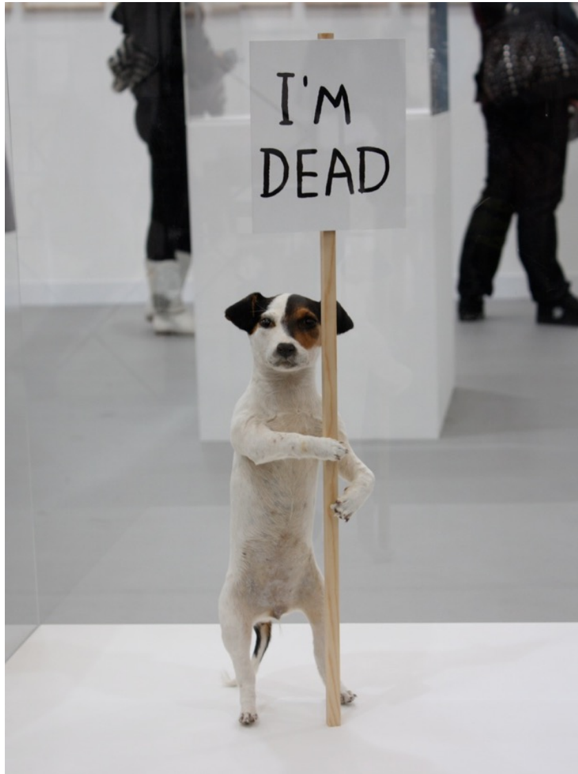
Kuva 4. David Shrigley: I'm Dead (Puppy) , installaatio, 2009. 53