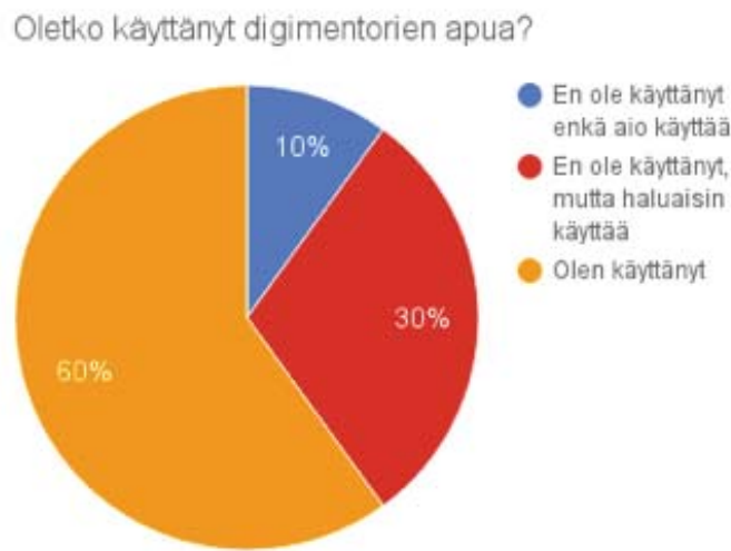
Kuvaaja 1: Digimentoreiden palvelun hyödyntäminen.

Palvelun hyödyllisyyttä arvioitiin asteikolla 1-5. Aineiston perusteella vaihteluväli hyödyllisyyden osalta oli 2-5. Palvelun hyödyllisyyden saama aineistokeskiarvo oli 3,9, jota voidaan pitää kohtuullisen hyvänä. Kyselyaineiston kattavamman analyysin perusteella myös tähän osa-alueeseen saataneen hyödyllistä kehittämissyötettä.