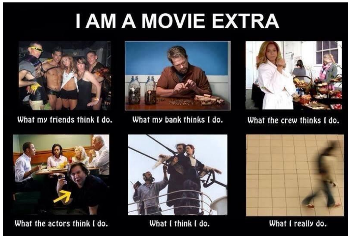
KUVA 3. Elokuva-avustaminen: odotukset vs. todellisuus