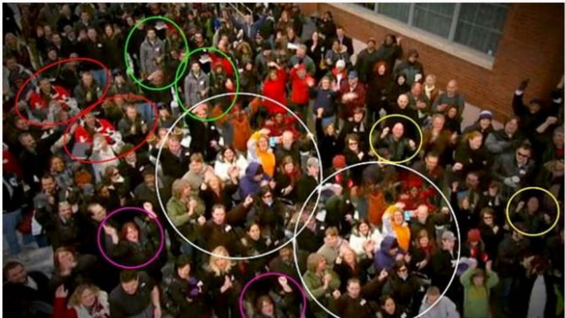
KUVA 5. Duplikoitu yleisö Gordon Ramsayn MasterChef -ohjelmassa.

Mallinukkejen käytön lisäksi teknologian kehityttyä suurten joukkokohtausten toteutuksessa alettiin käyttämään myös duplikointia, joka tarkoittaa kahdentamista. Duplikoidessa kuvan ihmiset kopioidaan useampaan kohtaan samaa kuvaa. Esimerkiksi Daily Telegraphin (2011) uutisoinnin mukaan Gordon Ramsayn MasterChef -ohjelman Los Angelesissa järjestettyyn koe-esiintymistilaisuuteen saapui niin vähän ihmisiä, että tilaisuudesta julkaistuissa kuvissa ihmismäärää oli lisätty kopioimalla paikallaolijoita useampaan kohtaan kuvia. (Daily Mail, 2011).