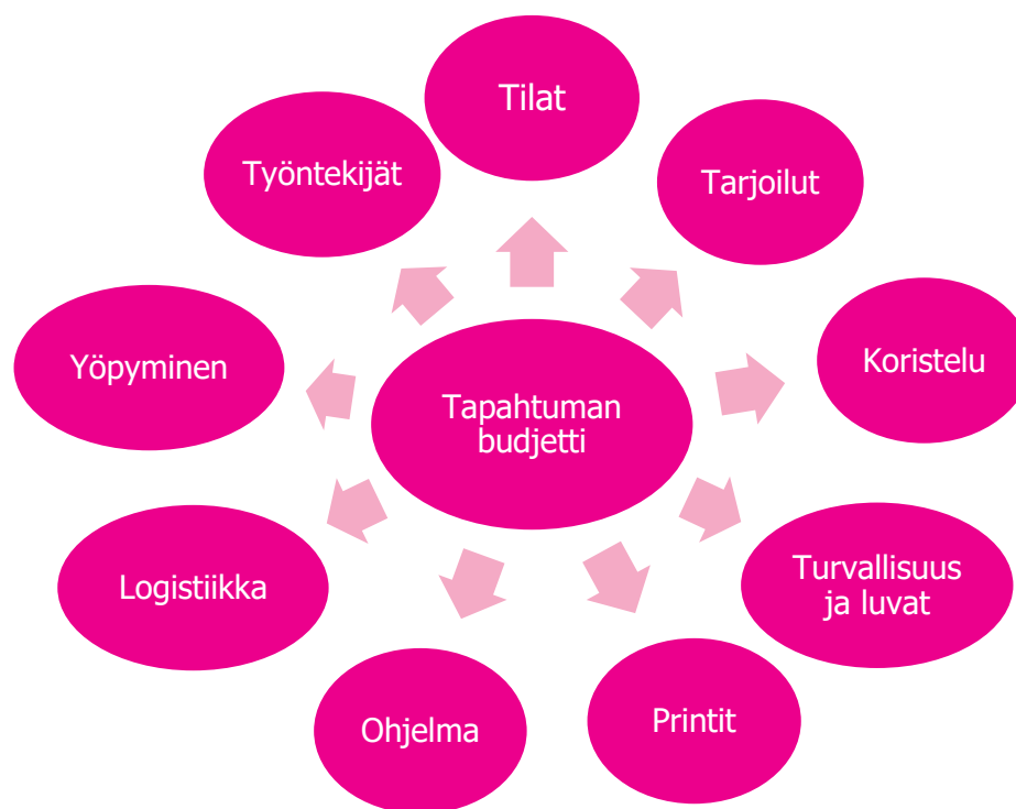
KUVA 2. Budjetin muodostuminen.