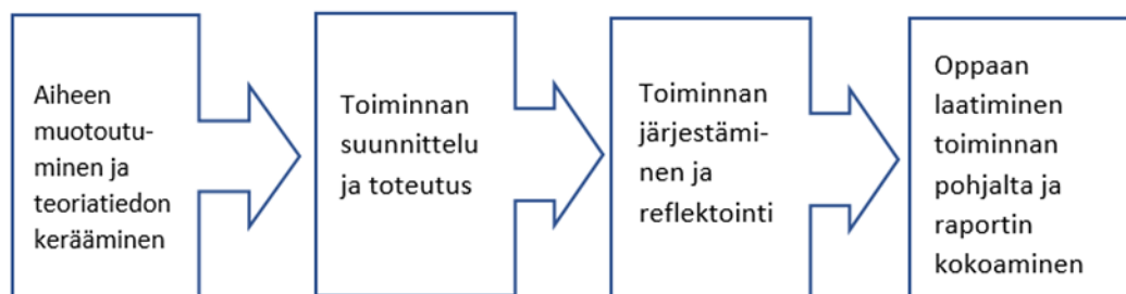
Kuvio 2: Opinnäytetyön prosessikaavio

nämä vaiheet kulkivat kuitenkin rinnakkain, eikä yhden vaiheen työstäminen loppunut, kun seuraava alkoi. Esimerkiksi teoriatieto laajeni työn mukana paljonkin, sillä sain ideoita sen sisältöön koko ajan projektin edetessä. Alkuun määrittelemäni teoriasisältö sai monta uutta näkökulmaa Tenava-Linnan työntekijöiltä sekä itse retkellä oivallettujen asioiden tiimoilta.