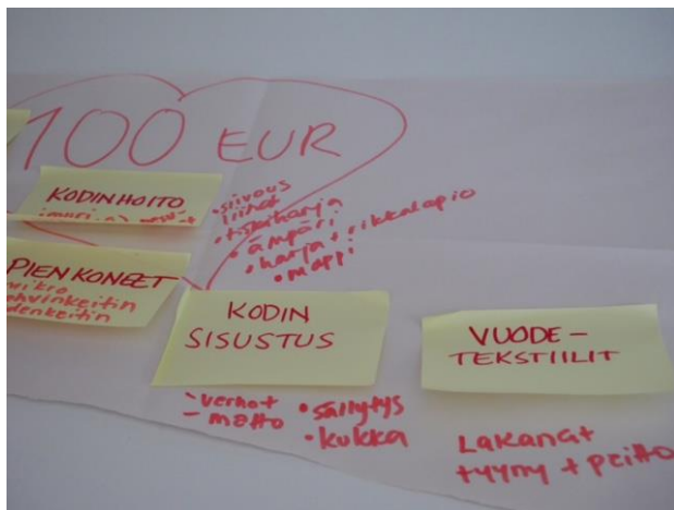
Kuva 1: Kotiin ja asumiseen liittyviä asioita

Päivän päätteeksi annoimme osallistujille ”sellitehtäväksi” valita ja kirjata ylös kotiin ja kodinhoitoon liittyviä tavaroita, joita he hankkisivat kotiin jos nyt saisivat 100 euroa. Yhdessä kävimme läpi, mitä kotiin ja asumiseen liittyvät tavarat ja esineet voivat olla.