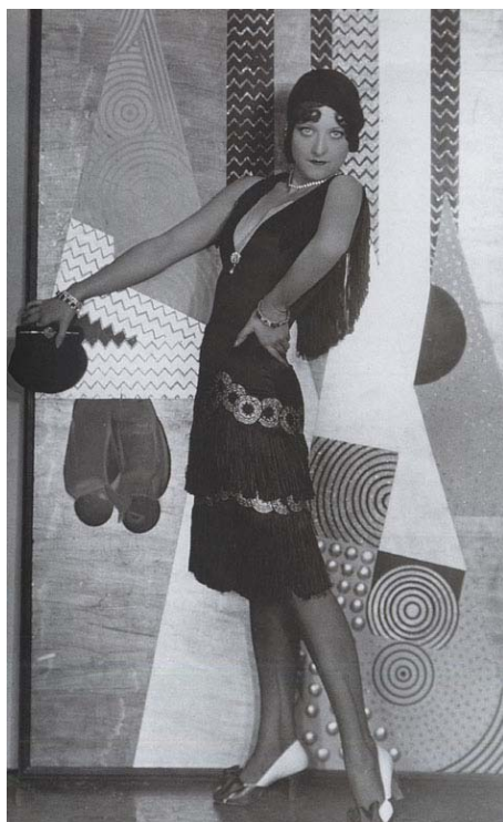
Kuva 3. Charleston-leninki

Mekot olivat nuorekkaita, elegantteja, naisellisia ja vartalon väljästi ympäröiviä. Leninkien vyötärölinja siirtyi vyötäröltä lanteille ja loi lähtökohdat vapaasti liehuvalle, epätasaiselle tai kellomaiselle hameen helmalle, joka ulottui polveen. Iltapuku oli yleensä yksiosainen, toisin kuin päiväpuku, kapea ja kuosiltaan suora. (Lehnert 2000, 25.)