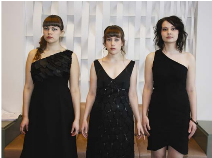
Kuva 14. Kaikki yhdessä (Liite 8/4)

Torakka-mekkoon tein voimakkaan ilmeen, koska mekko oli siluutiltaan ja kuvioltaan raju. Mallin hiukset kiharrettiin, jotta hiuksista oli saatu tuuheat ja pöyheät, hieman epäsiistinnäköiset ja seksikkäät. Silmämeikistä tuli mahdollisimman tumma ja huulet saivat luonnollisenvärisen punan. Jalassaan mallilla olivat mustat stilettoavokkaat. Koruja yhdistin mekkoon niukasti, käsikoru ja sormus riittivät, vaikka mekkoon olisi voinut yhdistää enemmänkin koruja. (Liite 7/1) Käärme-mekon jätin kokonaan ilman koruja, koska mekon kuviointi vei huomion. Mallin hiukset laitoin kiinni sivulle ja kiharsin auki jääneitä hiuksia. Meikissä keskityin silmiin, tein 60-lukulaiset paksut rajaukset yläluomille ja huulia korostin luonnollisen värisellä huulikiillolla, kengät olivat mustat stilettoavokkaat. (Liite 7/2) Käpy-mekkoon en yhdistänyt kauheasti koruja, jottei kimalletta ja katsottavaa olisi ollut liikaa ja kokonaisuus näyttänyt sekavalta, niinpä koruiksi valittiin mustat pienet korvakorut. Mallin pitkät hiukset kiharrettiin ja laitettiin suurelle nutturalle niskaan, silmämeikiksi tuli kevyt ja huulet punattiin tummaksi. Jalkaansa malli laittoi kiiltonahkaiset remmiavokkaat. (Liite 7/3)