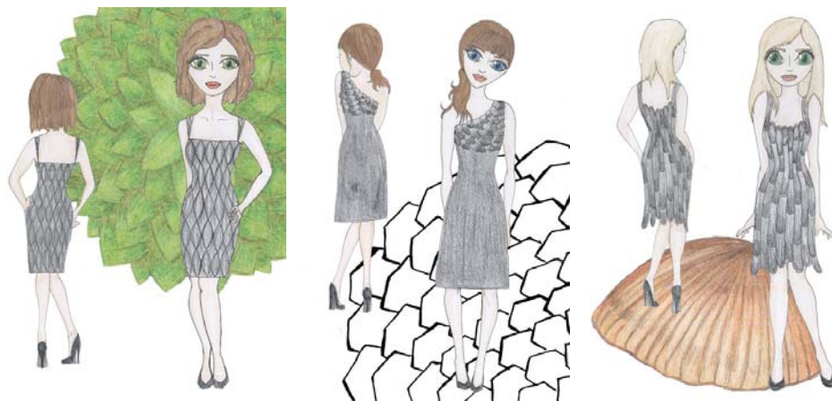
Kuva 10. Esityskuvia mekoista (Liitteet 4/7, 4/2 ja 4/5)

Valmistettavaksi valitsin käpy-mekon, käärme-mekon ja torakka-mekon. Nuo kolme mekkoa valitsin, koska ne olivat malleiltaan toisistaan poikkeavia ja jokainen mekko toisi oman haasteensa niin kaavoitukseen kuin ompelemiseenkin. Valmistin puvut koissa 34, 36 ja 40, koska ne vastasivat aiemmin päätettyjen mallien mittoja. Valmistettujen mekkojen valintaan vaikutti myös materiaali, vanhat vaatteet, joita oli rajoitusti.