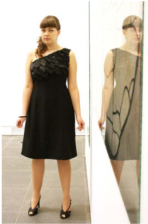
Kuva 12. Käärme-mekko (Liite 8/2)

Suomujen asettelu kankaalle vaati paljon työtä, sillä täytyi miettiä, kuinka saan kuvion näyttämään kauniilta ja yhtenäiseltä ja kuinka palaset asettuvat miehustakankaaseen, ilman, että ne nousevat pystyyn. Ompelin suomut miehustakankaaseen limittäin, jolloin toinen suomu peittää kiinnitysompeleen ja pinnasta tulee kauniin yhtenäinen. Lisäksi kiinnitin suomujen kulmat parilla käsiompeleella toisiinsa, näin estin suomujen nousemisen pystyyn ja ompeleiden näkymisen suomujen alta. Suomujen asettelussa meni paljon aikaa, koska niitä oli vaikea saada asettumaan kankaalle kauniisti. Välillä muodostunut pinta näytti levottomalta tai liian täyteen ahdetulta. Saavuttaakseni täydellisen ja tasapainoisen pinnan, asettelin suomut kankaalle neljästi ennen kuin lopputulos oli tyydyttävä.