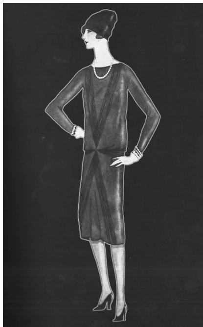
Kuva 2. Chanelin suunnittelema pikkumusta

leissa käyn läpi 1900-luvun vuosikymmenet. Koska, pikkumusta mekko on elänyt läpi vuosikymmenten, ollen esillä enemmän tai vähemmän, on se muuttanut muotoaan kunkin aikakauden tyylin mukaiseksi.