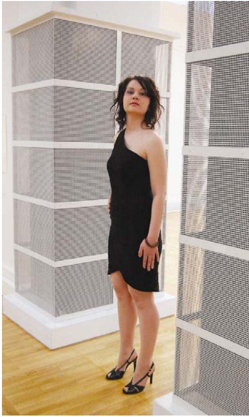
Kuva 11. Torakka-mekko (Liite 8/1)

Käytin mekkoon kolme kirpputorilta löytämäni hametta. (Liite 5/1) Hameet olivat joustoltaan ja materiaalin tunnultaan lähes samat, joten ne sopivan hyvin yhteen. Hameiden värit poikkesivat hieman toisistaan, vaikka kaikki olivatkin mustia, olivat ne sävyiltään erilaisia. Koska, mekko koostui yhteensä 48 päällekkäisestä/rinnakkaisesta osasta, täytyi kaavat asetella kankaille siten, ettei mekkoon tullut kohtia, joissa kaksi vierekkäistä palasta olisivat olleet samaa kangasta. Lisäksi halusin säilyttää idean säännönmukaisesta raidallisuudesta, joka muodostui kankaiden erisävyisyydestä. (Liite 6/1)