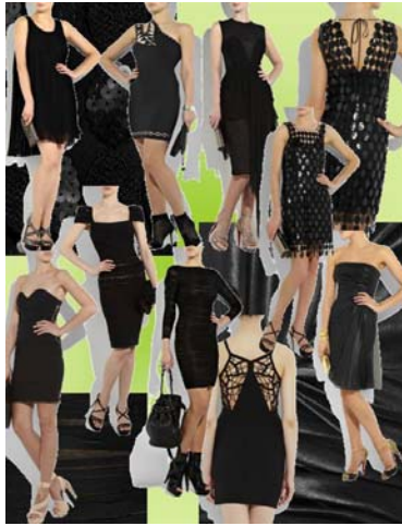
Kuva 8. Kuvakollaasi tämän hetken pikkumustista mekoista (Liite 1.)

Mekkojen siluetti, materiaalit ja yksityiskohdat vaihtelivat hurjasti, osa oli seksikkäitä, toiset kiltimpiä, hihallisia tai hihattomia, läpikuultavia, matta- tai kiiltäväpintaisia, vyötäröä korostavia tai säkkimäisiä. Jokaiselle jotakin ilman, että poikkeaa massasta tai kunakin aikana vallitsevasta trendistä.