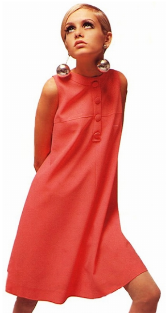
Kuva 6. Twiggy 1960-luvun mekossa

tivat minihameet ja läpinäkyvät vaatteet. Siluetti oli solakka ja tyttömäinen, sellainen kuin Twiggy, joka oli 60-luvun tyyli-ikoni. (Kuva 6.)(Lehnert 2000, 56.)