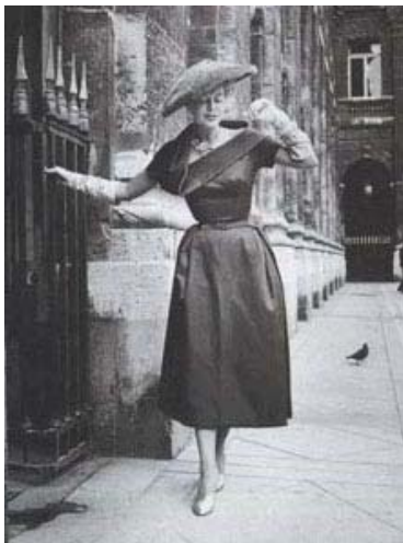
Kuva 5. Yksi Diorin suunnittelemissa cocktailpuvuista

Kaksi vastakohtaista siluettaa vallitsi 1950-luvulla. Vaihtoehtoina olivat hulmuava kellohame ja kapealinjainen polvipituinen kynähame, jotka molemmat korostivat kapeaa vyötäröä. Sotavuosien ankeuden jälkeen naiset korostivat naisellisuuttaan, vartalon puutteita ja virheitä korjailtiin toppauksilla ja vartaloa muokkaavilla alusvaatteilla. Täydellinen tiimalasivartalo syntyi nailonista valmistetun korseletin avulla, joka nosti rintoja ulos- ja ylöspäin, kavensi lantiota ja teki vyötäristä ampiaismaisen. Muoti saneli jäykät ja epämukavat pukeutumissäännöt. Hyvin pukeutuvan naisen piti käyttää hattua ja käsineitä ollessaan ulkona ja asusteiden täytyi olla samanvärisiä, esimerkiksi huulipunaa piti sointua korkokenkien väriin. Naiset halusivat näyttää viehättäviltä ja hienostuneilta. (Rhodes 2006, 86–87.)