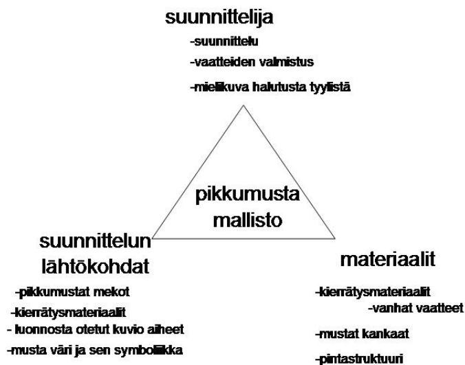
Kuva 1. Viitekehys

Viitekehystä (Kuva 1.) tehdessäni mietin, mitkä asiat tekevät mallistostani uudenlaisen ja mielenkiintoisen. Viitekehysten keskellä on työni lopputulos, suunnittelemani pikkumusta-mallisto.