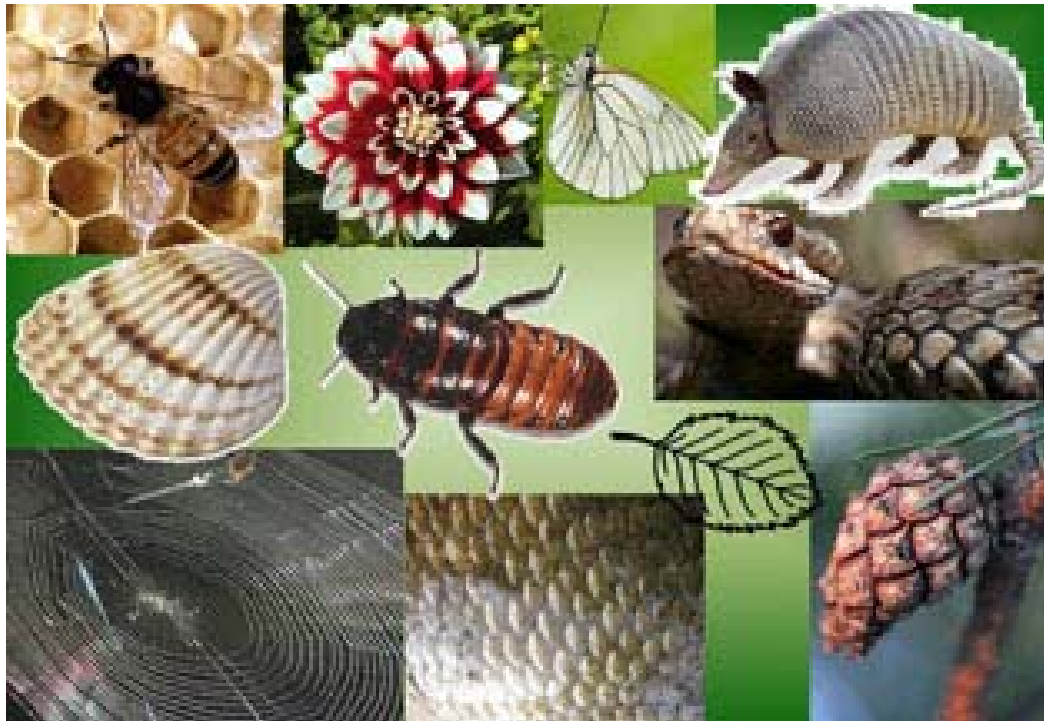
Kuva 9. Mood board

Mood board (Kuva 9.) tukenani lähdin suunnittelemaan mekkoja, joihin jokaiseen tuli yksi yksittäinen kuvio, joko koko mekon peittävänä pintana tai pienenä, mutta erottavana ja näyttävänä yksityiskohtana. Annoin jokaiselle mekolle nimen sen kuvioinnin mukaan, kuten torakka, seitti, käärme ja simpukka, jotta mustien mekkojen erottaminen toisistaan kävisi helpommin.