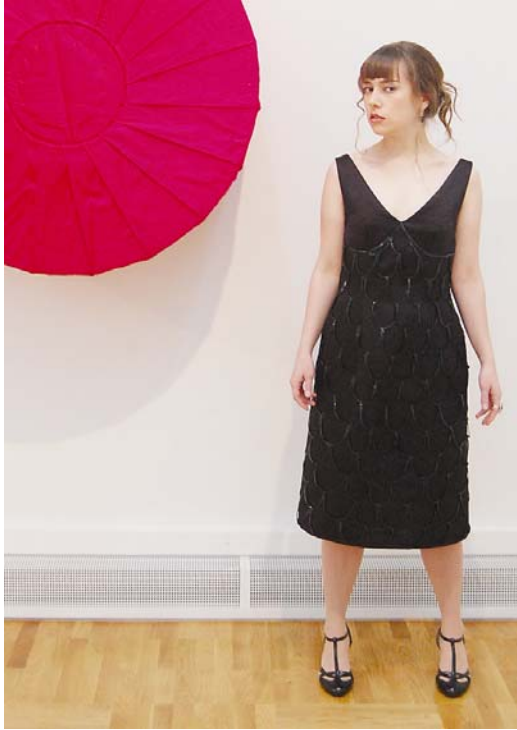
Kuva 13. Käpy-mekko (Liite 8/3)

ta paljettinauhaa, joka kimaltelee kauniisti valon osuessa siihen. Paljettinauha sopii pohjakankaan kanssa hyvin yhteen, koska miehusta kangas ei ole kiilloltaan suuri. (Liite 6/3)