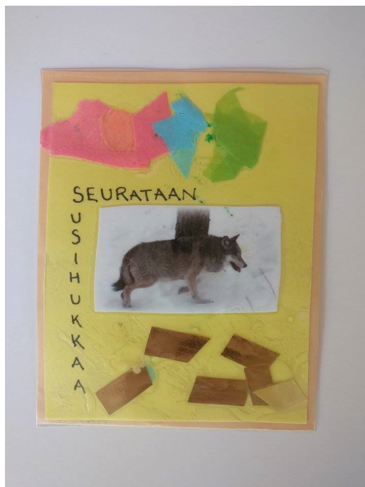
Kuva 2. Liikuntaleikit -kortti

Yhdessä kortissa oli erilaisia matkimis- ja seuraamisleikkejä (kuva 2.), kuten seuraa johtajaa, mutta eläinteemasta johtuen se sai uuden nimen ”Seuraa Susihukkaa”. Sitten liikuntaleikkikortteista löytyi erilaisia pallopelejä. Yksi esimerkeistä oli ”paperipallosota”. Siinä ryhmässä voidaan tehdä pallot joko itse sanomalehdistä tai käyttää oikeita palloja. Kasvattajat ovat toiminnassa mukana ja lapset jaetaan kahteen joukkueeseen. Sen jälkeen istutaan lattialle, joukkueet toisiaan vastakkain ja jaetaan pallot tasan kummankin joukkueen kesken. Sen jälkeen lapset saavat aloittaa pallojen viertämisen toiselle puolelle huonetta. Pelissä ei tarvitse selvittää voittajaa, vaan pitää hauskaa.