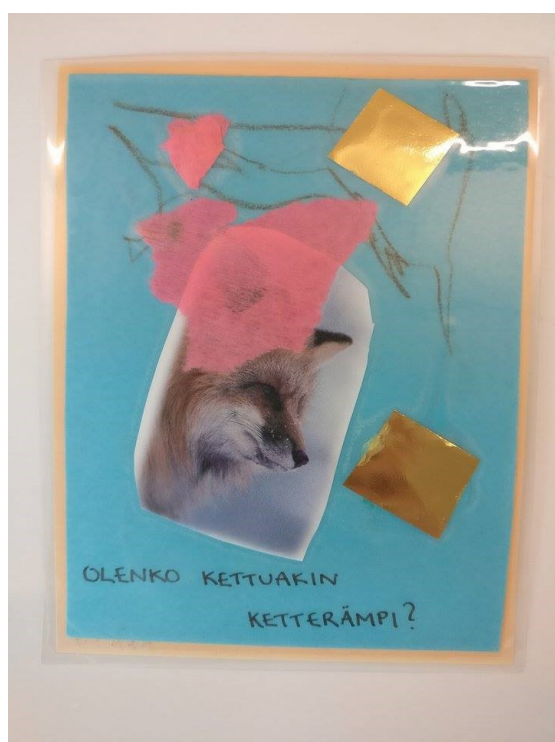
Kuva 1. Motoriset harjoitukset -kortti

Löytyy myös kortti, jonka sisältönä on ketteryyden harjoittelua (kuva 1.), kuten penkillä konttaamista, pöydän ali ryömimistä ja erilaisten esteiden yli kulkemista. Näin pystytään käyttämään montaa motoriikan osa-aluetta, jolloin syntyy monipuolista harjoittelua. Hyppäämiselle ja sen harjoittelulle on oma kortti, jossa on lueteltu erilaisia hyppäämistyylejä, joita pystytään koittamaan ja harjoittelemaan. Jokainen kasvattaja pystyy kuitenkin lisäämään harjoitteiden vaikeustasoa lasten mukaan. Viimeinen kortti sisältää erilaisia tempu harjoitteita. Voidaan harjoitella kuperkeikkoja, kierimistä sivuttain tai eteenpäin ja taaksepäin kävelyä tai juoksemista (vaatii esteetöntämän tilan). Näiden korttien taitoja lapsi tarvitsee, jotta lapsi osaa erilaisia tapoja liikkua paikasta toiseen ja hänen kehollinen tietämyksensä kasvaa. Nämä liikkumistaidot ovat myös sellaisia, jotka jokaisen lapsen tulisi oppia kunnolla ennen seitsemättä ikävuotta. (Numminen 1997, 26)