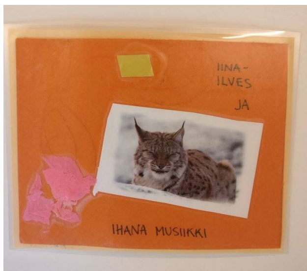
Kuva 3. Rentoutuskortti

Yksi rentoutuskorteista sisältää harjoituksia musiikin avulla (kuva 3.). Musiikin kuuntelu on monelle lapselle mielekästä ja auttaa rentoutumaan paremmin, kuin pelkän hiljaisuuden vallitessa. Lapset voivat esimerkiksi maata lattialla tai patjoilla ja kuunnella musiikkia. Lapset voivat itse valita musiikin, tai se voi olla myös kasvattajan tehtävä.