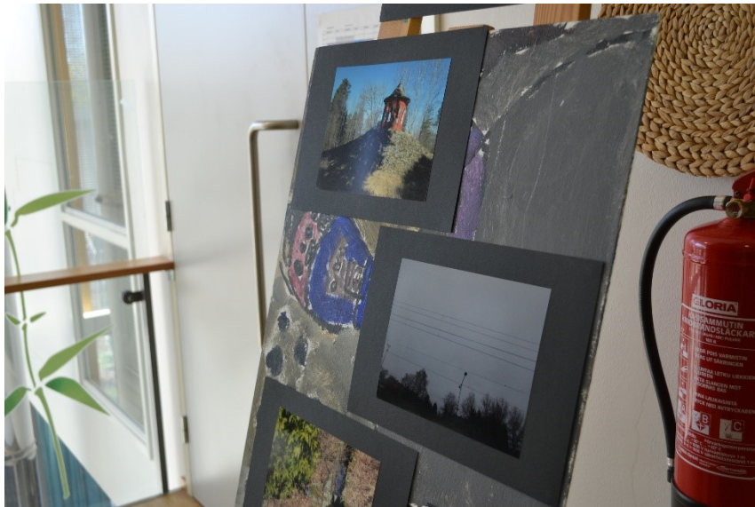
Kuva 5. Erään ryhmäläisen kuvat olivat esillä maalaustelineellä.

Valokuvanäyttely pidettiin toimintakeskuksella. Saimme käyttöömme neljä maalaustelinettä, joihin saimme kahden ryhmäläisen kuvat esille (Kuva 5.). Kahden muun ryhmäläisen kuvat kiinnitin seinälle. Järjestin kuvat niin, että ryhmäläisten kuvat olivat hieman erillään toisistaan. Ryhmäläisistä yksi oli poissa, ja mukana avustamassa tilojen järjestämisessä, oli ohjaaja, joka on työskennellyt kanssani koko prosessin ajan.