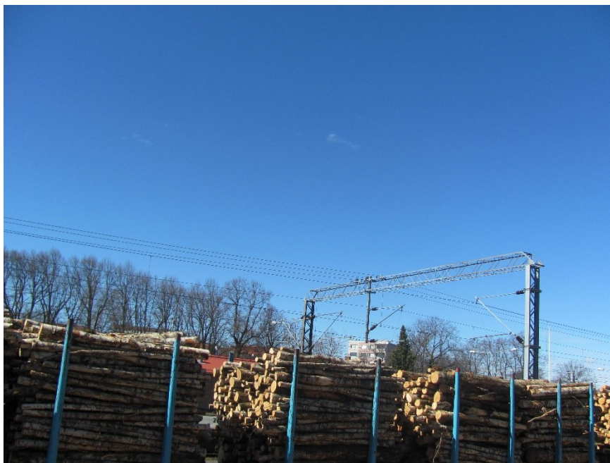
Kuva 2. Ryhmäläisen ottama kuva ”tukijunasta”.

Vaikka itse en normaalisti olisi mennyt tämänlaiseen paikkaan valokuvaamaan, ryhmäläiset löysivät paljon asioita, joita halusivat kuvata. Myös ryhmäläinen, jolle tukit olivat mielekkäitä, oli hyvin mielissään saadessaan niistä kuvia (kuva 2.).