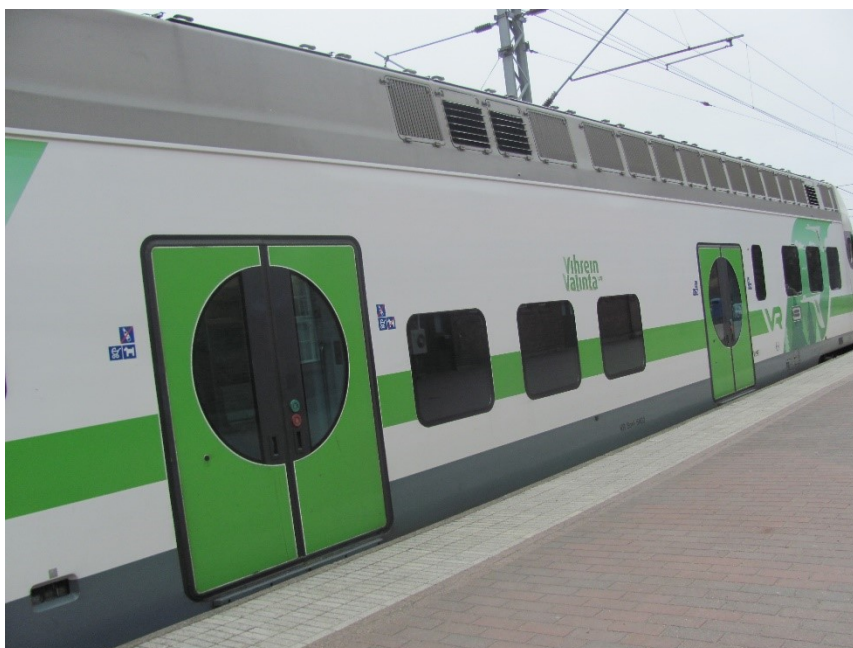
Kuva 4. Ryhmäläisen ottama kuva ohittavasta junasta.

Alkoi satamaan vettä ja päätimme vetäytyä kahvilan puolelle kahville ja jäätelölle. Istuessamme pöydän ääressä kerroin ryhmäläisille, että minulla oli mukana heidän ottamia kuvia ja voisimme hieman katsella niitä yhdessä. Olin tulostanut kaikilta kuvia ja kiinnittänyt ne niitillä yhteen. Ryhmäläiset keskittyivät tutkimaan muiden valokuvia ja he osoittelivat usein, jos näkivät jotain tuttua tai toisen ryhmäläisen kuvissa. Eräs ryhmäläinen, jolla oli ollut vaikeuksia pitkän prosessin pitää keskittymistään tekemisessä, seurasi hyvin tarkkana valokuvia. Hän myös osoitti ja kertoi, mitä hänen kuvissaan esiintyi. Kaikki vaikuttivat tyytyväisiltä ja ylpeiltä nähdessään oman työnsä tuloksia. Kyselin heiltä yksi kerrallaan, mitkä heidän kuvistaan oli parhaita. He osoittivat aina paria kuvaa, ja sen jälkeen sanoivat, mitä niissä esiintyy. Kun saimme katseltua kaikkien kuvat läpi, sekä nautittua kahvit ja jäätelöt, palasimme toimintakeskukselle lounaalle.