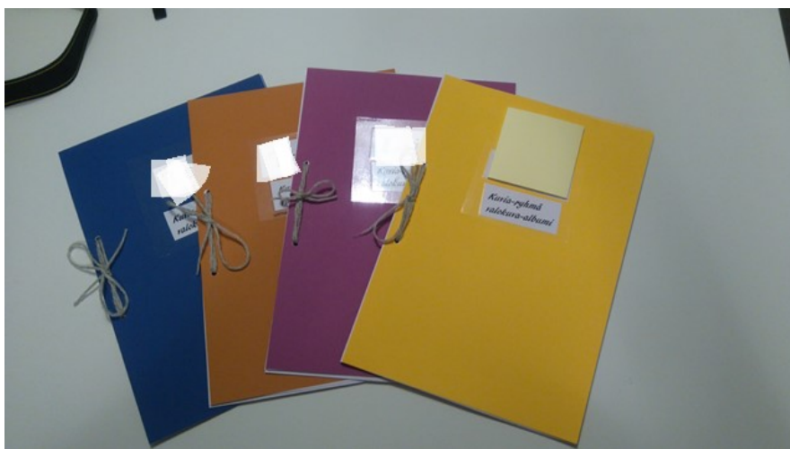
Kuva 6. Ryhmäläisten henkilökohtaiset valokuva-albumit.

Ennen kuin pidimme palautekeskustelun, kävimme uudestaan ihastele-massa valokuvanäyttelyä. Nyt yksi ryhmäläisistä, joka oli poissa näyttely-päivänä, pääsi esittelemään meille valokuviaan. Näyttelyn jälkeen jaoin ryhmäläisille heidän omat valokuva-albuminsa, joita he alkoivat innoissaan tutkimaan (Kuva 6.).