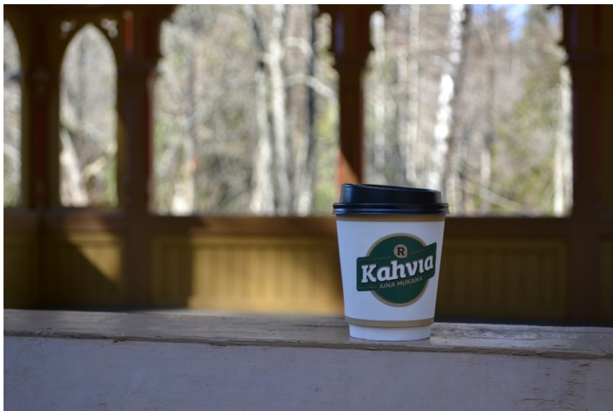
Kuva 1. Ryhmäläisen ottama kuva kahvimukista.

Ryhmäläinen, jonka kanssa olin, oli hyvin määrätietoinen siitä mitä hän halusi kuvata. Kuvaillessa sain tietää paljon kyseisen ryhmäläisen mieltymyksistä, sekä hänen arjen rutiineistaan. Esimerkiksi hän löysi pahvisen kahvimukin (Kuva 1.) ja kuvatessaan sitä kertoi, että hän pitää kahvista ja kertoi, milloin kahvia juodaan päivätoiminnassa. Puheenaiheet syntyivät, kun valokuvasimme ja hän aina kertoi mitä hän kuvaa ja välillä myös miksi kuvaa. Ryhmäläisellä onnistui valokuvaaminen erittäin hyvin, hän ei tarvinnut juuri lainkaan avustusta kameran käytössä.