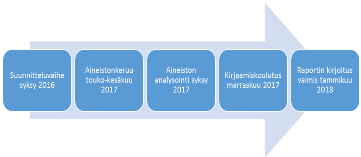
Kuvio 2. Kehittämiprojektin eteneminen.

Kehittämiprojekti eteni aikataulun mukaisesti. Se alkoi syksyllä 2016 suunnitteluvaiheella. Aineistonkeruu tapahtui touko-kesäkuun 2017 aikana. Tutkimustulosten analysointi sijoittui alkusyksyyn 2017. Kehittämiprojektin lopullinen raportti valmistui aikataulussa tammikuussa 2018.