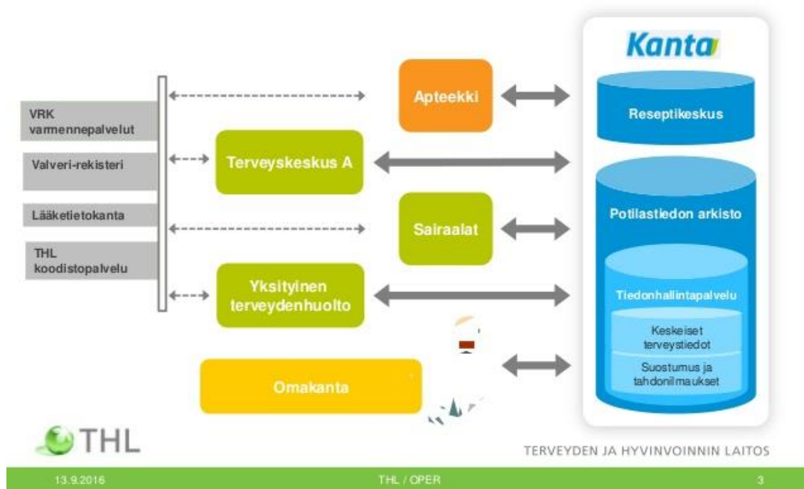
Kuvio 3. Kansallisten tietojärjestelmäpalveluiden kokonaisuus (THL 2016c).

Asiakastietolain mukaan tiedonhallintapalvelu sisältää potilastietojen luovutusta koskevan informaation antamismerkinnän, potilaan tekemät kiellot ja annetut suostumukset