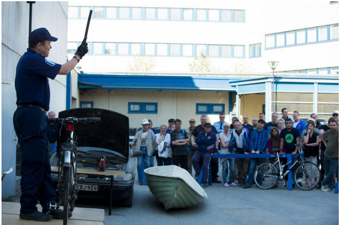
Kuvio 3. Jyväskylän poliisin huutokauppa 2016