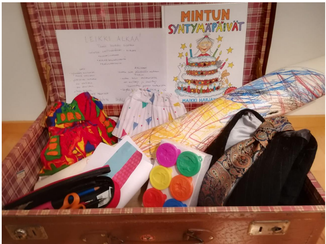
Kuva 1. Matkalaukku

Kokosimme matkalaukullisen esineitä, joiden tarkoituksena on innostaa lapsia ja aikuisia yhteisleikkiin. Matkalaukussa olevat esineet liittyvät projektissamme toteutettuun juhla-temaan. Laukku sisältää Minttu- kirjan, roolivaatteita, muoviluvahaa, case- tutkimuksen aikana lasten kanssa tehdyn onnittelubanderollin ja askarteluvälineitä. Lisäksi matkalaukussa on käyttövinkkejä esineiden hyödyntämiseksi (liite 2). Konkreettisen materiaalin lisäksi laukussa on internet - osoite, josta löytyy tämä opinnäytetyö. Opinnäytetyö itsessään on matkalaukkumateriaalin teoriaperusta.