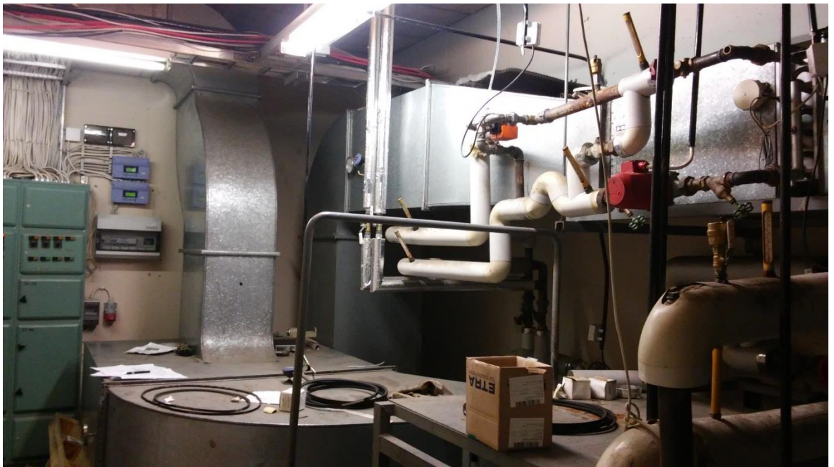
Kuva 1. Ilmanvaihdon konehuone.

Ilmanvaihdon konehuone sijaitsee 2. kerroksessa, konehuone kuvassa 1. Katolla on vanha konehuone, jossa on tilaa mahdolliselle uudelle ilmanvaihtokoneelle. Huippuimureiden tiedot liitteessä 3.