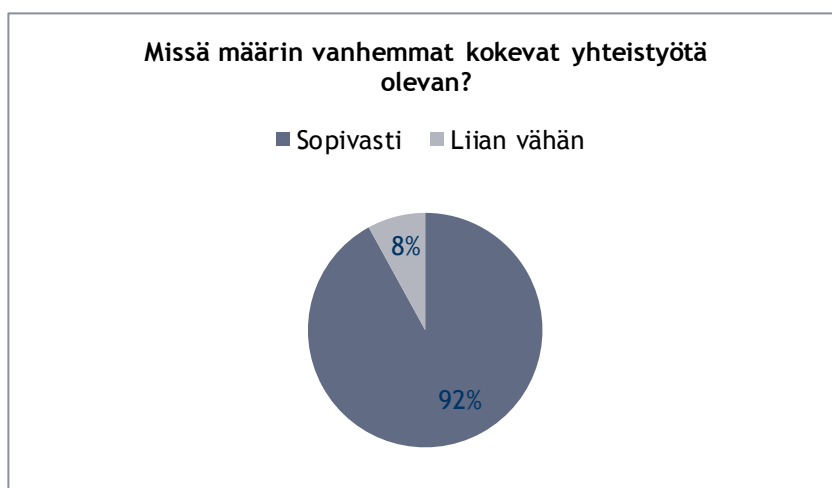
Kuvio 2: Missä määrin vanhemmat kokevat yhteistyötä olevan?

Toisen kysymyksen ” Missä määrin yhteistyötä on?” tarkoituksena oli selvittää, kokevatko vanhemmat, että yhteistyötä on riittävästi. Kysymys oli monivalintakysymys, jonka vastausvaihtoehdot olivat liian paljon, sopivasti tai liikaa. Tähän kysymykseen vastasivat kaikki kyselyyn vastaajat. Kyselyyn osallistuneista vanhemmista kukaan ei vastannut yhteistyötä olevan liikaa. Suurin osa vastaajista vastasi, että yhteistyötä on sopivasti. Näin vastasi 22 vanhempaa eli näin ollen noin 92 % vanhemmista vastasi yhteistyötä olevan sopivasti. Kaksi vanhempaa eli noin 8 % vastaajista vastasi yhteistyötä olevan liian vähän.