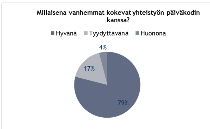
Kuvio 1: Millaisena vanhemmat kokevat yhteistyön?

kysymykseen, mutta suurin osa ei kirjoittanut mitään kysymyksen avoimeen kohtaan. Vanhemmista 19 eli 79% vastasi kokevansa yhteistyön hyvänä. Vanhemmista neljä eli 17 % vastasi kokevansa yhteistyön tyydyttävänä. Yksi vanhemmista vastasi kokevansa yhteistyön huonona.