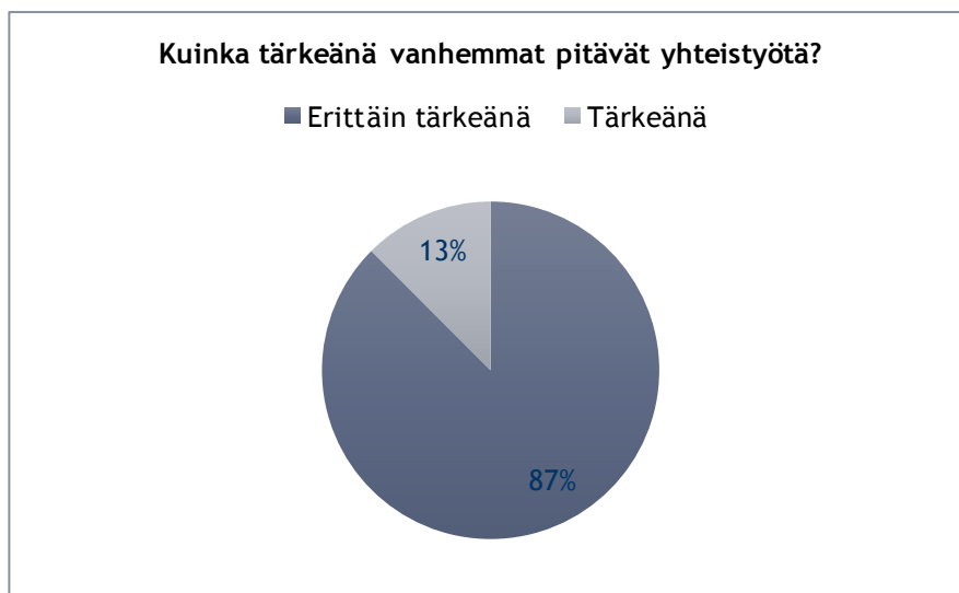
Kuvio 3: Kuinka tärkeänä vanhemmat pitävät yhteistyötä?

Neljännessä kysymyksessä selvitettiin kuinka tärkeänä vanhemmat pitävät kodin ja päiväkodin välistä yhteistyötä kysymyksellä ”Kuinka tärkeänä pidät yhteistyötä päivähoidon kanssa? ” Kysymys oli monivalintakysymys, jossa oli myös avoin tekstikenttä. Kysymykseen vastattiin vastausvaihtoehdoilla ”erittäin tärkeänä”, ”tärkeänä”, ”ei tärkeänä” ja ”riippuu tilanteesta, minkälaisesta?”. Tähän kysymykseen vastasivat kaikki kyselyyn osallistujat.