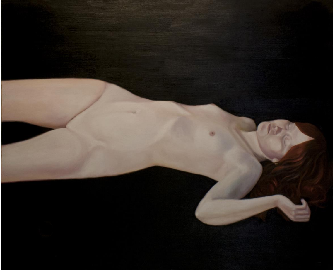
Kuva 16: Muista että olet kuolevainen, osa 3, öljy kankaalle, 2017

teokset vain aikakautensa peilinä? Jos kulttuuri muokkaa yhteiskunnan vanhuskäsitteitä, niin mikä rooli on maalaustaiteella tässä asiassa nykypäivänä? Herää kysymys, voiko nykypäivänä vaikuttaa vain maalausten, vai onko kyseinen media vanhentunut itse?