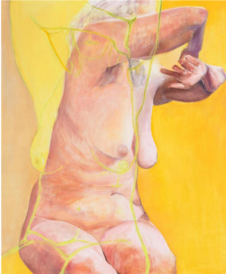
Kuva 10: Aura, 2016, öljy kankaalle