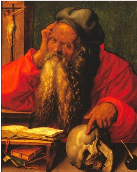
Kuva 3: Albrecht Dürer, Saint Jerome, v.1521.

Tekniikoita, joita taiteilijat käyttävät ilmaistakseen ikääntyviä kasvoja ja vartaloa, ovat mm. viivat ja uurteet, joilla kuvastetaan ryppyjä vanhan ihmisen kasvoilla. Viivojen käytöllä voidaan herättää katsojassa ehkä stereotyyppisiäkin kyseisen ajan mielikuvia vanhuuteen liittyen, kuten esim. rankat menneisyyden muistot, fyysinen kärsimys sekä viisaat ajatukset (alla olevassa Dürerin maalauksessa esimerkki tästä viivan käytöstä).