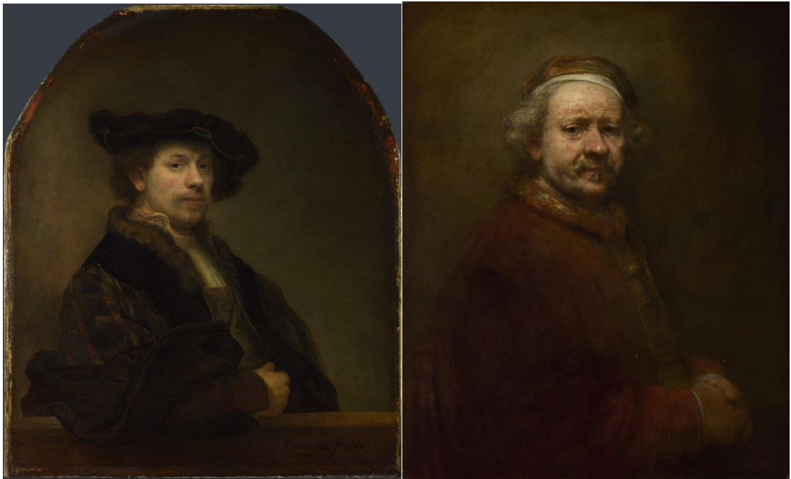
Kuva 7 ja 8: Rembrandtin omakuvat 34-vuotiaana (v.1640) ja 63-vuotiaana (v.1669)

Kun verrataan hänen 34-vuotiaan omakuvaansa hänen 64-vuotiaana maalaamaansa versioon, voidaan huomata henkistä kasvua, surua, kärsimystä sekä viisauden karttumista jälkimmäisessä. J. Jonesin mukaan ensimmäisessä kuvassa näkyy ylpeä Rembrandt, kun taas jälkimmäisessä Rembrandt esiintyy inhimillisenä ihmisenä. (Jones, 2012)