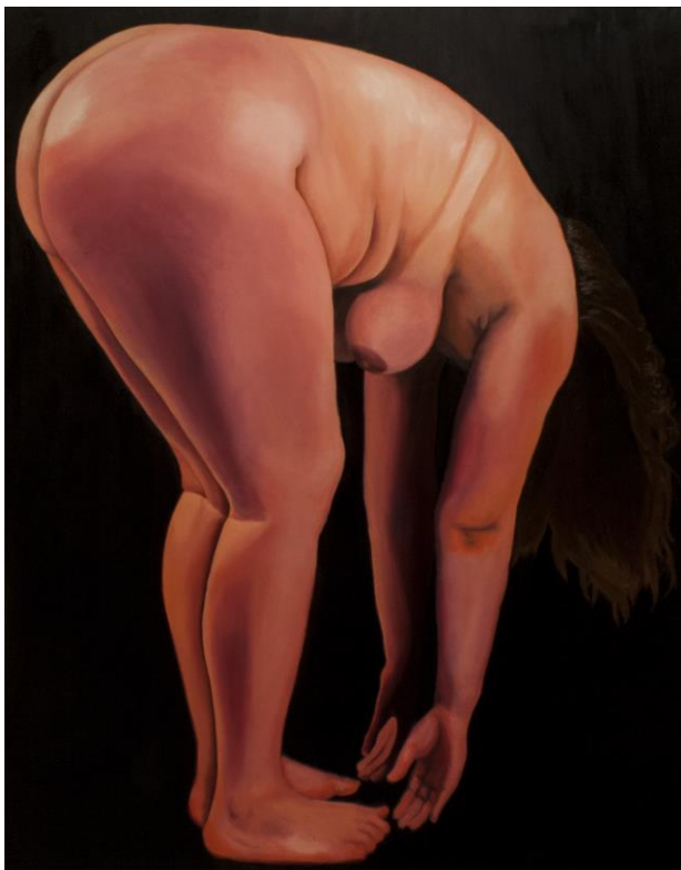
Kuva 14: Muista että olet kuolevainen, osa 1, 150x190cm, 2017, öljy kankaalle

Kiinnostuin keskiajalla suosiossa olleiden asetelmamaalausten symboliikasta ja niiden kauniiden pintojen alta paljastuvista synkistä puolista. Halusin tietää, mitä mahdollisia asenteita tai pelkoja symbolien takaa paljastuu ja mitä ne kertovat senhetkisestä yhteiskunnasta ja sen ajattelutavoista. Tartuinkin opinnäytetyön taiteellisessa puolessa kiinni memento mori -termistä ja päätin tehdä sitä kautta syntyneestä ajatuksesta maalaussarjan. Maalaussarjan nimeksi tuli Muista, että olet kuolevainen , joka koostui kolmesta suurikokoisesta öljyväriteoksesta. Nimi viittaa suoraan memento mori -asetelmamaalaukseen, joka suomennettuna tarkoittaa ”muista kuolevaisuutesi” tai ”muista kuolevasi”. Halusin yhdistää tämän vanhan termin ihmisruumiiseen, ja tuoda näin esiin vanhenemisen pelkoa sekä kuolevaisuuden teemaa. Minua on myös aina kiehtonut maalattu ihmiskeho, halusin päästä tutkimaan ihoa ja lihaa maalauksissani; ajatella tavallaan ihmistä asetelmamaalauksen kimmoisana hedelmänä. Nuori ihmisvartalo säilyy hedelmän tavoin heleänä ja hehkuvana vain kuvissa. Asetelmamaalausten säilötty kauneus muistuttaa elämän katoavaisuudesta ja hetkellisyydestä. Näitä asioita pyörittelin mielessäni lähtiessäni työstämään teossarjaa.