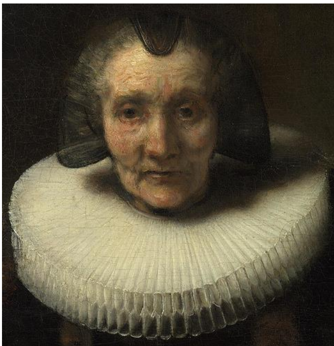
Kuva 6: Rembrandt: Portrait of Margaretha de Geer, Wife of Jacob Trip n. 1661