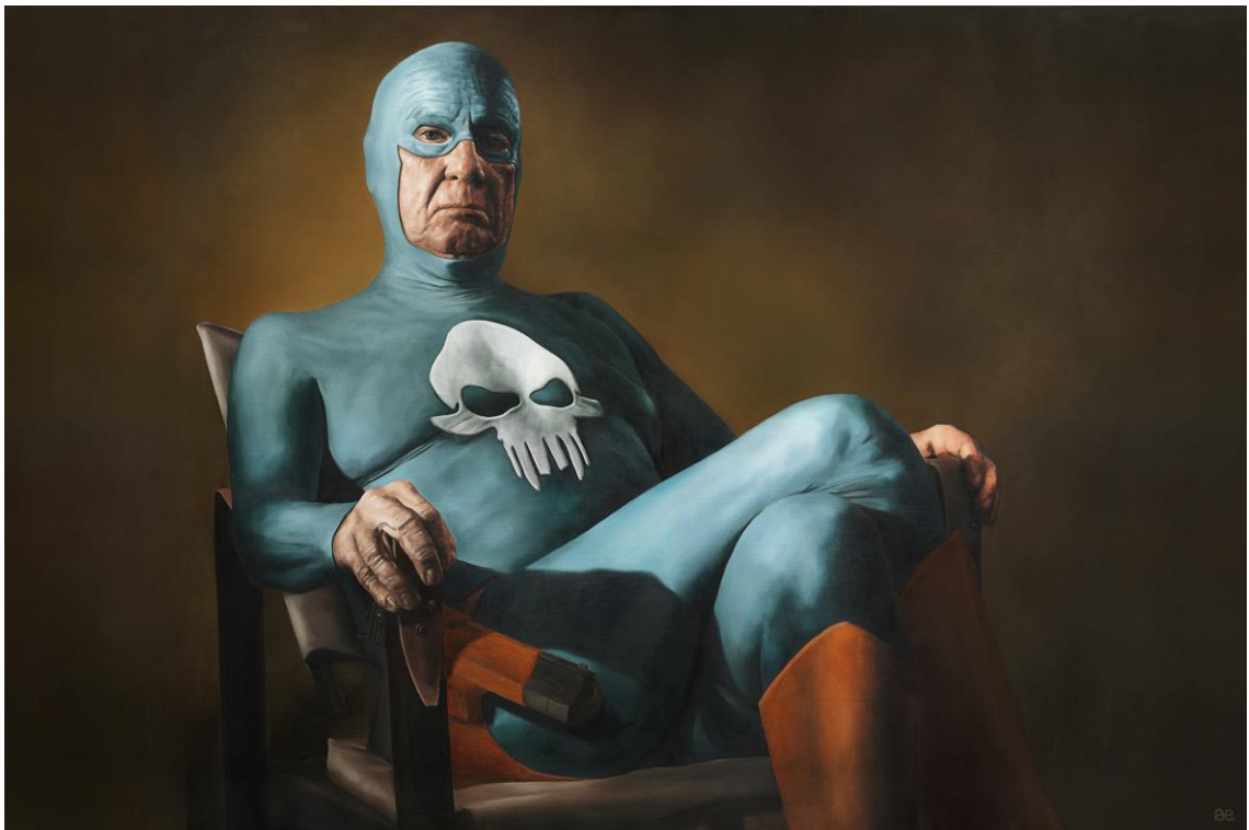
Kuva 12: Sitting, Andreas Englund, 100x126cm

Ruotsalaisen taidemaalarin in (s.1974) maalauksissa seikkailee ikääntynyt supermies. Teemat vanhuus ja supersankariuus on harvoin tai ei milloinkaan liitetty yhteen, sillä yhdistelmä nähdään tuskin yleisesti kovin hauskana tai rajattomia mahdollisuuksia avartavana. Englundin maalaukset ovat hyvin realistisesti maalattuja ja aiheet ovat arkipäiväisiä ja humoristisia. Supersankari nähdään mm. syömässä klementtiinejä, katsomassa televisiota ja tukehtumassa ruokaan illallisjuhlissa.