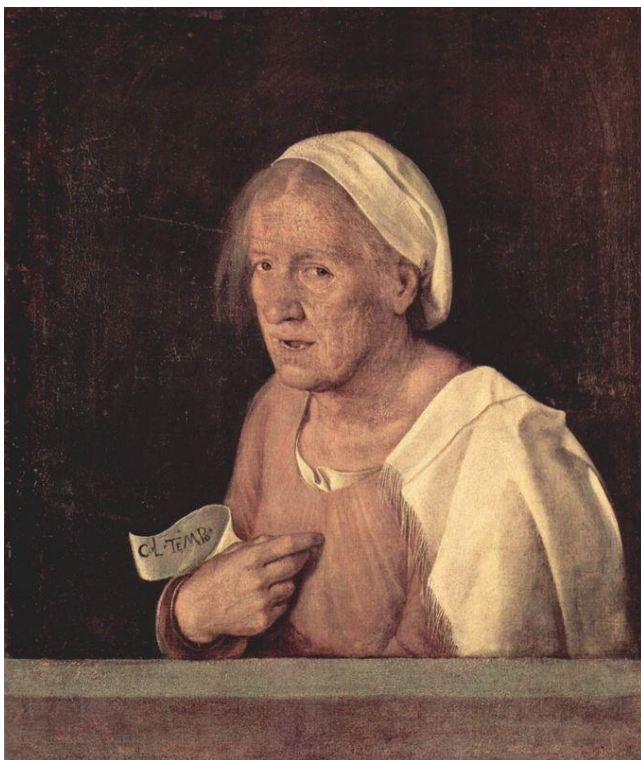
Kuva 4: La Vecchia, Giorgione, v.1510

Ajan vanhuskuvasta ja vanhuuden kuvaamisesta maalauksen keinoin kertoo hyvin aikansa ikoninen taulu sekä aikakautensa kuuluisin vanhuutta käsittelevä maalaus nimeltä La Vecchia . Sen on maalannut renessanssin ajan venetsialainen maalari Giorgione (s.1478). Kuvassa alempaan luokkaan kuuluva vanhempi nainen poseeraa kaiteen takana. Hän katsoo suoraan katsojaan, suu aukinaisena. Hänellä on kädessään banderolli, jossa on teksti: "Col tempo", mikä suomentuu "ajan kanssa". Tällä Giorgione luultavasti pilkkaa ihmisten turhamaisuutta ja lähettää viestin, että jokainen kaunis kasvo rypistyy ja kellastuu ajan myötä.