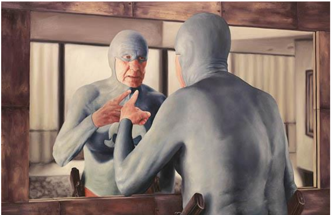
Kuva 13: Mirror, öljy kankaalle, 150 x 88cm

Englundin maalauksissa on se erikoisuus, että ne voi nähdä sekä positiivisena että negatiivisena kuvauksena vanhuudesta yhtä aikaa, samassa teoksessa. Onko teosten huumori suoraa ivaa vai voimaannuttavaa itselle nauramista, se riippuu täysin katsojasta. Vai voiko kyseessä olla taitelijan oma pohdinta edessä hämmöttävää vanhuusaikaa kohtaan? Maalaamalla alter ego - supersankarivanhuksen seikkailuja taiteilija saattaa itse käsitellä mahdollisia omia pelkojaan tai asenteitaan vanhuudesta huumorin avulla.