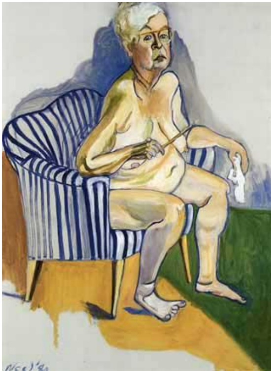
Kuva 9: 1980 Self Portrait, öljy kankaalle, 137.2 x 101.6 cm

Vaikka naisen alastonkuva on taidehistorian suosituimpia aiheita, vanhemmat naiset esitettynä muulla tavalla kuin humoristiseen sävyyn ovat erittäin harvinaisia. Tässä kaavoja rikkovassa maalauksessa Neel asettaa uuden näkökulman länsimaiselle taiteelle esittämällä 80-vuotiaan kehonsa ilman häpeää. (Piepenbring, 2017)