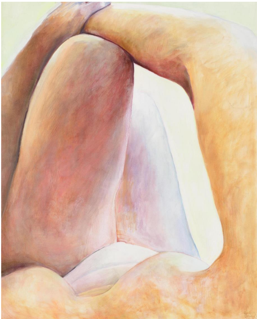
Kuva 11: Cool light, 2016, öljy kankaalle

haluaa. ” Neel ottaa paljon tavallisia valokuvia itsestään ja alastomasta kehostaan, joista hän myöhemmin työstää maalauksia. Joskus tietokoneen valo tai salaman heijastus sekoittavat kuvaan nykyaikaisen muotokuvan elementtejä. Vaikka alastomat naiset ovat koristaneet gallerioiden seiniä nykypäivään saakka, vanhempien naisten kuvat ovat yhä todella harvinaislaatuisia. (Haynes, 2016)