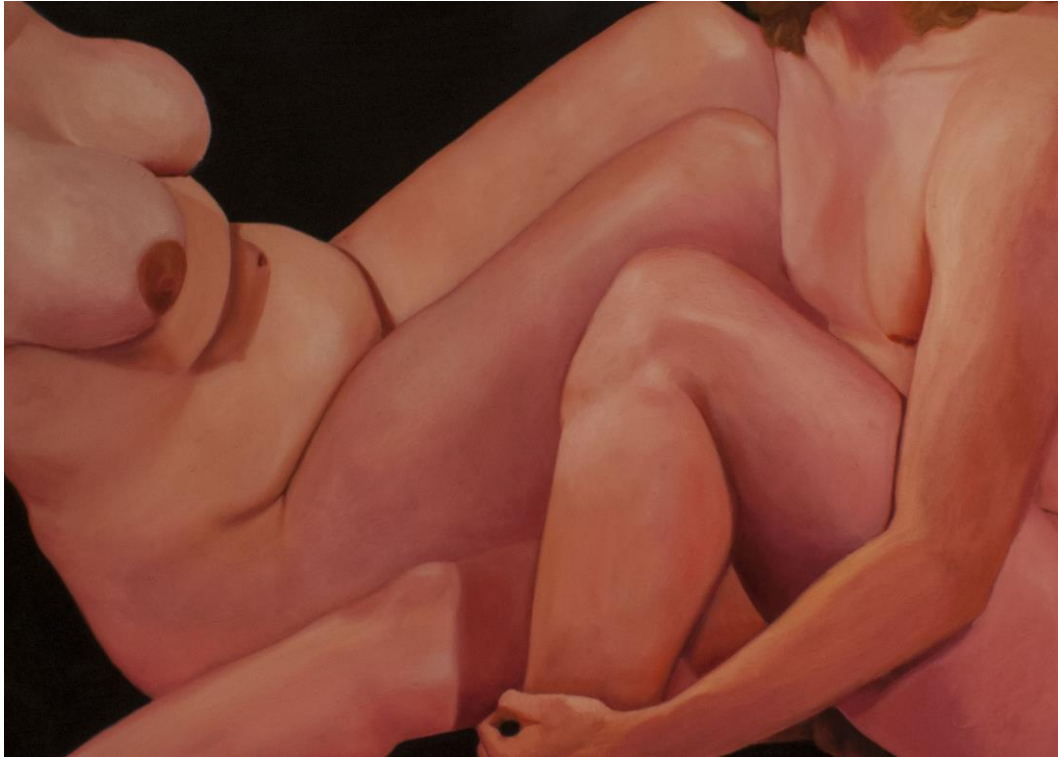
Kuva 15: Muista että olet kuolevainen, osa 2, 150x190cm, 2017, öljy kankaalle

Otin eri malleista studiossa valokuvia, jotka maalasin sitten suureen kokoon kankaalle. Osassa töistä käytin mikropalloja, mitkä tukevoittivat maalausjälkeä ja tekivät paikoin pinnasta oudon rosoista.