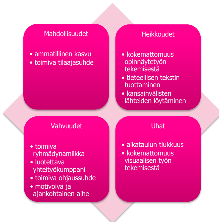
KUVIO 3. SWOT-analyysi

Opinnäytetyötä tehdessä on tärkeää pohtia omia työskentelytapojaan. Koimme luontevaksi pohtia sitä SWOT-analyysin kautta. SWOT-analyysi on hyvä menetelmä arvioida sisäisiä ja ulkoisia ominaisuuksia ennen työn aloittamista. SWOT koostuu englannin kielen sanoista Strengths = vahvuudet, Weaknesses = heikkoudet, Opportunities = mahdollisuudet ja Threats = uhat. SWOT-analyysin avulla voidaan ohjata oppimista ja tunnistaa ennalta mahdolliset solmukohdat. (Opetushallitus 2017.)