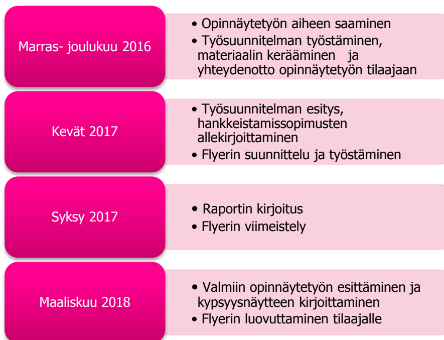
KUVIO 4. Opinnäytetyön aikataulu

Oikeanlaisen aikataulun laatiminen opinnäytetyön suunnitteluvaiheessa on ensiarvoisen tärkeää. Liiallinen tuudittautuminen rajattomaan aikaan on opinnäytetyön valmistumisen kannalta tuhoisaa. Opinnäytetyön valmistumisen kannalta suunnitelmallisesti kaksi vuotta on liian pitkä aika, kun taas yhdeksän kuukautta työtä opintojen ohessa on realistista. (Hakala 2004, 15.) Laadimme opinnäytetyölle aikataulun, joka esitellään kuviossa 4. Jouduimme muuttamaan useaan kertaan opinnäytetyömme aikataulua, sillä ensimmäinen aikataulumme oli epärealistinen. Opinnäytetyön aiheen vaihtuminen työn suunnitelmavaiheessa viivytti aikataulua huomattavasti, sillä aloitimme käytännössä prosessin alusta uuden aiheen saatuaamme. Aiheeseen perehtyminen ja tiedonkeruu veivät aikaa, sillä seksuaalinen häirintä aiheena oli meille tuntematon.