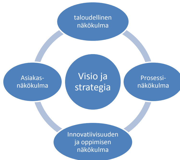
Kuvio 3 Balanced scorecard (Malmi ym. 2006, 17)

Kuviossa 3 on kuvattuna Balanced scorecard, jota organisaatiot usein muokkaavat omaan käyttöön sopivaksi. Olennaista on, että eri näkökulmien yhteys strategiaan säilyy.