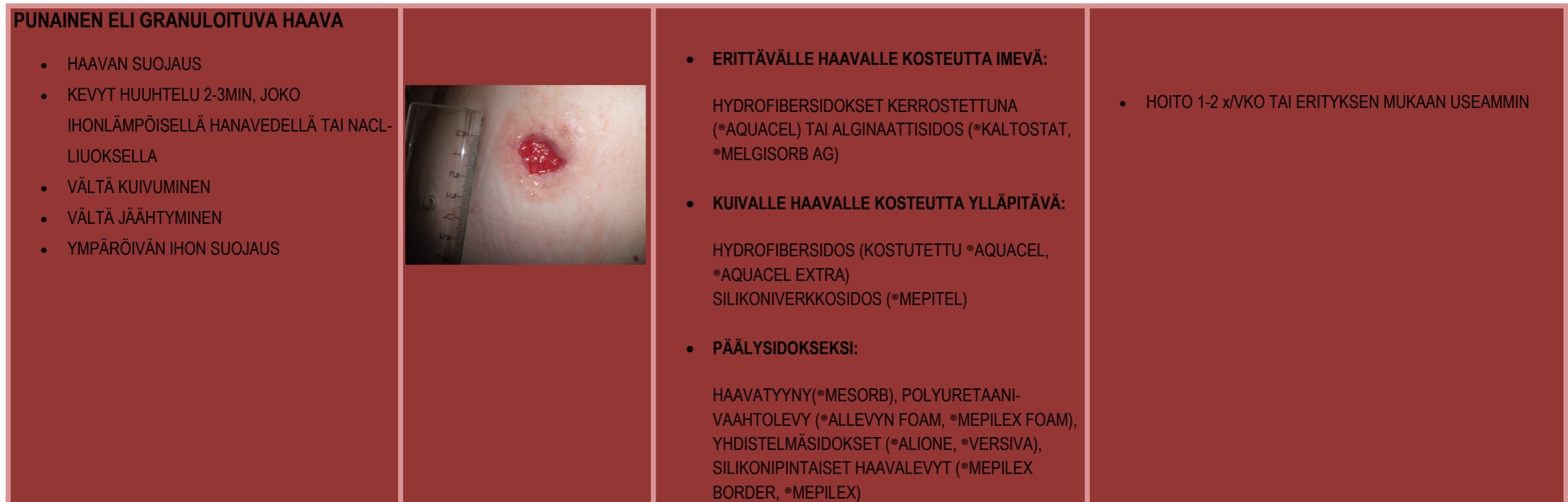
KUVA 2 GRANULOIVA HAAVA