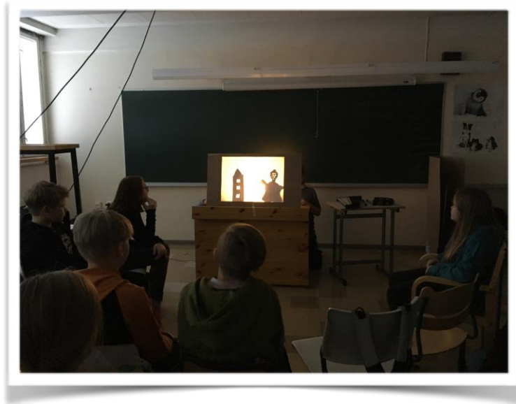
Kuva 6. Työpajan satoa.

Joillain oli selvä suunnitelma siitä, miten ääni rytmittäisi esitystä, toiset tarvitsivat enemmän ohjausta. Kannustin heitä valitsemaan ainakin yhden soittimen, joka kuvaisi joko jotain roolihenkilöä tai esityksen tapahtumaa. Osa ryhmistä halusi hoitaa myös äänet itse esityksen aikana ja osaa autoin.