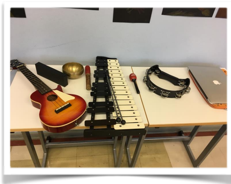
Kuva 5. Työpajassa käytettyjä soittimia.

Työpajan aluksi kerroimme varjoteatterista ja esittelimme työvälineet. Toimme mukana pienen pöydälle asetettavan kankaan, lampun ja esimerkinukkeja. Pystyimme näin näyttämään lapsille, miten varjoteatteria yksinkertaisimmillaan pystytään luokkaympäristössä tekemään. Varjoteatterityöpajan yhtenä tavoitteena oli esitellä helppo ja halpa tapa elävöittää opiskelua, oppimista ja tarinankerontaa taiteen keinoin. Toimme lisäksi mukana soittimia: ukulelen, äänimaljan, kellopelin, marakassin ja tamburiiniin. Lisäksi mukana oli tietokone ja pieni bluetooth-kaiutin, jolla pystyimme tarvittaessa soittamaan valmiita kappaleita koneelta tai käyttämään Garage Band -ohjelmaa. Lapset kokeilivat minkälaisia ääniä he saivat soittimista. Samalla he oppivat soitinten nimet.