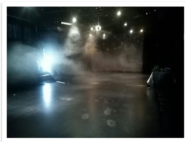
Kuva 2. Tyhjä esitystila. Kuvan takaosassa näkyy isompi varjokangas.

Tytön ja Kuun tarinan jälkeen varjokangassermi käännettiin ja sermin takaa ilmestyi kolme astrorikosetsivää, joita me esiintyjät esitimme. Astrorikosetsivät johdattivat lapset sermin taakse isompaan esitystilaan ja tilan reunoille asetetuille jakkaroille istumaan. Oli aika aloittaa yhdessä pelaaminen ja selvittää kadonneen Kuun arvoitus.