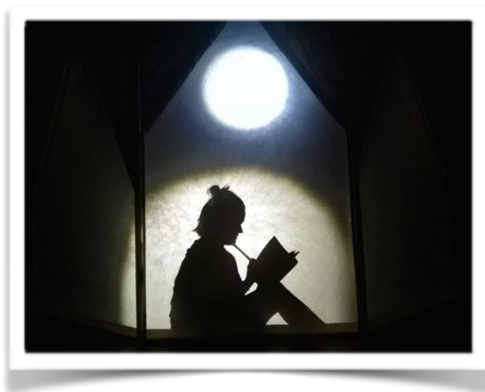
Kuva 1. Harjoituksissa. Kuvassa tyttö ja Kuu.

Aaltonen kirjoittaa, että varjoteatteriin tarvitaan kangas ja esiintyjien on hyvä ymmärtää oman kehonsa suhde kankaaseen nähden. Kangas ei ole pelkästään materiaalin asemassa, vaan sillä on hyvin oleellinen rooli siihen, millaisia varjoja halutaan muodostaa. Kankaan koko määräytyy tarpeiden mukaan. Tärkeää on myös löytää oikeanlainen valon lähde, jotta päästään asetettuihin tavoitteisiin. (Aaltonen 2002, 81–83.)