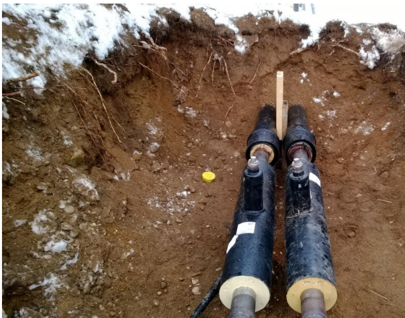
Kuva 1. 2Mpuk /14/

Yksiputkijohdossa on erilliset meno- ja paluuputket. 2Mpuk-kaukolämpöelementissä on teräksinen virtausputki ja polyeteenisuojakuori, joiden välissä on kiinnivaahdotettu polyuretaanieriste, joka liittää ne yhteen. Kuvassa 1 on esitetty 2Mpuk. Putkien pituus kokoluokasta riippuen vaihtelee 6–18 m. Yksiputkijohdtoa valmistetaan DN 20-DN 600 -kokoluokkaa, mutta tarvittaessa myös DN 1200:een asti. /5./