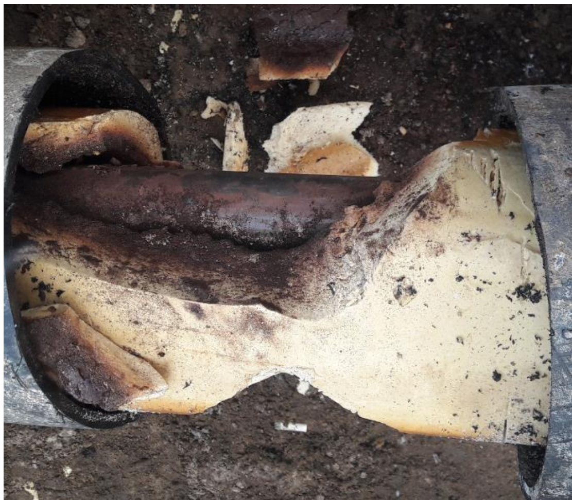
Kuva 7. Mpul-talojohto

Korjaussuunnitelma tehdään Mpul-talojohtoille, koska niiden mahdolliset vuodot aiheuttavat höyryn takia kosteusvaurioita kiinteistölle. Mpul-johdossa on il-maväli polyuretaanieristeen ja virtausputken välissä, jolloin vuodon sattuessa höyry pääsee etenemään kohti rakennusta, aiheuttaen kosteusvaurioita. Ku-vassa 7 on Mpul-talojohto, joka aiheutti kosteuden hajun kiinteistön lämmönja-kuhuneelle.