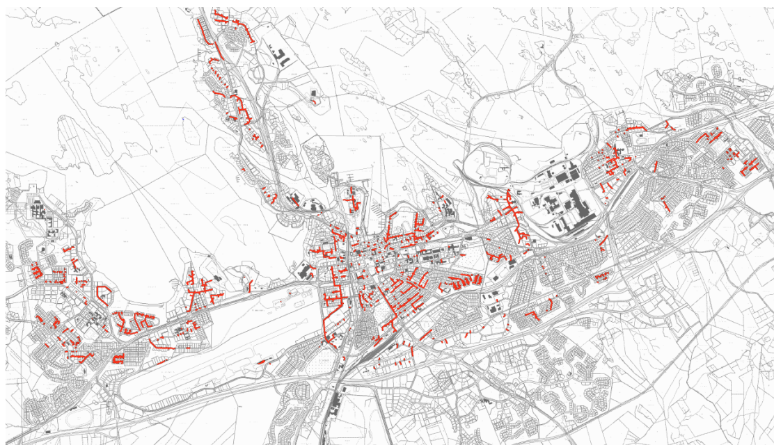
Kuva 8. Mpul-talojohdot punaisena /10/