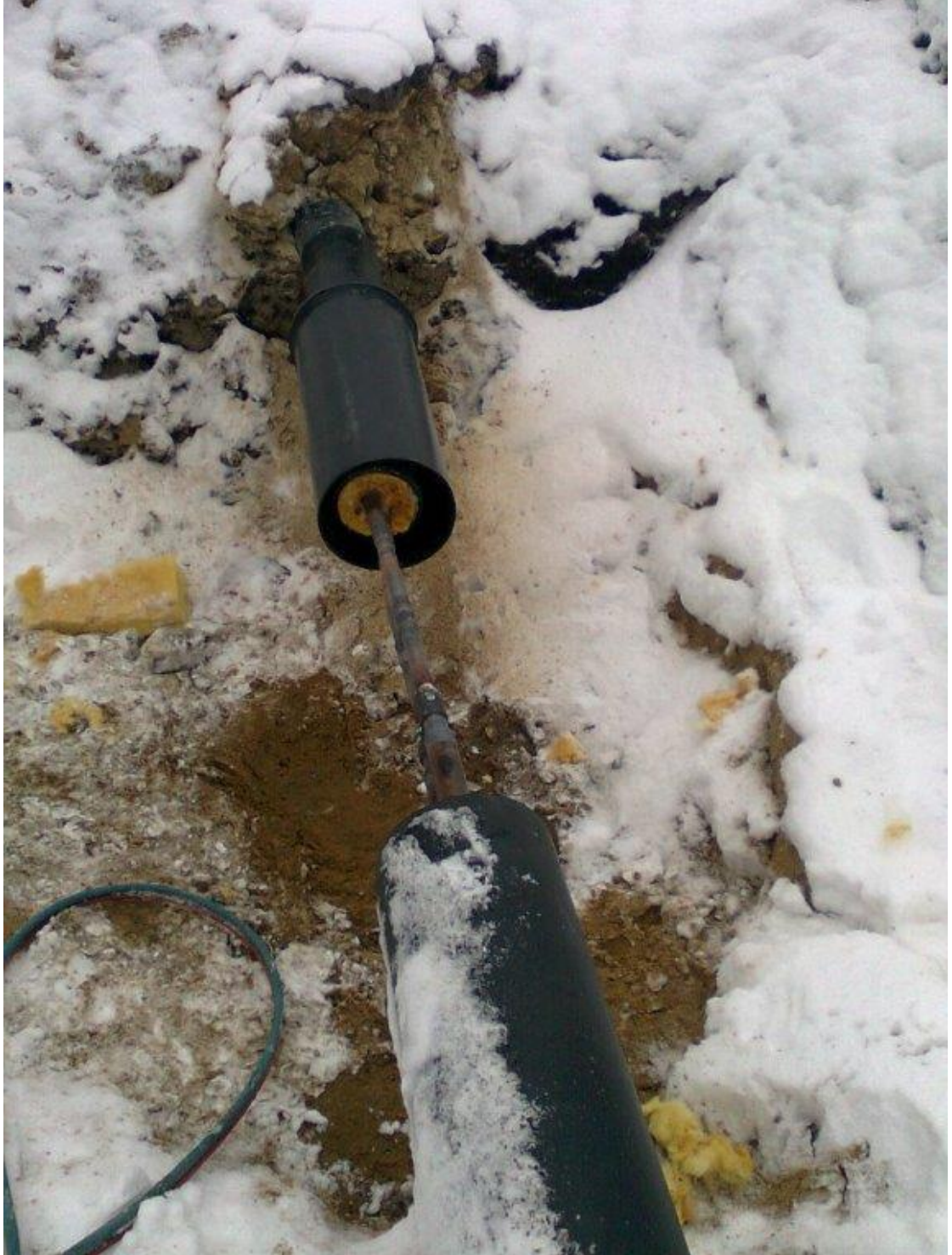
Kuva 3. Cu-Mmvl /14/

tua kuparia. Myös PEX-, PB-, tai PP-muoviputkea käytetään virtausputkimateriaaleina, mutta sen käyttö on vähäistä Suomessa matalan lämpötilan ja paineen kestävyys takia. /5./