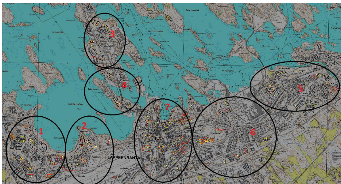
Kuva 9. Aluejako /10/

Korjaussuunnitelmassa aluejako on tärkeässä osassa, jos saneerattava määrä on suuri. Aluejako tehtiin seitsemään osaan. Kuvassa 9 on esitetty aluejako. Saneeraus aloitetaan lännestä, koska siellä on vanhimmat talojohdot ja alue on suuri. Numerot kuvassa 9 tarkoittaa saneerausjärjestystä.