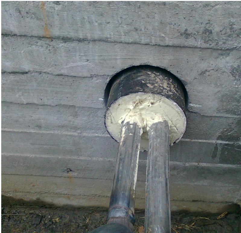
Kuva 2. Mpuk vaakatasoon asennettuna /14/

Kaksiputkijohtoa valmistetaan DN 2x20-DN 2x200 -kokoluokkaa ja putkien pituudet kokoluokasta riippuen on joko 6 tai 12 m. /5./