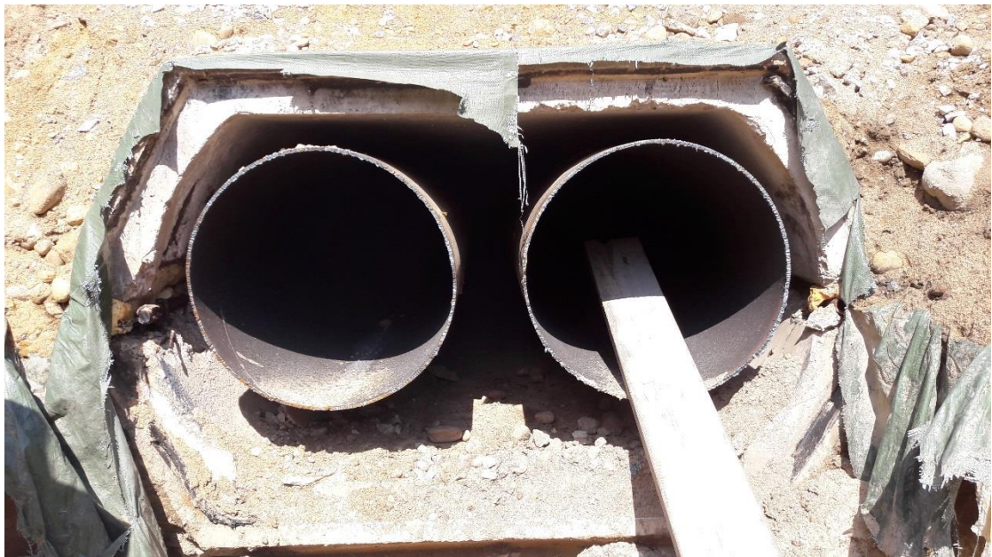
Kuva 4. Emv, jonka virtausputken ympäriltä puuttuu mineraalivilla /14/

Betonikanavajohtoja on erityyppisiä, mutta niillä kaikilla on sama toimintaperiaate. Virtausputkena toimiva teräsputki on sijoitettu kannakkeiden varaa betonikuoren sisään. Kuvassa 4 on esitetty Emv ilman mineraalivillaa. Kannakkeiden avulla teräsputken tuenta ja lämpöliikkeet ohjautuvat suunnitellusti kuoren seiniin ja pohjaan. Alaelementtien välissä on kiintopiste-elementtejä, joihin kiinnitetään hitsaamalla virtausputket. Lämpötilavaihteluiden johdosta syntyy kuormituksia, jotka ohjataan maahan kiintopisteiden avulla. Kansielementti nostetaan alaelementin päälle ja tiivistetään saumat. Elementit muodostavat yhdessä johtokanavan, jossa virtausputket voivat liikkua kiintopisteiden ohjajana lämpövaihteluiden mukaan. Betonielementin seinien ja virtausputkien väliin jää riittävästi tilaa eristämiseen ja tuulettumiseen. /5./