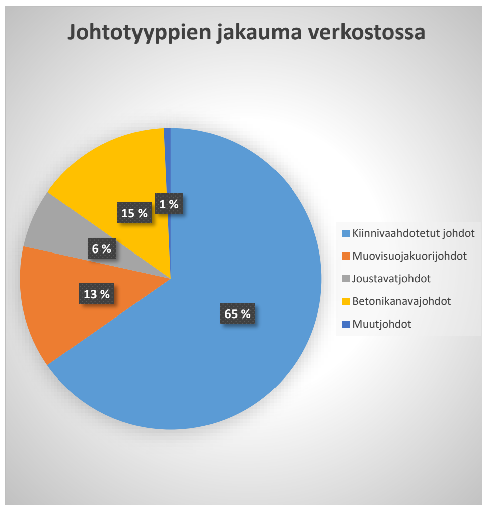
Kuva 6. Johtotyyppien jakautuma verkossa

Kuten taulukoista näkee, kiinnivaahdotettuja johtoja on eniten verkossa. Kuvassa 6 on esitetty kokonaisjohtojakautuma prosentteina kaukolämpöverkossa.