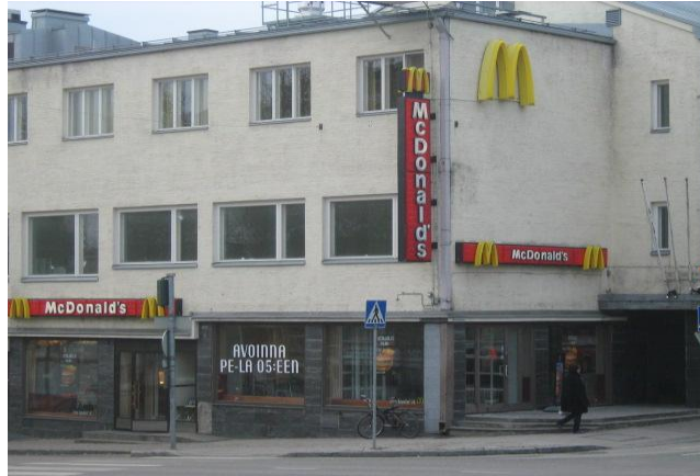
KUVIO 2. Iisalmen Mc Donald's

Mc Donald'sin (KUVIO 2) merkitys nuorille kävi ilmi jo ensimmäisessä työpajassa: kun nuorten piti esitellä Iisalmea toisilleen, jokaisessa luokassa lähes jokainen ryhmä esitteli toisilleen pikaruokaravintola Mc Donald'sin. Kohderyhmän mukaan valtaosa nuorista viettää vapaa-aikaansa Mc Donald'sissa, syövät siellä ja tapaavat tuttaviaan. Nämä nuoret käyvät Mc Donald'sissa 2-4 kertaa viikossa. He eivät aina osta mitään, mutta ovat siellä, koska sieltä ei nuorten mukaan tulla ajamaan poiskaan. Vapaa-ajallaan nuoret saattavat istua ”mäkkärissä” monta tuntia, kävellä välillä ”kujan” kautta citymarkettiin, pelata pelikoneita ja rahaa voitettuaan palata takaisin Mc Donald'siin syömään.