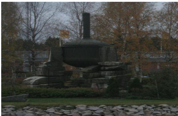
KUVIO 6. Olvin edustalla oleva suihkulähde