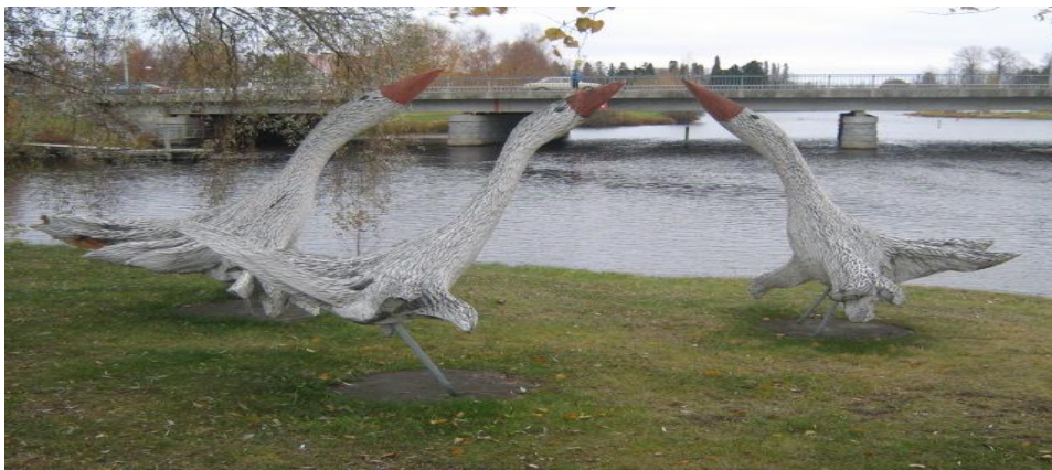
KUVIO 5. Puujoutsenet Paloisvirran varrella