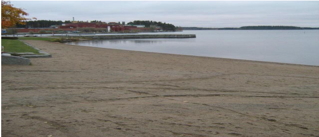
KUVIO 4. Iisalmen Kaupunginranta, taustalla Olvin tehtaat