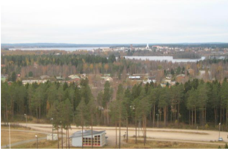
KUVIO 3. Näkymä Iisalmen Paloisvuoren huipulta, alhaalla Paloski-rinnekahvila

Paloisvuoren ulkoilualueet käsittävät pururadan ja laskettelurinteet Iisalmen Paloisvuoren yhteydessä (KUVIO 3). Oppilaiden mielestä rinteet eivät ole kovin hyvät, mutta kokevat silti Paloisvuoren mukavaksi paikaksi, jossa on kiva käydä talvella. Kritiikkiä tuli siitä, että Paloski-rinnekahvion hintataso on kallis. Nuoret toivoivat, että myös takarinteet saataisiin takaisin käyttöön.