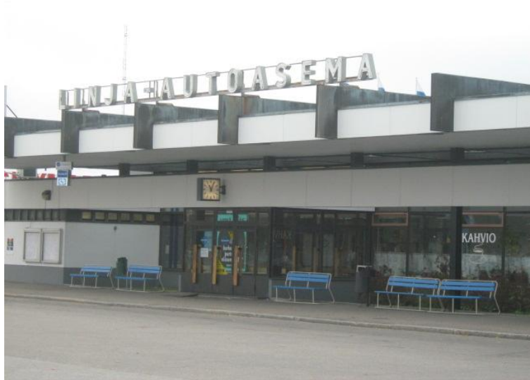
KUVIO 6. Iisalmen Linja-autoasema

“Turha, koska kukaan ei oo torilla ja siihen käytettiin turhaan rahaa siellä ei ikinä järjestetä mitään. Torille enemmän ohjelmaa.”