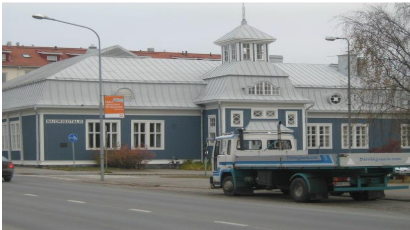
KUVIO 8. Iisalmen Nuorisotalo

Iisalmessa toimii aktiivinen nuorisoneuvosto.” Iisalmen Nuorisoneuvosto INN on nuorten virallinen edustaja Iisalmessa. Nuorisoneuvosto on poliittisesti ja uskonnollisesti sitoutumaton. Sen tarkoituksena on ajaa nuorten etua ja edistää sekä kehittää nuorten oloja ja ajanviettomahdollisuuksia Iisalmessa. (Iisalmi 2010.) Yksikään nuorista, joiden kanssa tein töitä, ei tiennyt Iisalmessa olevan nuorisoneuvostoa.