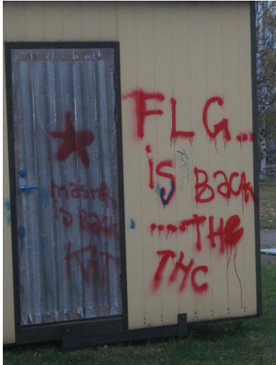
KUVIO 7. Kuva graffiteista Iisalmessa

Nuoret olivat huolissaan kaupungin maineesta ja katukuvasta. He halusivat poistaa useita paikkoja, sillä he kokivat ne rumiksi ja turhiksi. Erityisesti kuvat, joissa oli graffitteja Iisalmesta, olivat suosiossa (KUVIO 7).