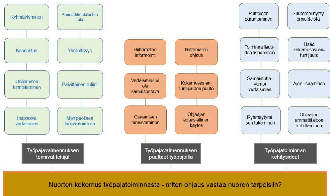
Kuvio 3. Ylä- ja pääluokittelu