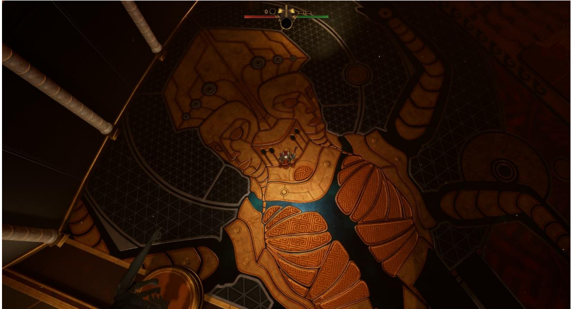
Kuva 3. Avernuksen kuvamateriaalia.

kappaleessa kuuluva kalina on tehty MIDI-jousien todella kaiutetulla ja efektien läpi ajettulla pizzicatolla.