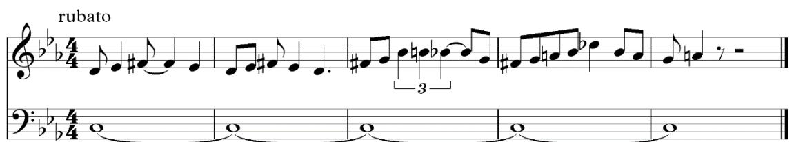
Nuottiesimerkki 6. Esimerkki kappaleen osasta, jonka voisi ajatella noudattavan itämaista G-molliasteikkoa, jossa on lisäsävelenä H.

Kuvien ja videomateriaalien perusteella Hubin arkkitehtuuri toi mieleeni etäisesti muinaisen Egyptin (kuvat 2 ja 3), joten pyrin melodiaa säveltäessäni hieman egyptiläiseen ja muutenkin muinaisuutta kuvastavaan tunnelmaan. Jälkeenpäin tarkasteltuna olen tavoitellut tätä käyttämällä sävellyksessä enimmäkseen G-fryygistä asteikkoa, G-fryygistä dominanttiasteikkoa sekä itämaista G-molliasteikkoa, joihin kaikkiin on tuotu jännitettä lisäsävelillä (nuottiesimerkit 6 ja 7). Kappaleen voisi kuitenkin katsoa alkavan luonnollisella C-molliasteikolla, joka vähitellen muuttuu g-fryygiselle dominanttiasteikolle oleellisia G-, Ab-, ja H-säveliä korostavaksi. Melodiasoittimina käytin enimmäkseen erilaisia pehmeitä puupuhaltimia ja jousia, joiden ääniä muokkasin synteettisemmiksi.