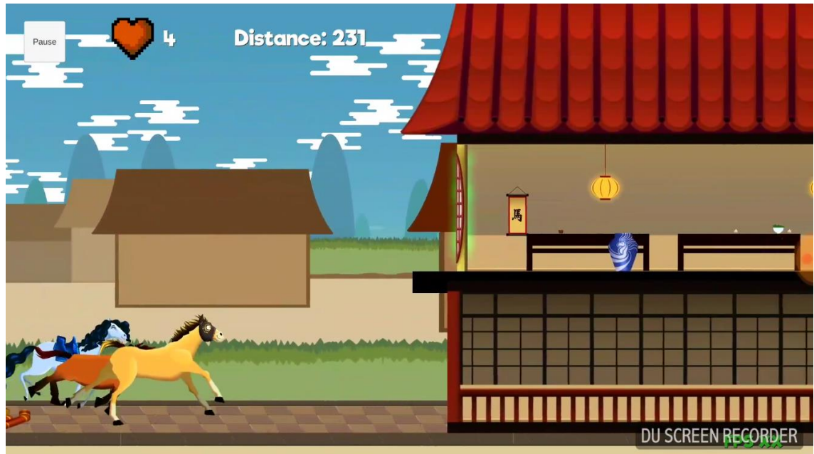
Kuva 1. Gallop Gangin kuvamateriaalia (Kuva: Olli Ikonen).

Rummut soittavat läpi kappaleen samaa, ensimmäisen osan bassolinjaa imitoivaa komppia, jonka tarkoituksena on kuulostaa mahdollisimman eteenpäin vievältä. Ensimmäisestä kappaleesta poiketen, rytmisoittimet eivät tässä kappaleessa viittaa niin selkeästi hevosiin, vaan niiden tarkoitus on enemmänkin antaa vaikutelma vauhdista ja kiireestä.