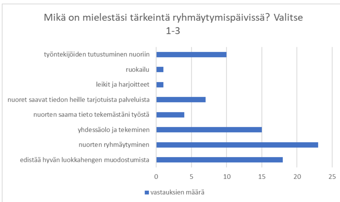
Kuvio 3. Kysely ryhmäytymispäivän tärkeistä tavoitteista.

Ryhmäytymispäivät ovat myös kaikille työntekijöille merkitykselliset heidän tutustuaan nuoriin sekä nuorten saamaa tietoa heidän tarjoamistaan palveluista pidetään tärkeänä (ks. kuvio 3). Kuvioista kolme kuitenkin voidaan päätelmä ryhmäytymisen olevan päivän tärkein anti. Kuvioista kolme on jätetty palautteen kerääminen ja tutustuminen ympäristöön (vuolahden leirialue) pois sillä kukaan vastaajista ei ollut merkinnyt sitä omaan palautelomakkeeseensa. Palautteen kerääminen nuorilta on kuitenkin hyvin olennainen asia, koska niiden pohjalta voidaan ryhmäytymispäiviä kehittää.