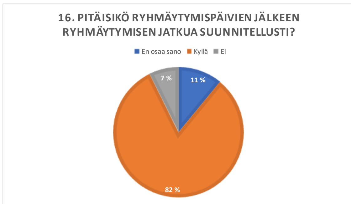
Kuvio 5. Ryhmäytymisen jatkuminen.