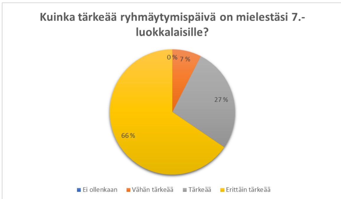
Kuvio 2. Ryhmäytymisen tärkeys 7.- luokkalaisille.

Tulosten perusteella ryhmäytymispäivä aloittaville 7.- luokkalaisille on tärkeä (ks. Kuvio 2). Teettämäni Webropol-kyselyyn vastasi 26 työntekijää. Vastaajista 12 oli opettajia, 8 nuorisopalveluiden työntekijöitä, 2 koulunuorisotyöntekijää, 1 seurakunnan nuorisotyöntekijä ja 3 yläkoulussa työskentelevää kuraattoria, opinto-ohjaajaa tai terveydenhoitajaa. Myös haastattelussa ilmeni, että ryhmäytyminen on tärkeää, koska tällöin nuoret pääsevät tutustumaan uusiin luokkatovereihinsa tuetusti.