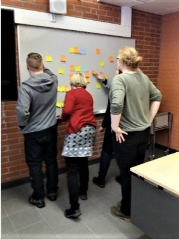
KUVA 1. Valtti-ryhmäläiset tekevät yhdessä tehtävää