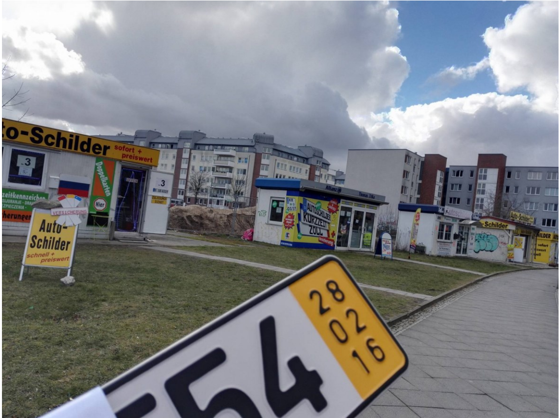
Kuva 1. Keltapäiset rekisterikilvet ja saksalaisia kilpisepäniikkeitä.

Kuvassa 1 on Saksassa käytössä olevat väliaikaiset keltapäiset rekisterikilvet ja taustalla rekisteröintitoimiston vieressä sijaitsevia kilpisepäniikkeitä.