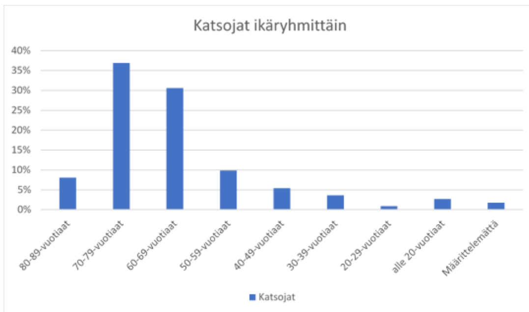
Kaavio 1. Paperikyselyyn vastanneiden katsojien kokonaismäärä ikäryhmittäin.

70-79-vuotiaista miehistä 4 ja naisista 10 jätti vastaamatta kysymykseen, kuinka olivat kuulleet operetista. Valtaosa vastanneista oli saanut tiedon lehdestä, joko Turun Sanomista tai paikallislehdistä. Selkeästi 70-79-vuotiaat seuraavat mainontaa vielä enemmän lehdistä kuin esimerkiksi internetistä. Siksi lehdessä mainostamista kannattaa tulevaisuudessakin jatkaa. Vain kaksi naisvastaajaa oli saanut tiedon operetista internetin välityksellä.