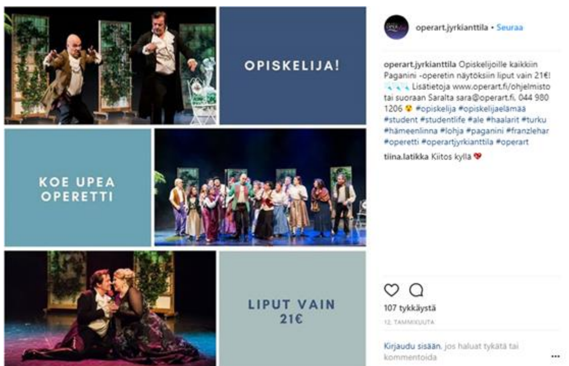
Kuva 1. Päivitys OperArtin Instagramista

OperArtilla on Facebookissa 1254 tykkääjää ja Instagramissa 313 seuraajaa. Molemmat sosiaalisen median kanavat ovat OperArtille melko uusia, vaikkakin Instagram on uudempi. Kumpikin kanava on kuitenkin ollut yrityksen käytössä ennen kuin aloitin tämän tutkimuksen.