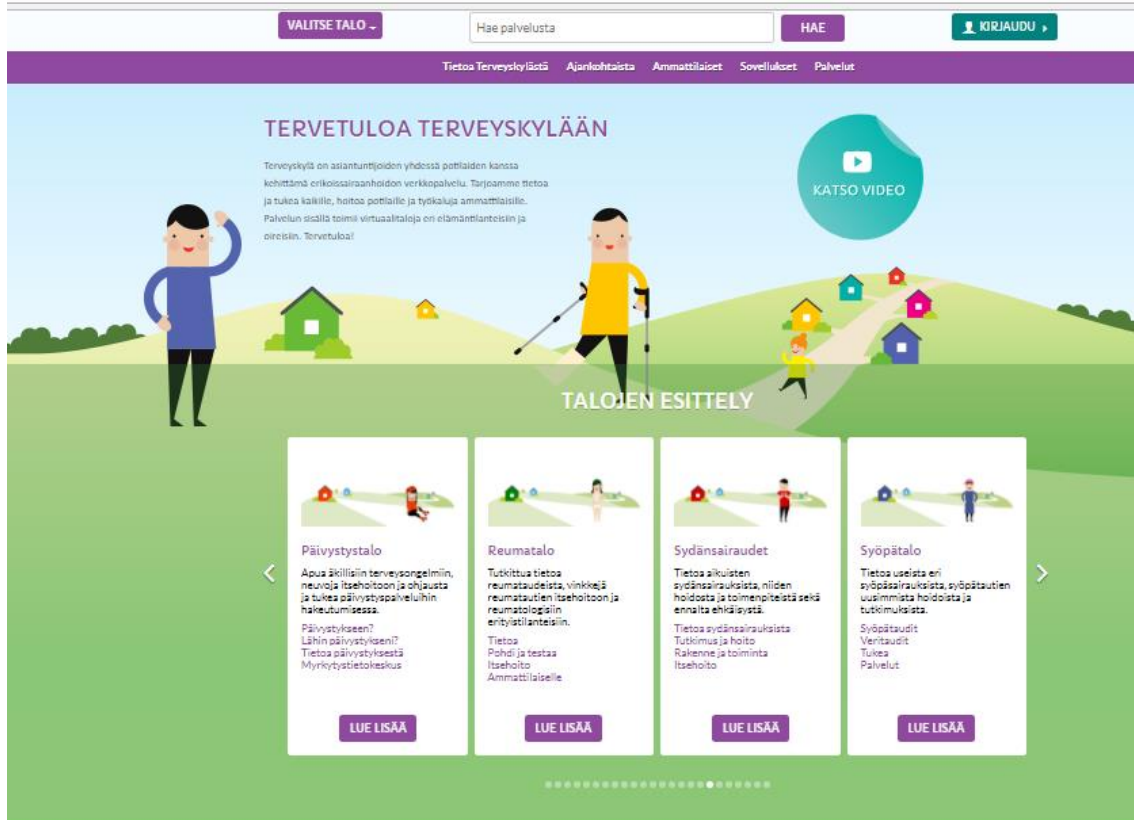
Kuva 11. Terveyskylä (Terveyskylä 2018, viitattu 21.3.2018)

Palvelun sisällä toimii virtuaalitaloja eri elämäntilanteisiin ja oireisiin. Terveyskylän palvelut sopivat erityisen hyvin elämänlaadun, oireiden ja elintapojen seuraamiseen sekä pitkäaikaisen sairauden kanssa elämiseen. Palvelut täydentävät perinteisiä hoitopolkuja. Terveyskylässä ovat avoinna Aivotalo, Allergia- ja astmatalo, Harvinaissairauksien talo, Leikkaukseen tulijan talo, Mielenterveys-talo, Naistalo, Nivelitalo, Kuntoutumistalo ja Kivunhallintatalo, Painonhallintatalo, Reumatolo, Sydänsairauksien talo, Syöpätalo, Verisuonitalo, Vertaistalo sekä Helsingin Biopankki ja ammattilaisen osio. Työn alla ovat mm. Lastentalo, Lääketalo, Diabetestalo ja Munuaistalo. Vuoden 2018 loppuun mennessä avoinna on noin 30 taloa. (Terveyskylä, 2018, viitattu 5.2.2018.)