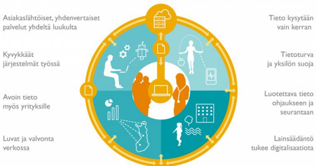
Kuva 7. Digitalisaation visio (Sosiaali- ja terveysministeriö 2018d, viitattu 7.2.2018)

Toimintojen onnistunut asiakaslähtöinen digitalisointi edellyttää, että koko hallinnonalan digitalisaatiota toteutetaan yhdessä ja koordinoidaan kokonaisuutena. Palvelut asiakaslähtöiseksi hankkeessa kokeillaan erilaisia tapoja toteuttaa sote-palvelut niin, että jokainen voi saada tarvitsemansa