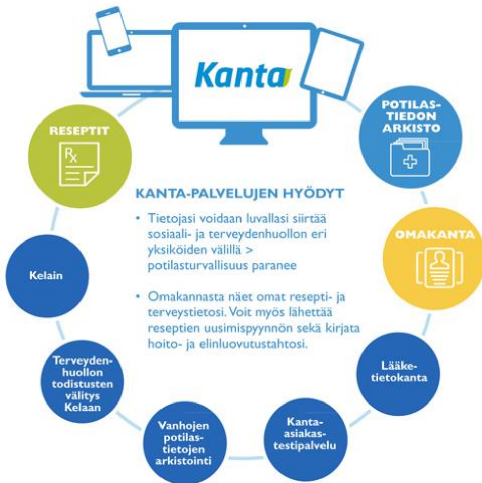
Kuva 10 Kanta-palvelut. (Kanta 2017, viitattu 27.2.2018.)

Sosiaalihuollon Kanta-palveluita ovat asiakastiedon arkisto ja Omakanta. Sosiaalihuollon asiakastiedon arkistoon tallennetaan kaikki sosiaalipalveluissa syntyvät, asiakasta koskevat asiakasasiakirjat. Asiakastiedon arkistoa tullaan käyttämään niin julkisessa kuin yksityisessä sosiaalihuollossa. Omakannan kautta sosiaalihuollon työ tulee asiakkaalle näkyväksi. Omat asiakasasiakirjat voi nähdä ilman, että asiakkaan tarvitsisi pyytää niitä tarkastusoikeuden perusteella nähtäväkseen. Myös sähköisen asioinnin mahdollisuudet ovat parantuneet Omakannan käyttöönoton myötä. (Terveyden ja hyvinvoinninlaitos 2017c, viitattu 1.3.2018.)