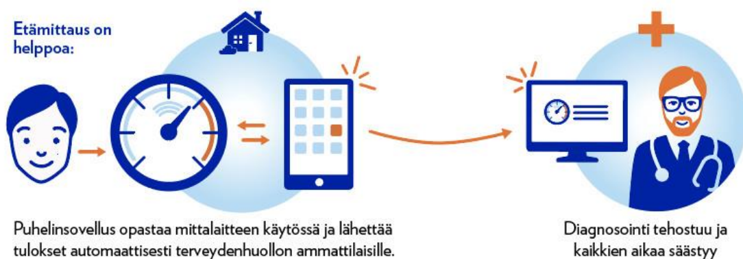
Kuva 9. Elisa Etämittaus-palvelu (Elisa 2018, viitattu 1.3.2018)

Yksi esimerkki terveydenhuollon digitalisaatiosta on Elisan Etämittaus-palvelu (kuva 9), joka on käytössä muun muassa Hämeenlinnan sähköisten terveystiedotien tukena. Elisa Etämittaus on älypuhelimilla käytettävä sovellus, joka välittää mittaus tulokset automaattisesti mittauslaitteelta terveydenhuollon ammattilaisten hyödynnettäväksi. (Elisa 2018, viitattu 1.3.2018.)