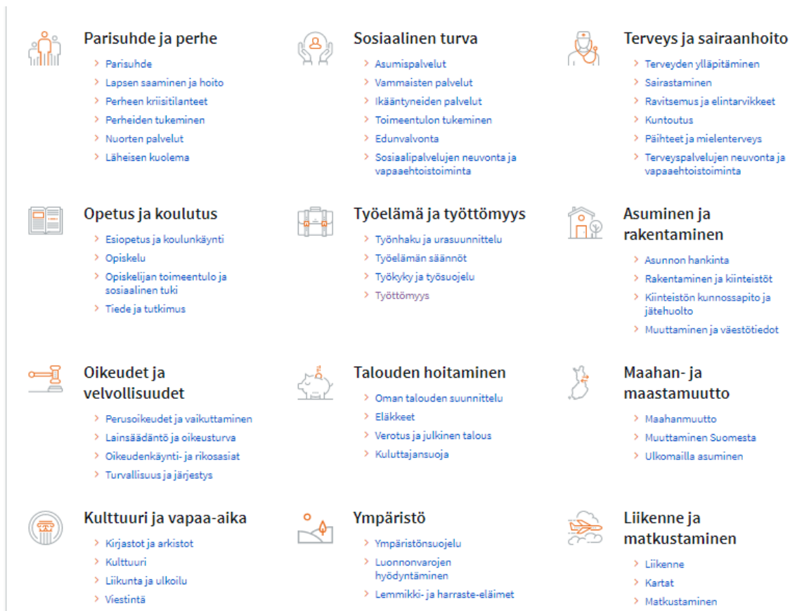
Kuva 6. Suomi.fi-verkkosivusto (Suomi.fi, viitattu 22.3.2018)

Julkiset palvelut ovat palveluita, joita valtio yhdessä kuntien kanssa tarjoavat ihmisille. Palvelut voivat olla kuntien järjestämiä, tai niitä on voitu hankkia yksityisiltä toimijoilta. Suomessa julkisia palveluita ovat esimerkiksi varhaiskasvatus, koulutus, sosiaali- ja terveydenhuolto, rakentamiseen liittyvät palvelut sekä työ- ja elinkeinopalvelut. Suomi.fi verkkopalvelu (kuva 6), on väestörekisterikeskuksen ylläpitämä palvelu, josta löytyvät Suomen tarjoamat julkiset palvelut ja tietoa eri tilanteisiin. Suomi.fi tarjoaa julkisen hallinnon asiakkaille pääsyn omiin tietoihin sekä sähköisiin viesteihin ja valtuuksiin helposti yhdestä paikasta. (Suomi.fi 2018, viitattu 22.3.2018.)