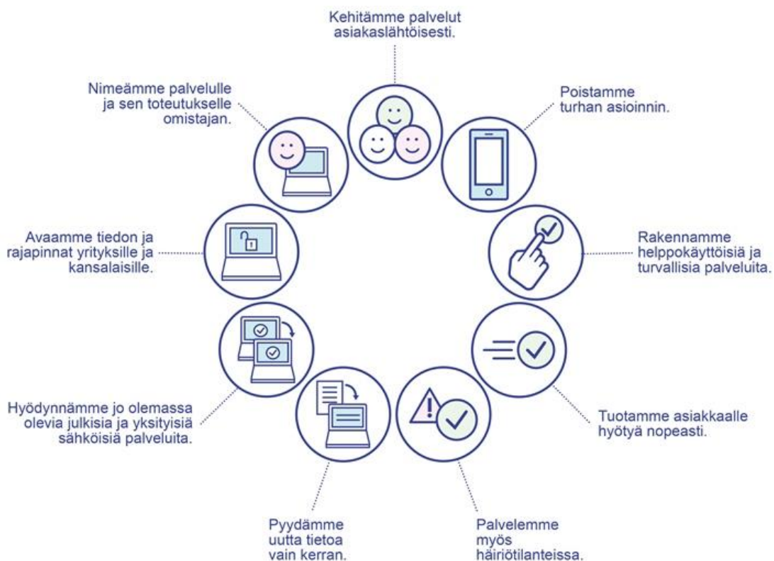
Kuva 2. Hankkeen 9 digitalisoinnin periaatetta (Valtiovarainministeriö 2017b, viitattu 29.11.2017)

Digitalisoinnin pohjaksi on otettu 9 periaatetta (kuva 2) jotka luovat raamit julkisten palveluiden kehitykselle. Periaatteita on yhdeksän, ja niillä linjataan muun muassa tiedon hyödyntämisestä ja rajapinnoista, palvelun omistajuudesta ja varautumisesta sekä asiakaslähtöisyydestä. (Valtiovarainministeriö 2016b, viitattu 29.11.2017.)