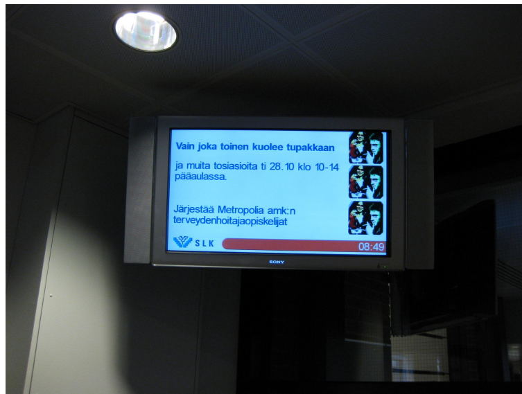
KUVA 1. Teemapäivän mainos Pasilassa.

Terveydenhoitajat järjestivät mainoksemme näkymään koulujen infotv -ruuduilla viikkoa ennen teemapäivän toteutumista. He myös tulostivat lausetta A4-koossa ja levittivät sitä kouluissa näkyville paikoille mainoksena. (kuva 1.)