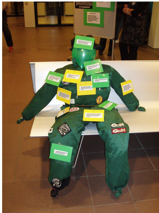
KUVA 2: Ihmisfiguuri

Pisteeseemme olimme suunnitelleet opiskelijahaalariasuisen ihmishahmon, jonka kehoon kiinnittäisimme laminoituja tekstejä (kuva 2). Hahmon oli tarkoitus olla pystyssä tukirungon avulla, mutta päädyimme käytännön syistä asettamaan hahmon