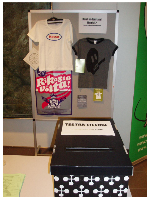
KUVA 3: Väittämävissailun vastauslaatikko.

Väittämävissailu oli suunniteltu osaksi tupakkateemapäivää siten, että se olisi ns. viimeinen rasti eli kävijät vastaisivat siihen tutustuttuaan ensin muuhun tarjontaan (kuva 3). Lomakkeen oli suunniteltu sisältävän tupakkateemapäivään liittyviä väittämiä ja visailuun oikein vastanneiden kesken oli tarkoitus arpoa muutama palkinto päivän lopuksi ja näin lisätä osallistumisaktiivisuutta.