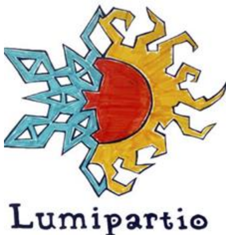
Kuvio 1. Lumipartion logo (Aurinkorannikon suomalainen ev.lut. seurakunta 2018)