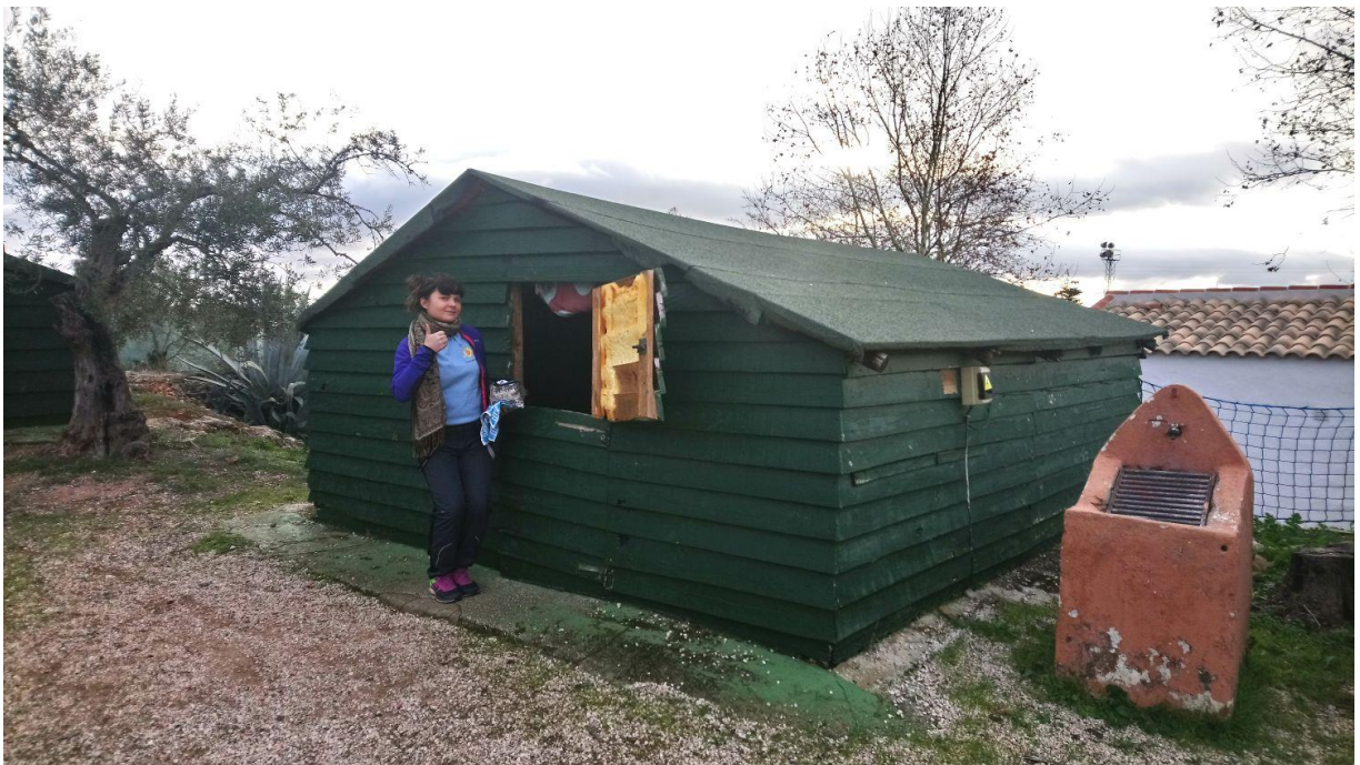
Kuva 1. Partiojohtajien leirimökki Sierra de las Nievesin leirintäalueella.

dyntäen ympäristöä ja luontoa. Luonto on hyvin erilainen verrattuna Suomen luontoon, joten uusia elämyksiä saa helposti. Uusien asioiden kokeminen yhdessä muiden kanssa on palkitsevaa. Yhteisö kasvattaa, koska ryhmässä elämysten läpikäyminen ja palautteen antaminen ja saaminen kasvattavat yksilöä. Yhteisten kokemusten kautta oppii itsestään yksilönä sekä ryhmänjäsenenä. Kulttuuriset käytännöt ja tavat olivat myös hyvin erilaiset Suomeen verrattuna, joten uusia taitoja Espanjassa oppi pakostikin. (Räty 2011, 11-12.)