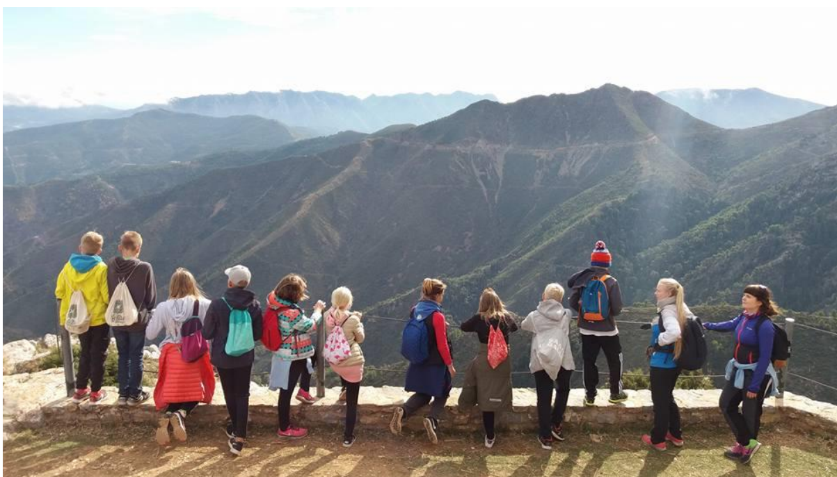
Kuva 4. Tarpojat vaelluksella Sierra de las Nievesin kansallispuistossa.

Partioaktiviteetit ovat muun muassa leireille osallistumista, retkeilyä luonnossa, tellassa nukkumista, oppimista tekemisen ja kokemisen kautta ja ryhmässä toimimista. (Suomen Partiolaiset – Finlands Scouter ry 2018). Nämä aktiviteetit vaativat ennakkointia ja aktiviteettien kautta voi tulla helposti eteen ongelmanratkaisutilanteita. Lapsille ja nuorille ongelmanratkaisua on hyvä opetella jo aikaisessa vaiheessa, mutta aikuisella täytyy olla ongelmanratkaisutaitoa jo entuudestaan. Kaikkien aikuisten sekä lasten on ajateltava yhteisen edun mukaan ja jätettävä oma etu syrjään. Leireillä yhteisen edun ajatteleminen korostuu, kun on selviydyttävä yhdessä. (Suoranta 1999, 77.)