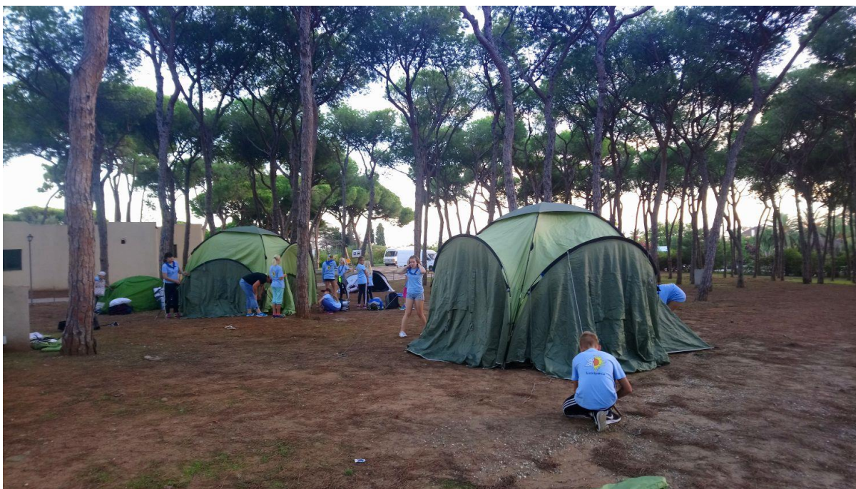
Kuva 5. Partiolaiset pystyttämässä teltoja Suomi100-leirillä.

toiminnan myötä seikkailujen toteutuminen on mahdollista. Lapset ja nuoret muistavat selviytymisen, yhdessä ongelmanratkaisemisen ja onnistumisen tunteen pitkään. (Räty 2011, 33-34.) Partiojohtaja voi saada apua ongelmanratkaisutehtäviin partiolaisilta, jossa molemmat pääsevät oppimaan ja pystyvät kehittämään itseään. Esimerkiksi isojen joukkueteltojen pystyttäminen leireillä vaati lapsilta sekä aikuisilta ongelmanratkaisuntaitoja. Johtaja oppii tällöin myös jakamaan vastuita ja tehtäviä ja parantaa näin jokaisen yksilön kasvua. Johtajan täytyy sitoutua myös oman johtajuuden kasvuun. Etusijalle on kuitenkin aina laitettava lapsen ja nuoren kasvu sekä onnistumisen kokemuksien takaaminen lapsille. Oman johtajuuden kehittäminen vasta sen jälkeen. (Niilo-Rämä 2008, 240.)