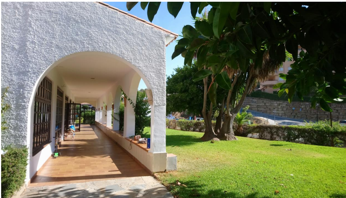
Kuva 3. Pacosintupa syyskuussa 2017.

Pacosintuvan toiminnan pääpaino on enemmän ennaltaehkäisevässä työssä, jolla pyritään tavoittamaan suuria ihmismääriä. Tärkein toimintaedellytys jatkuvuuden kannalta on asiakkaiden ja vapaaehtoistyöntekijöiden aktiivisuus ja myönteisyys. (Suikki-Honkanen 1996, 83.) Lumipartion toiminta on mielestämme ennaltaehkäisevää toimintaa. Lumipartio on suomenkielinen harrastusmahdollisuus, jossa lapset voivat tutustua toisiin ikätovereihinsa ja tätä kautta heidät saa osallistettua suomalaisyhteisöön. Suomenkieliset harrastustoiminnat lapsille sekä nuorille ovat erittäin vähäiset Fuengirolan alueella. Nuorille Lumipartio tuntuu olevan paikka, missä voi tavata kavereita.