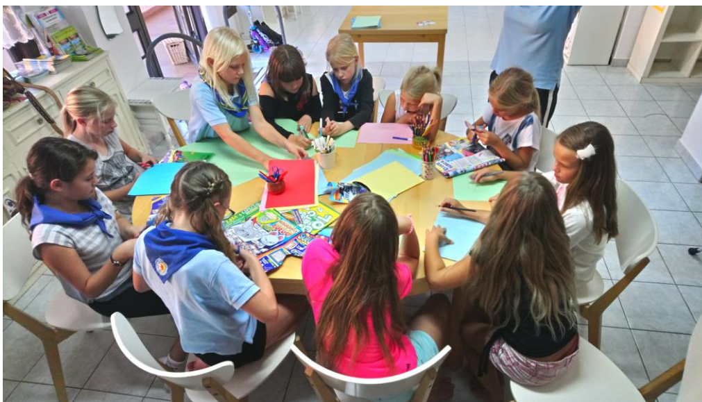
Kuva 2. Seikkailijat askartelemassa unelmakarttoja.

Tämän päivän yksi huolestuttavimmista aiheista on nuorten lisääntyvä henkinen pahoinvointi. Suurin osa lapsista voi hyvin, mutta silti monen lapsen arjessa on ongelmia. Arjesta voi puuttua vanhempien tai muiden aikuisten läsnäoloa, välittämistä, huolenpitoa, kasvatusta ja valvontaa. Partio voi toiminnallaan luoda pitkäjänteisyyttä epätasapainoiseen arkeen. Lippukunta on yhteisöllisyyttä parhaimmillaan, ja erikäisten ihmisten kohtaamispaikkana se tarjoaa aikuisuuden malleja. (Niilo-Rämä 2008, 36-37.) Harrastustoimintana partio voi luoda lapselle turvallisuuden tunnetta ja pysyvyyttä arkeen. Partio on päihteetöntä toimintaa, joten nuori oppii pitämään hauskaa ilman alkoholia.