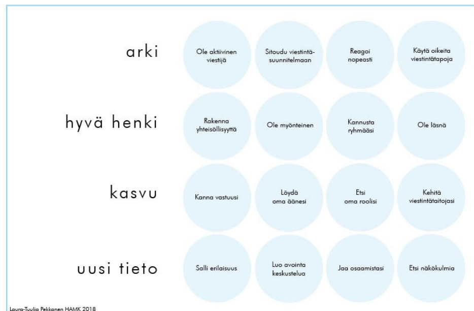
Kuva 1. Hyvän projektiviestinnän graafisesti ilmaistu malli.