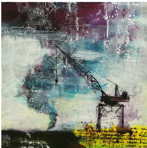
Kuva 1. Ville Rätty, Vail of snow

ei aina tule ajatelleeksi ja mieli saattaa yrittää sensuroida ylimääräiset nostokurjet. Vaikka työt ovat osittain viitteellisesti tehtyjä, niistä välittyy selkeä maisema ja tunnelma.