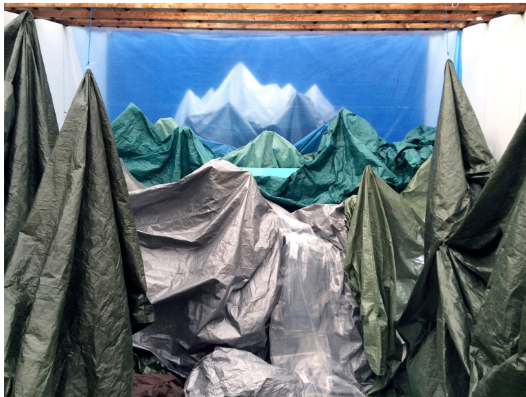
Kuva 3. Pia Sirén, Backdrop

myös maalannut tilallisia maisemamaalauksia ja ne ovat installaatioiden mukaan hyvin pelkistettyjä ja sopivat hyvin yhteen niiden kanssa.