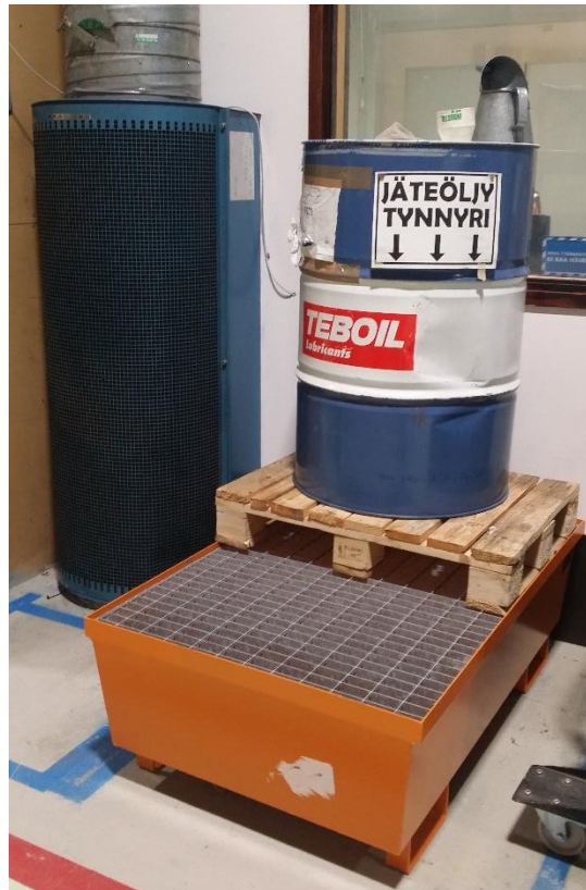
Kuva 3. Yksiselitteisesti merkitty jäteöljytynnyri, joka on sijoitettu tilavuudeltaan riittävän suoja-altaan päälle. Jos tynnyrin sisältö pääsee vuotamaan, koko sisältö mahtuu altaaseen.

Havaintoja tehtiin myös vaarallisten jätteiden säilytyksestä. Tehtaalla tapahtuvien muutosten myötä jotkin ratkaisut saattavat tilapäisesti jäädä puutteellisiksi. Ympäristöjärjestelmän näkökulmasta tällaisiin tilanteisiin on luotava käytännöt, jotta tilanteesta riippumatta vaaralliset jätteet on säilytetty aina niin, ettei poikkeustilanteissa (öljyvuodot, tms.) aiheudu ympäristöpilaantumisen vaaraa vaan haitat on minimoitu. Suoja-altaat ja asianmukaiset säiliöt ja astiat ovat yleisiä ratkaisuja, ja myös Roclalla käytössä. Kuvassa 3 alla on esimerkkinä jäteöljyn asianmukainen säilytys. Vaarallisten jätteiden säilytys ja tilapäinen varastointi kiinteistöllä tulee mahdollisuuksien mukaan olla valvottua ja tilat lukittuja.