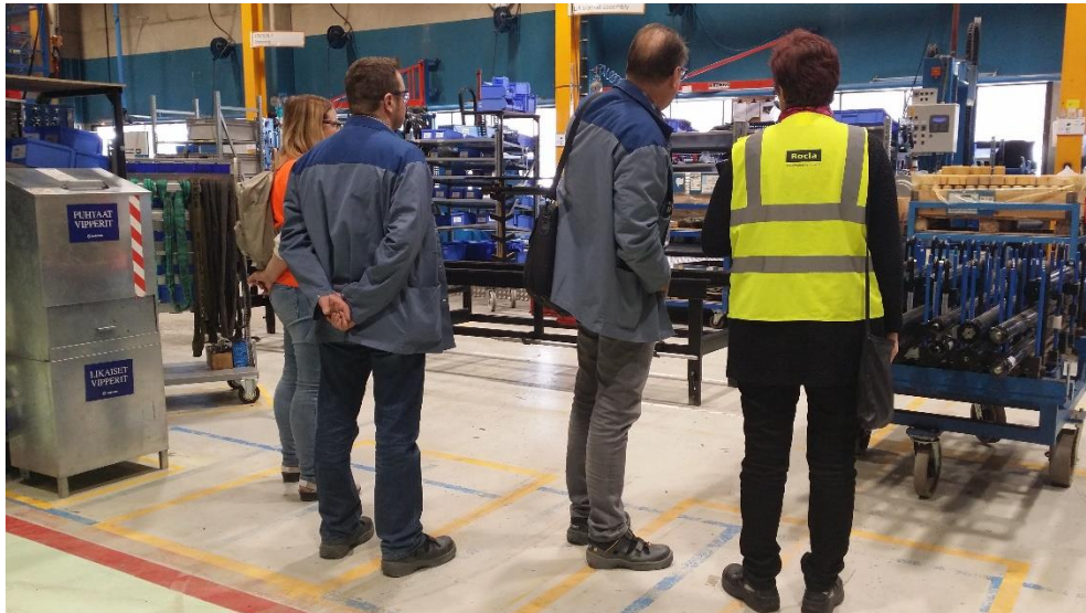
Kuva 4. Tehdaskierroksella esiauditoinnin ensimmäisenä päivänä. Jal kautumalla tuotantoon tehdään konkreettisia havaintoja vaatimusten käytännön toteutumisesta ja tarpeellisista toimenpiteistä.

nykytilaa havainnoitiin tehdaskierroksella, jonka aikana kuljettiin kattavasti läpi kaikki tuotantotilat (Kuva 4 alla). Kierroksen jälkeen käytiin läpi ISO 9001 laatu-järjestelmään liittyen Check-list -tyyppinen lomake, peilaten auditoijan havaintoja standardin olennaisiin kohtiin. Myös Ympäristöjärjestelmän asioita sivuttiin samalla ensimmäisenä päivänä.