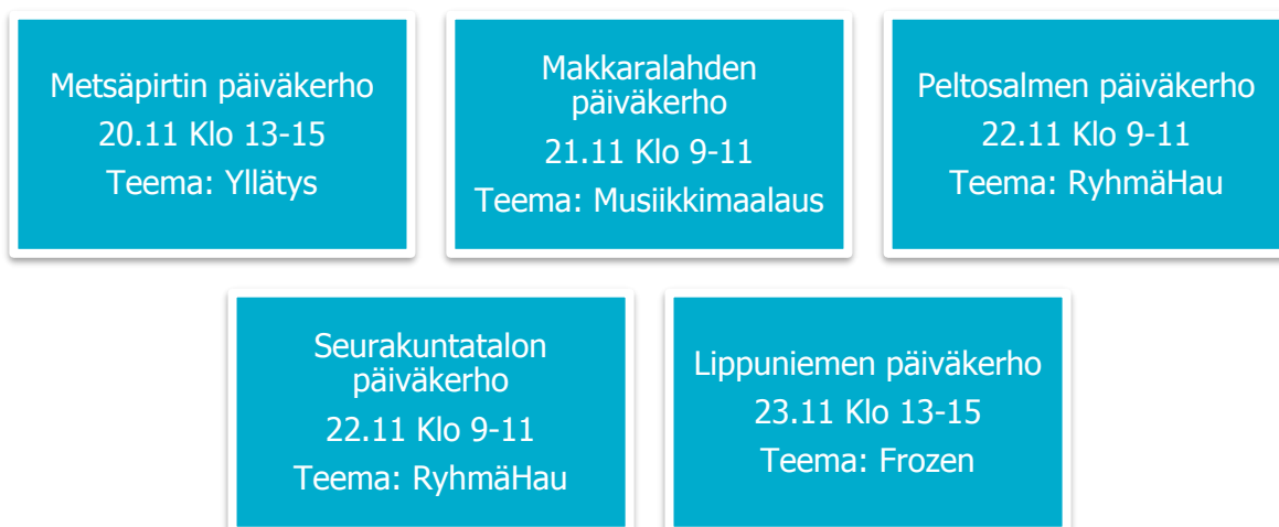
Kuvio 4. Lastenohjaajien toteuttamien päiväkerhojen teemat ja ajankohdat (Korhonen ja Soininen 2018).