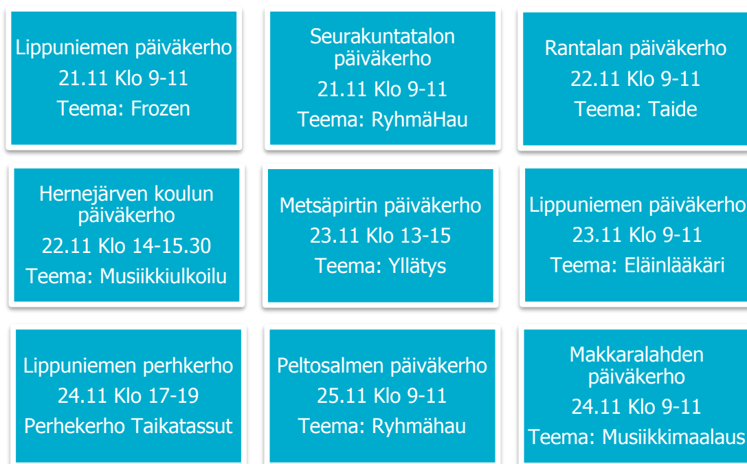
Kuvio 3. Toteutettamiemme päiväkerhojen teemat ja ajankohdat (Korhonen ja Soininen 2018).

Toteutimme itse kahdeksan päiväkerhoa ja yhden iltaperhekerhon kehittämiemme pedagogisten suunnitelmien mukaisesti. Tämän lisäksi lastenohjaajat toteuttivat vielä viisi päiväkerhoa itsenäisesti kehittämiemme pedagogisten suunnitelmien mukaan. Kuviossa 3 on kuvattu toteuttamiemme päiväkerhojen ja perhekerhon ajankohdat ja teemat. Kuviossa 4 löytyy lastenohjaajien toteuttamat kerhot, niiden ajankohdat ja teemat. Kerhojen pedagogiset suunnitelmat löytyvät liitteestä 1.