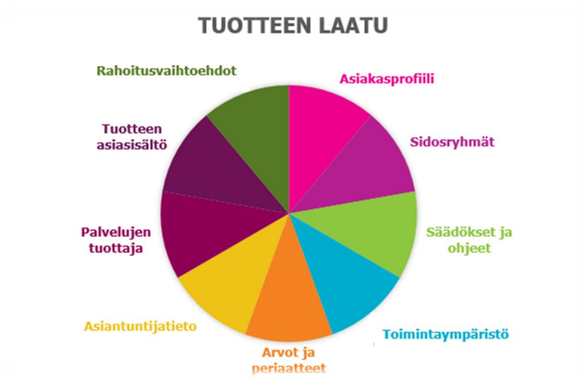
Kuvio 2. Tuotteen luonnostelua ohjaavat näkökohdat (Mukaillen Jämsä ja Manninen 2000, 43)

Jämsä ja Manninen (2000, 43–52) kuvaavat yhdeksän tuotteen luonnostelua ohjaavaa näkökohtaa. Nämä vaiheet on esitetty kuviossa 2. Kuvaamme luonnosteluvaiheen näiden vaiheiden kautta, vaikka opinnäytetyössämme tähän vaiheeseen kuuluvat asiat ovat osittain toteutuneet jo edellä kuvatuissa ideointi- ja kehittämisvaiheissa.