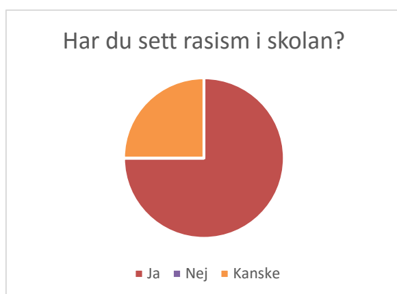
Figur 1 Har du sett rasism i skolan, åttondeklassister

På frågan om de känner någon som integrerats i samhället svarade åttonde klassisterna igen alla ja, medan sjätteklassisterna svarade två ja, två nej, en kanske och en som valt att inte svara på frågan.