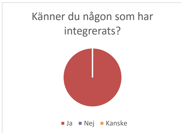
Figur 3 Känner du någon som har integrerats, åttondeklassister

Eftersom det här var en fråga där svaren i de olika grupperna var väldigt olika så valde vi att ta med den. Åttonde klassisterna har alla svarat ja på frågan om de vet vad integration betyder. Hos sjätteklassisterna ser man att endast hälften av deltagarna visste vad integration betyder, två vet kanske vad det betyder och en vet inte vad integration betyder.