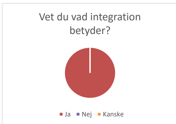
Figur 1 Vet du vad integration betyder, åttondeklassister

För att få en bild av vad deltagarna från båda grupperna svarat på vår enkät har vi valt att ta med diagram från några av frågorna för att visa en tydligare skillnad på svaren. Åttonde klassisternas, eller första gruppens, svar kommer presenteras på vänster sida medan sjätteklassisterna, eller andra gruppens, svar kommer presenteras på höger sida.