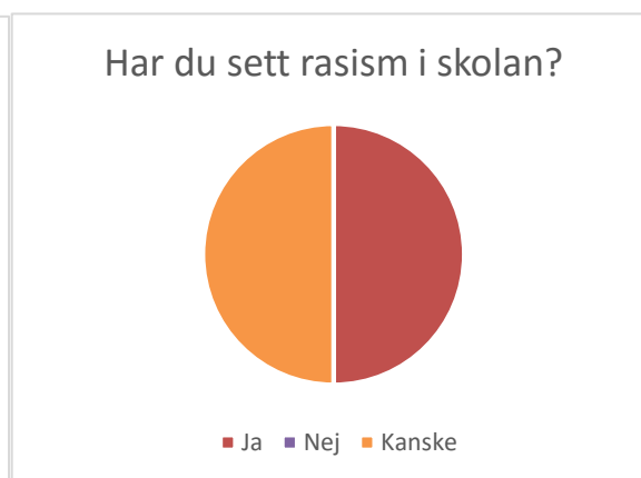
Figur 2 Har du sett rasism i skolan, sjätteklassister

På frågan om de sett rasism i skolan svarade första gruppen 75 procent ja och 25 procent kanske. Andra gruppen svarade 50 procent ja och 50 procent kanske.