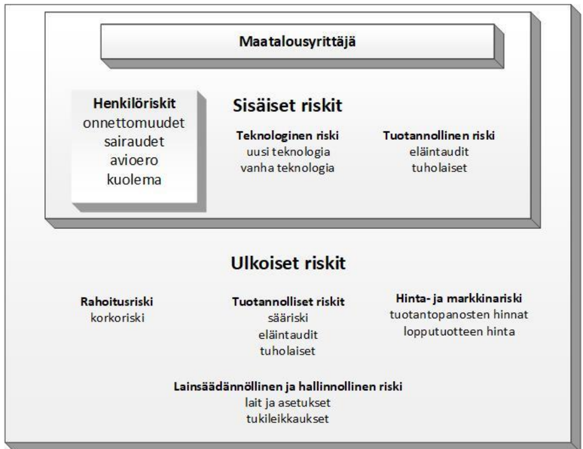
Kuvio 2 Opinnäytetyön teoreettinen viitekehys.

Maatalousyrittäjän tulisi tunnistaa maatalousyrittäjän kannalta merkittävät ja todennäköiset riskit. Riskien todennäköisyys vaihtelee yrityskohtaisesti. Tämän opinnäytetyön tutkimus kohdistuu avioeroon ja kuolemaan, jotka ovat sisäisiä riskejä.