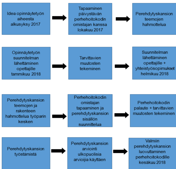
KUVIO 2. Perehdytyskansioprojektin eteneminen.