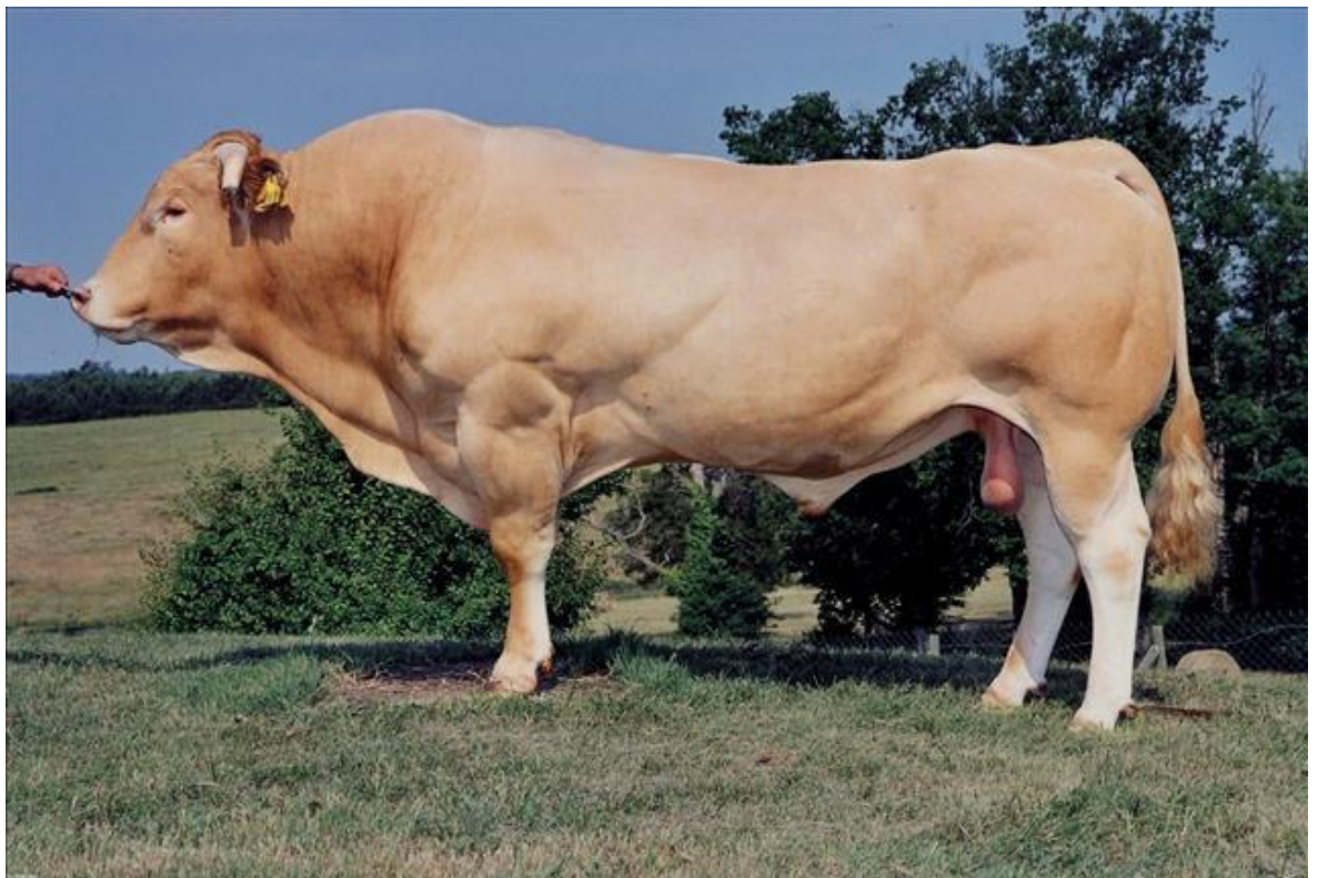
KUVA 1. Risteytyskäyttöön sopiva blondisonni Romarin (Faba s. a.b.)

Suosituin risteytyskäytössä oleva rotu on blonde d'aquitaine, jota kutsutaan yleisesti nimellä blondi. (kuva 1). Poikimiset ovat sujuneet pääasiassa ongelmitta ja teurastulokset ovat olleet hyviä, mikä selittää rodun suosion huimaa kasvua viime vuosina. Tällä hetkellä risteytysvasikoista jo lähes 60 prosenttia on blondiristeytyksiä. (Sirkko 2017.)